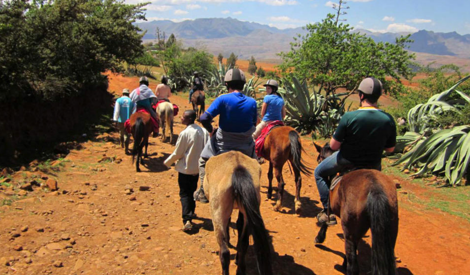
Ponniridning i Lesotho

Dagen avsluttes i Cape Town, hvor denne fantastiske rundreisen med Nomad også ender.