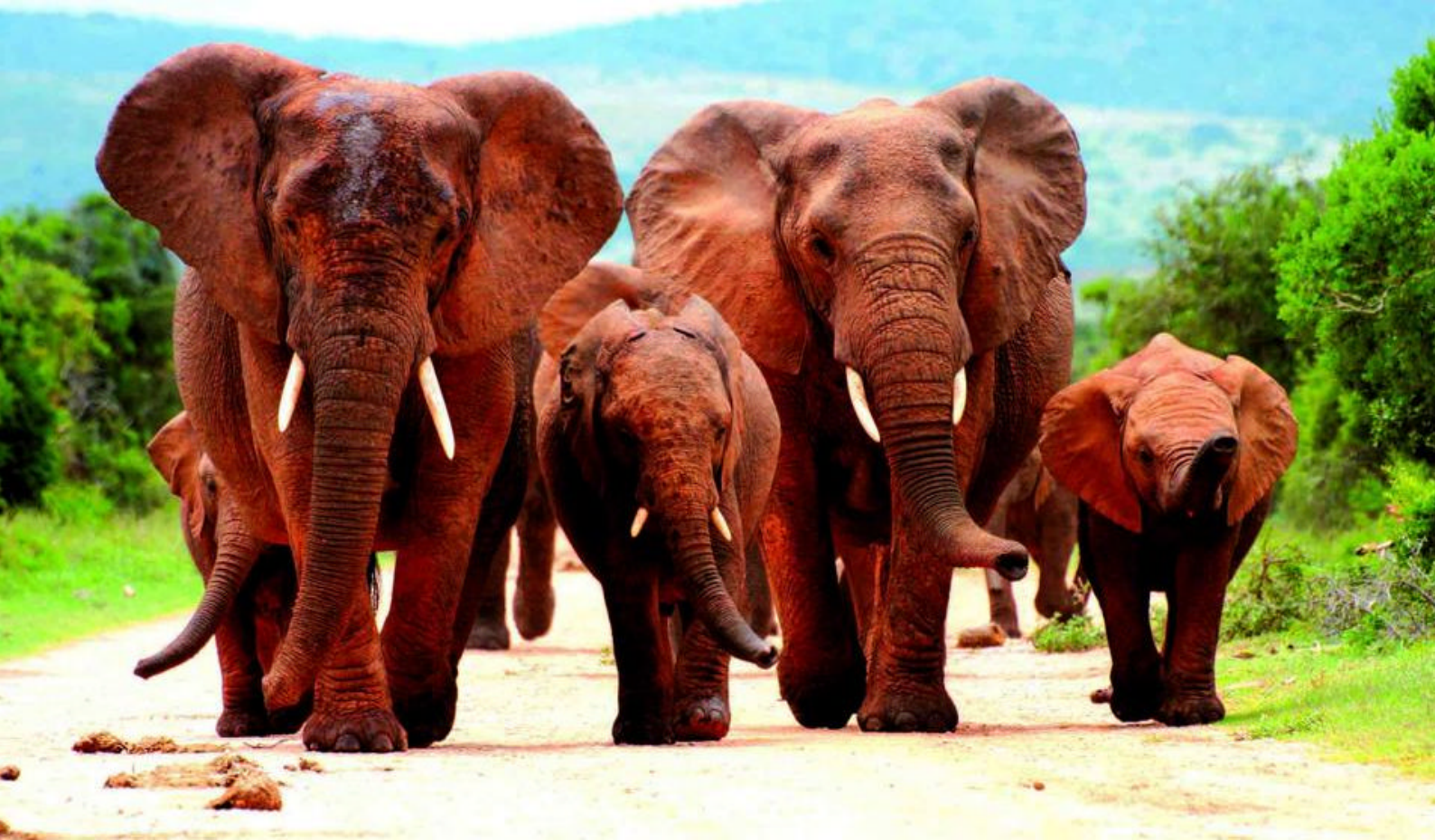
Elefanter i Addo Elephant National Park

bo i to netter, og når dere kommer frem, arrangeres det en Game Drive i Addo Elephant National Park for å se de berømte elefantene, som parken er oppkalt etter.