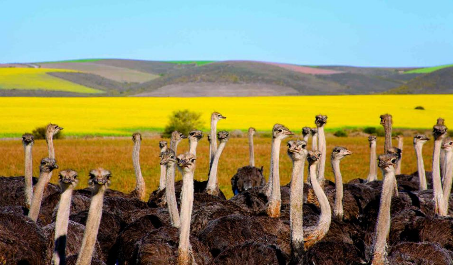
Struts i Oudtshoorn