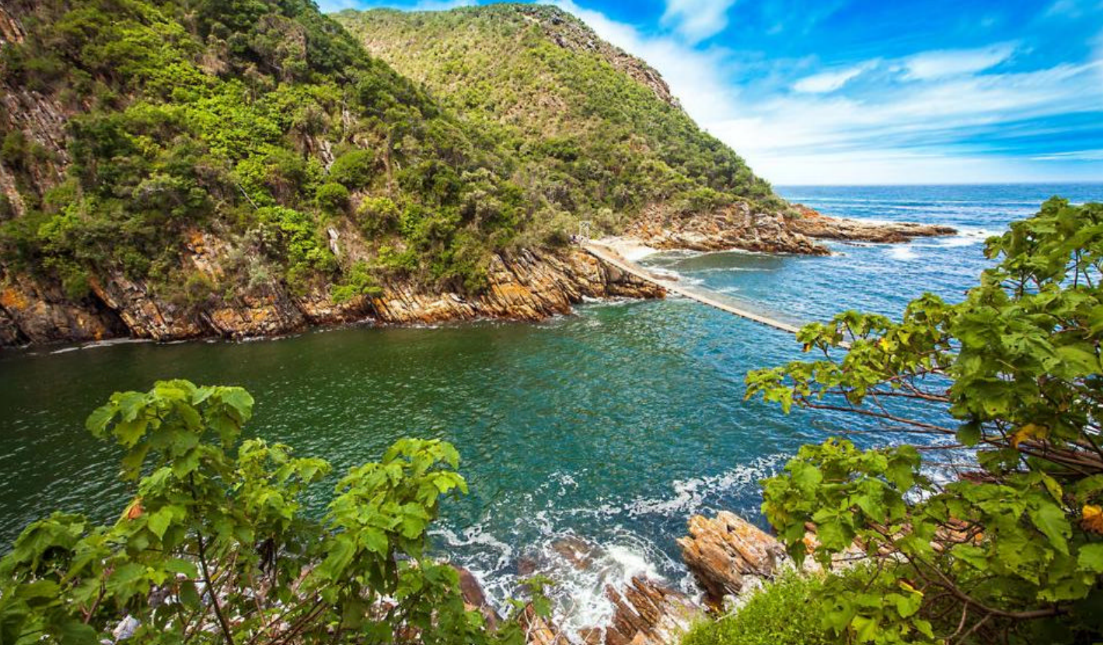
Tsitsikamma National Park