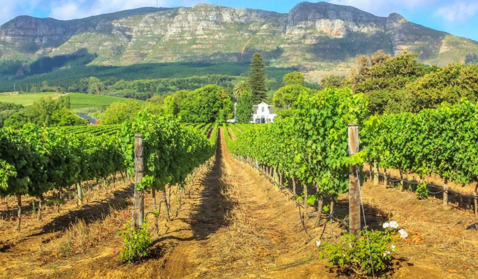
Vingård i Stellenbosch med Thelema Mountain som bakteppe

Overnatting: Permanent safaritelt med bad i Nkambeni Safari Camp