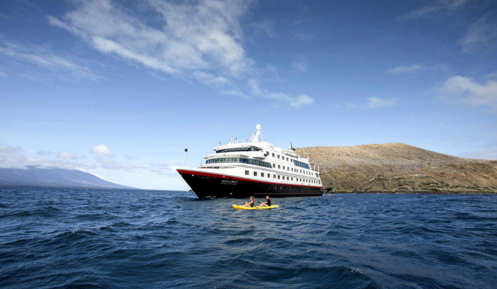
Santa Cruz II

Det lille toget stopper etter et par timer i landsbyen Aguas Calientes. Her går dere av og tar en kort busstur opp til ruinene av Machu Picchu. Denne ikoniske inka-høyborgen ligger på toppen av et fjell, rundt 2500 moh, noe som gjorde dette stedet uangripelig for fiender. Inkaene forlot byen, og den omkringliggende jungelen holdt den skjult i flere århundrer før det ble gjenopdaget i 1911 av den amerikanske arkeologen Hiram Bingham.