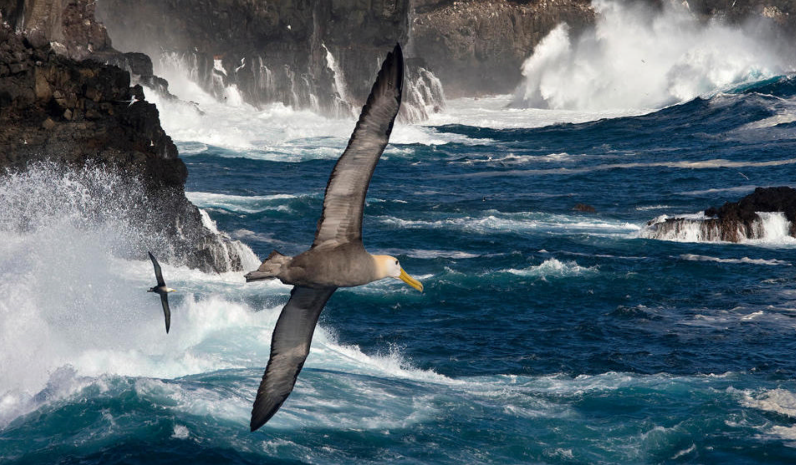
Galapagos albatrossen er unik og kan ses i hopetall på øyene

Når dere har spist lunsj, har dere flere aktiviteter å velge mellom enn bare skilpaddetitting. Dere kan for eksempel prøve deg på terrengsykling eller padle kajakk i Tortuga Bay. Dere kan også gå de to kilometerne til den vakre bukten og stoppe innom Playa Brava, en vakker, kritthvit strand og et sesongbasert hekkested for grønne havskilpadder. På den samme spaserturen går dere forbi Playa Mansa, en naturlig bukt med mangrover og klart, rolig vann som er perfekt for bading, snorkling og kajakkpadling. Dere kan også bare nyte utsikten mens du sitter i skyggen av en mangrove.