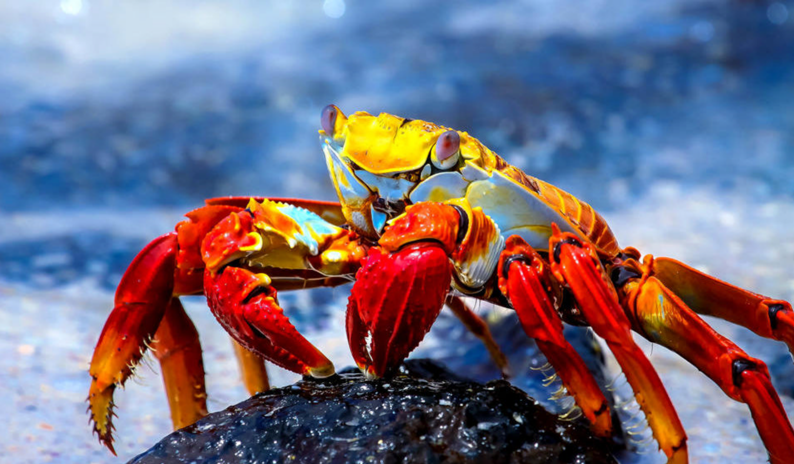
Galapagos Sally Lightfoot krabbe

havet. Dyrelivet her er rikt og variert og dere kan håpe på å få et glimt av de grønne havskilpaddene, skatene og revhaiene på Galápagosøyene, i det klare, grunne vannet. Dere tar med snorklingutstyret, så husk å ta med badedrakt hvis dere vil utforske revene. Hvis været er fint kan dere også ta en tur i båten med glassbunn eller padle i kajakk langs kysten av Eden. Hold utkikk etter fregattfugler på land med sine karakteristiske røde strupesekker.