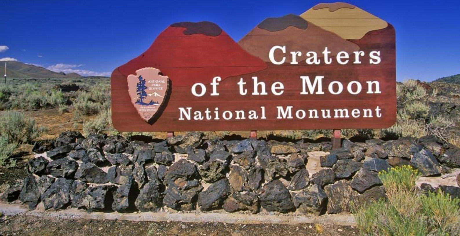
Craters of the Moon National Park

valgte hotell. Dere kan bruke resten av ettermiddagen til å utforske området rundt Baker City. Vest for byen har dere mulighet til å bli med på en tur med damplokomotivet - Sumpter Valley Railroad fra McEwan til den gamle gullgraverbyen Sumpter. Midt i Baker City ligger det gamle historiske hotellet - Geiser Grand Hotel, som sies å være besøkt av spøkelser. Det arrangeres derfor spesielle spøkelsesturer på hotellet flere ganger i løpet av året.