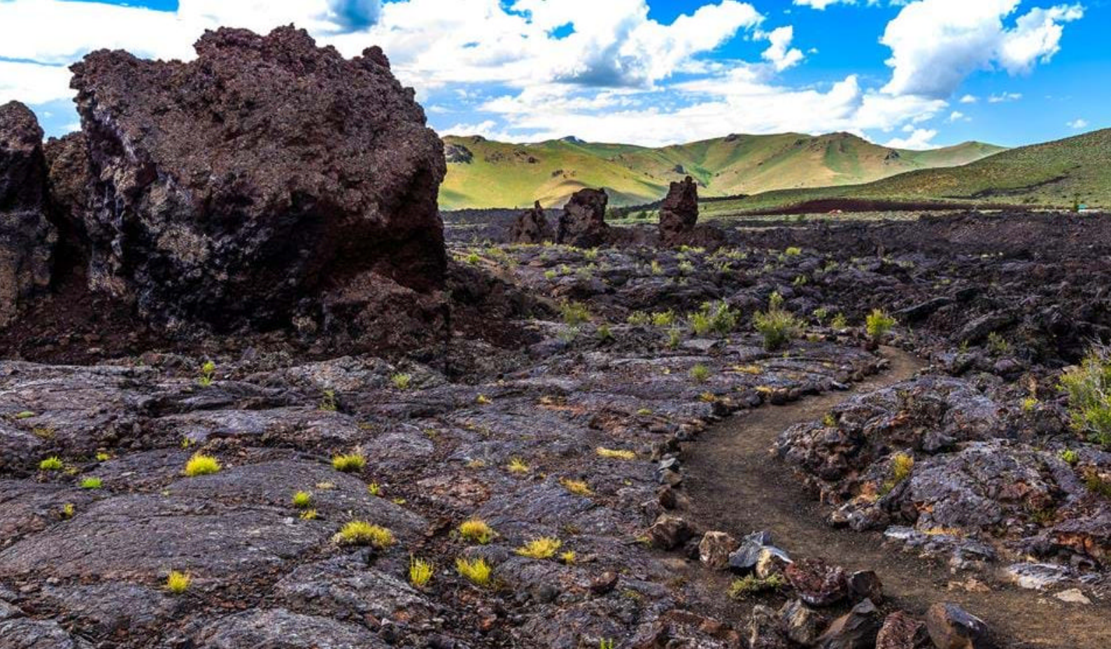
Craters of the Moon National Park