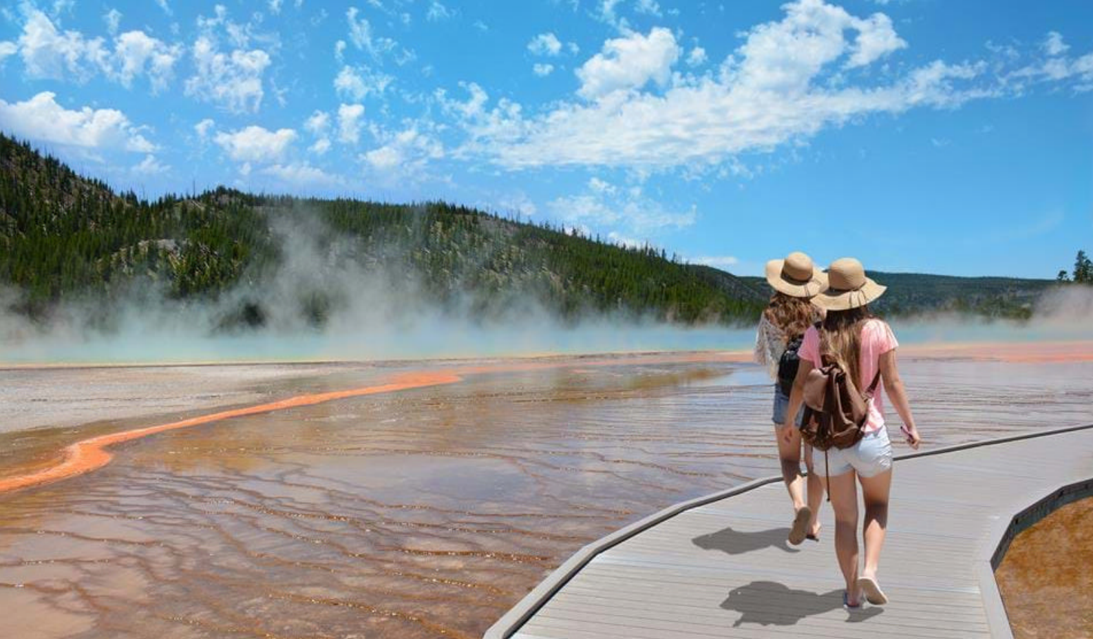
Yellowstone National Park

urfolkskulturen og ikke minst militæret og deres fort.