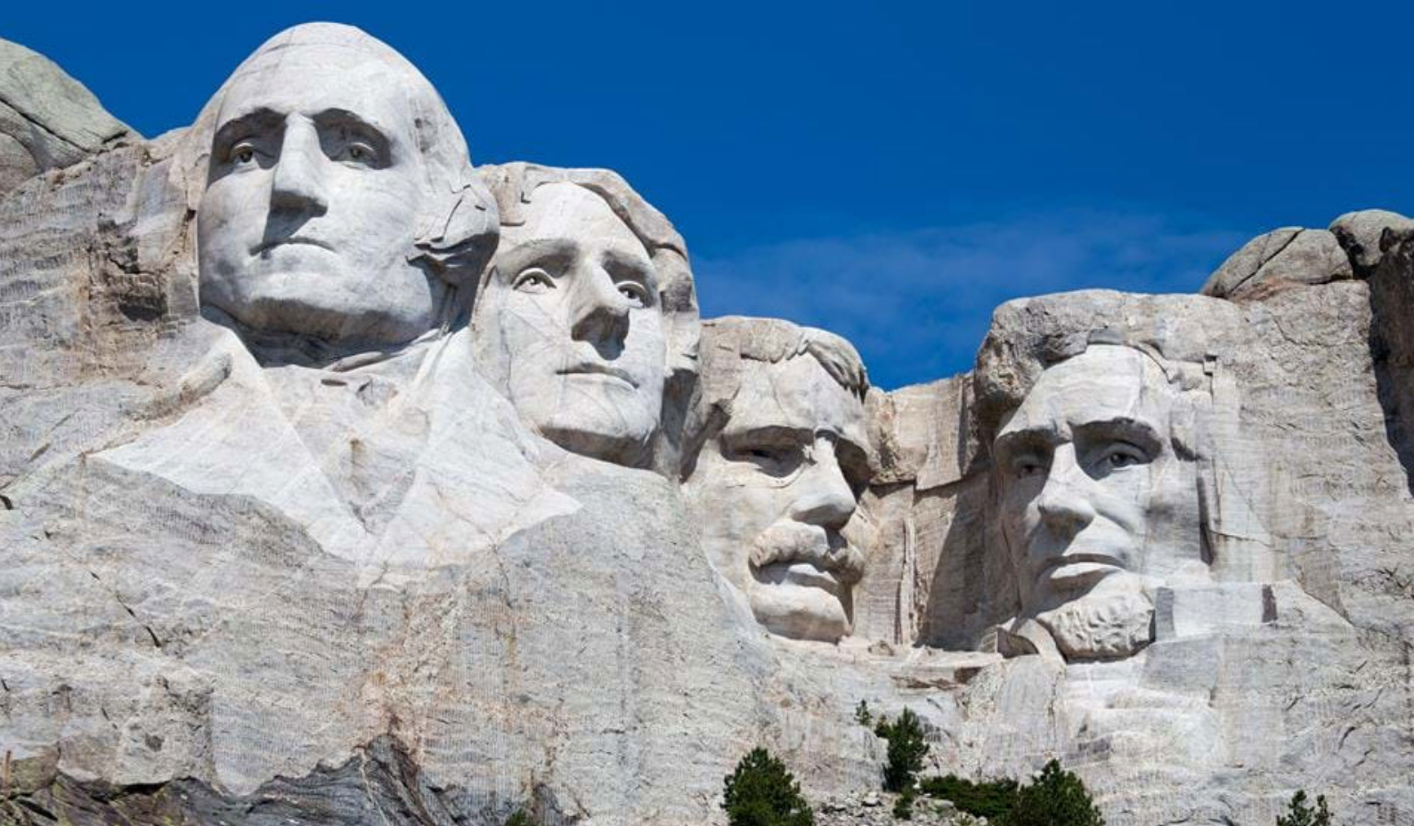
Mount Rushmore i South Dakota