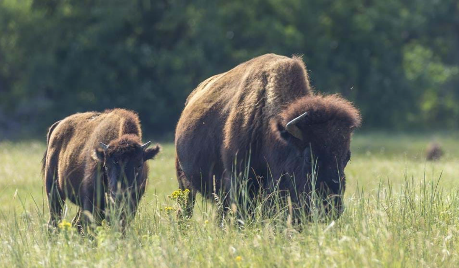
Bison i South Dakota

danner en liten innsjø i mange forskjellige farger, hvor små organismer i forskjellige farger lever i forskjellige vanntemperaturer som dannes i kanten av innsjøen.