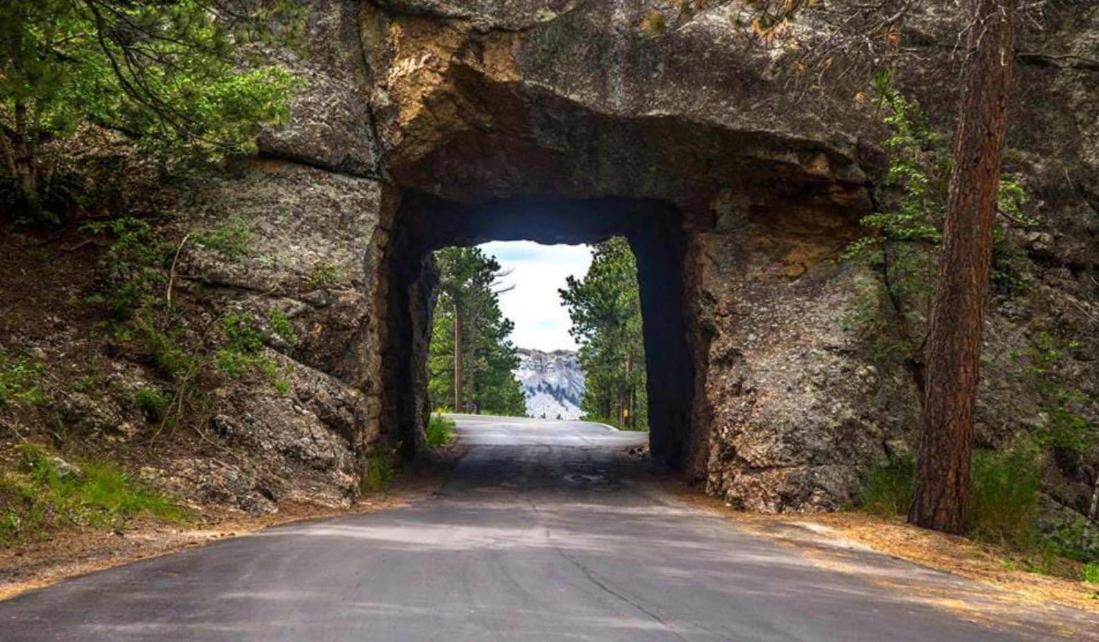
Needles Highway i Black Hills, South Dakota