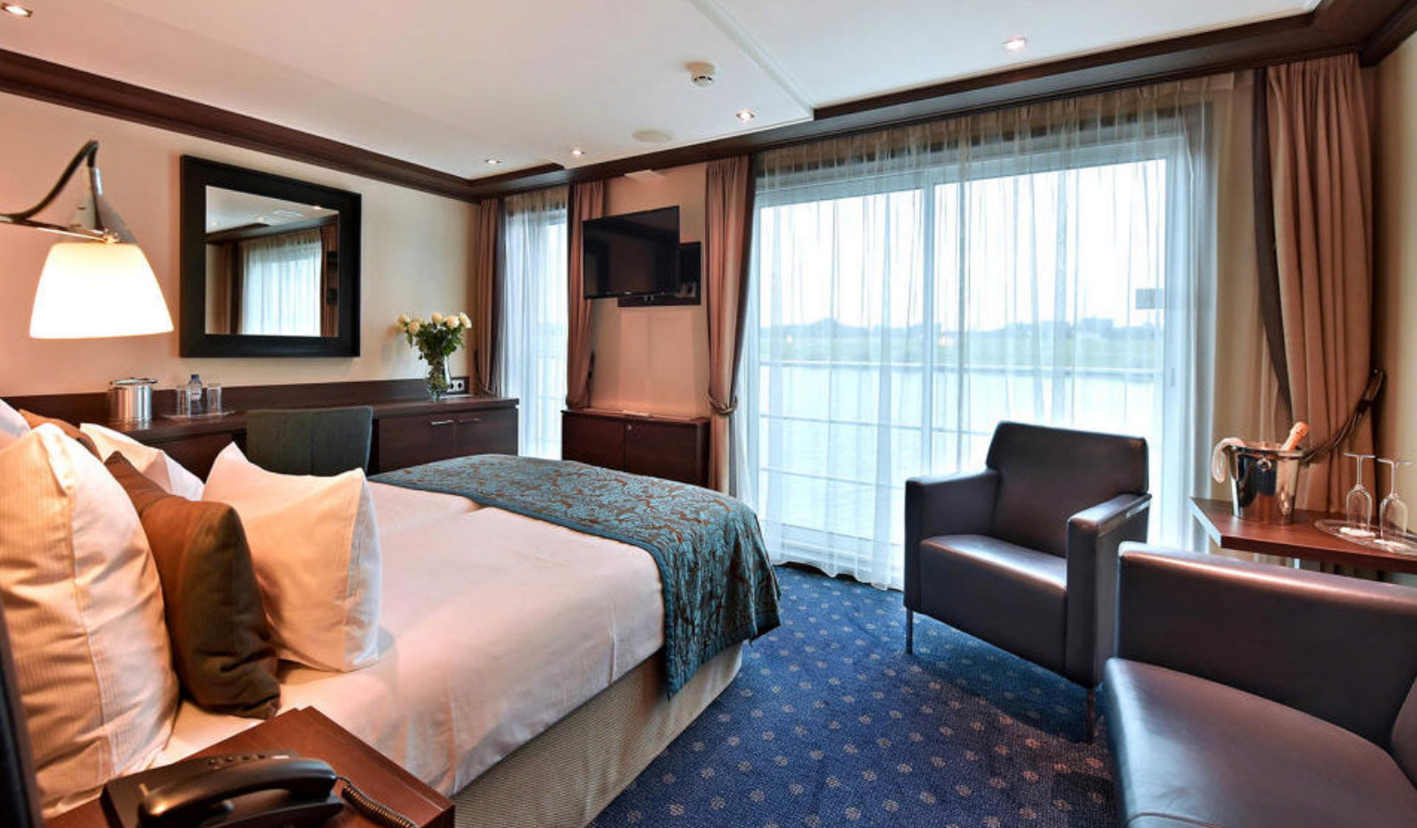
Suite på øverste dekk med fransk altan