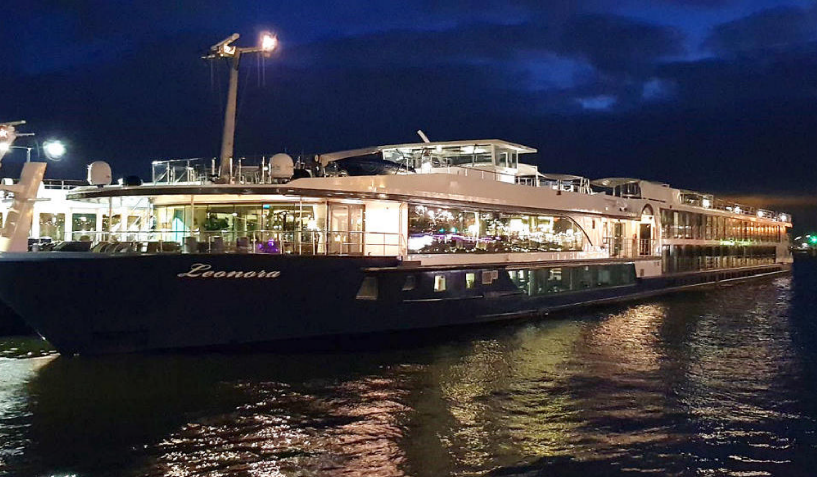
MS Leonora kveld