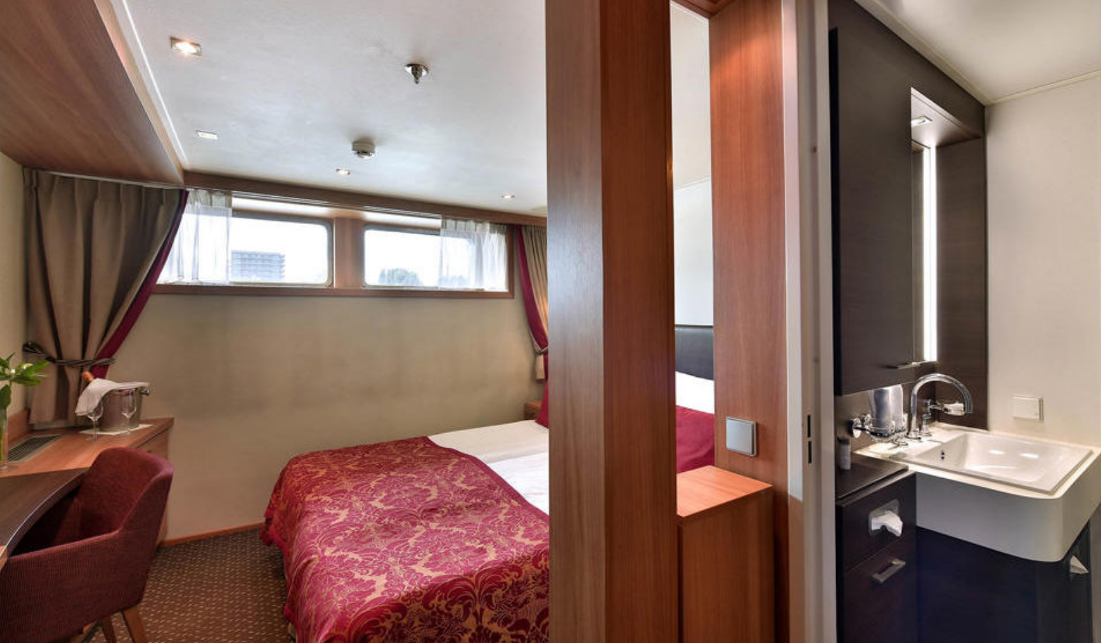
Lugar på hoveddekket