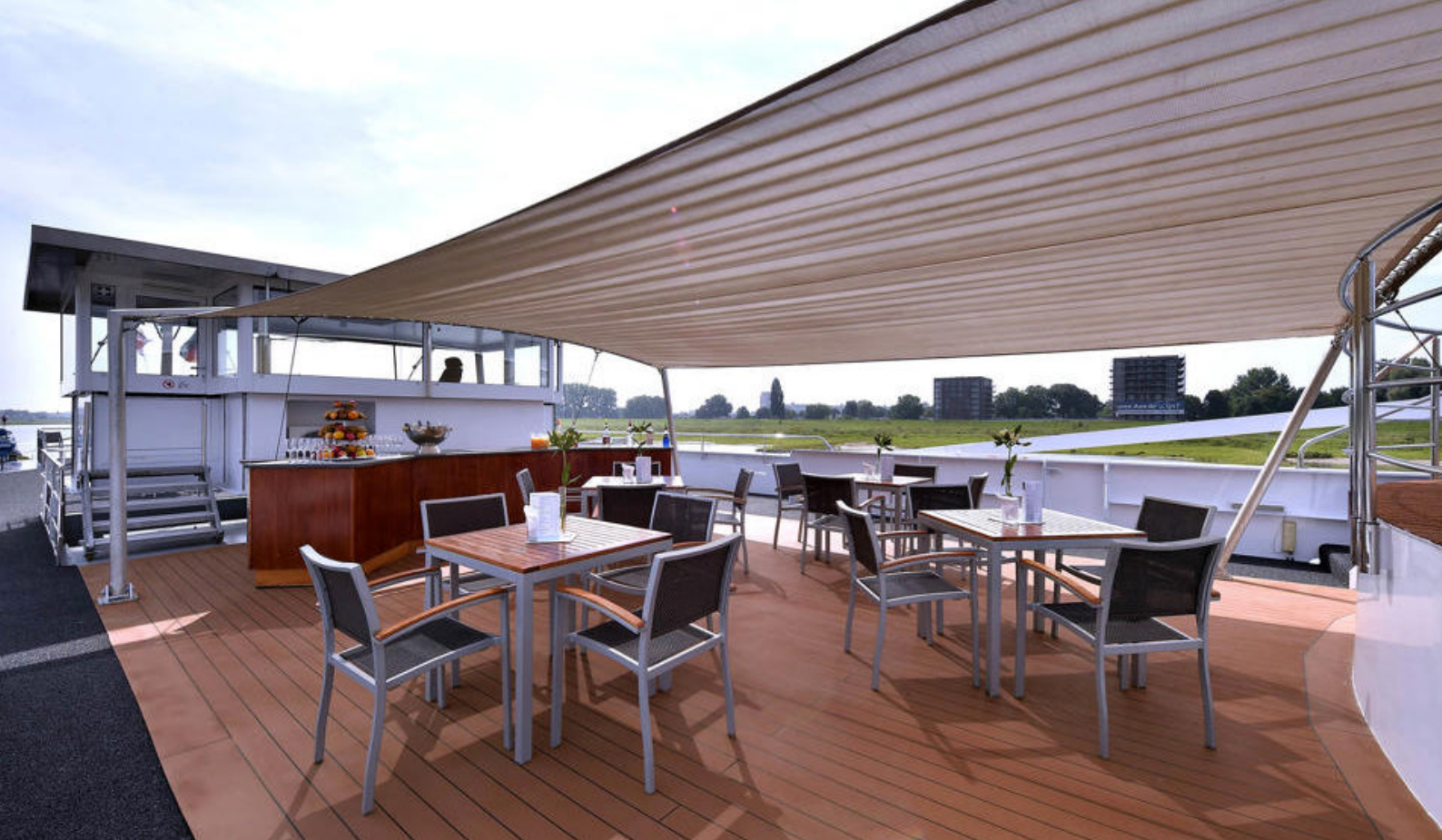
Utendørsområdet på MS Leonora

Man må ikke bruke solkrem eller lignende i jacuzzi'en.