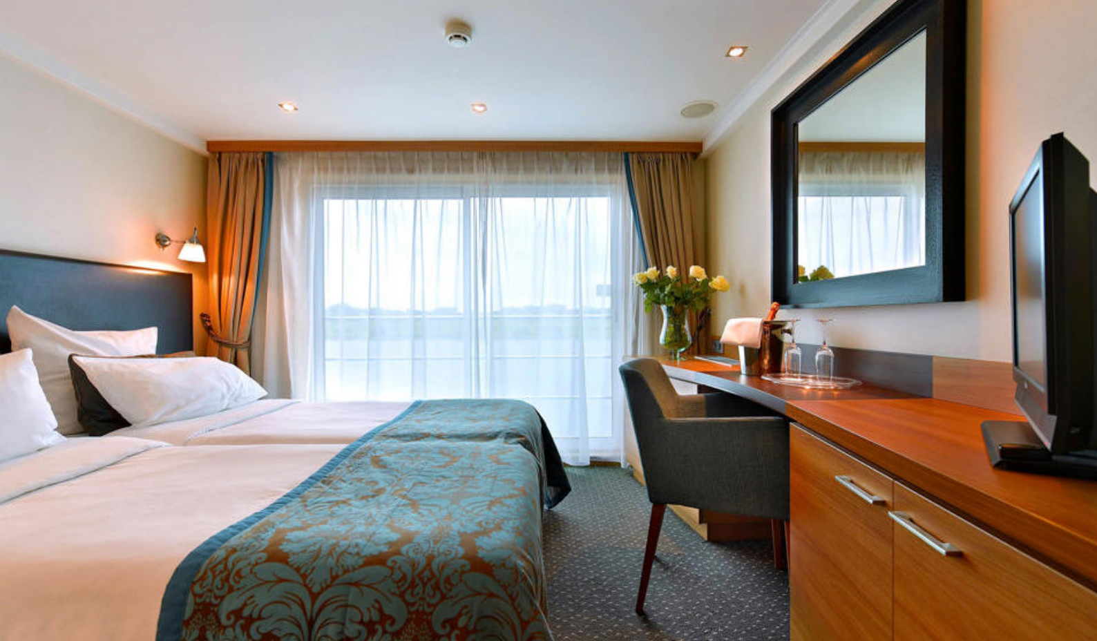
Lugar på overste dekk med fransk altan

bro over Mosel siden 1898, og med sine omkringliggende områder har byen nå drøye 6000 innbyggere.