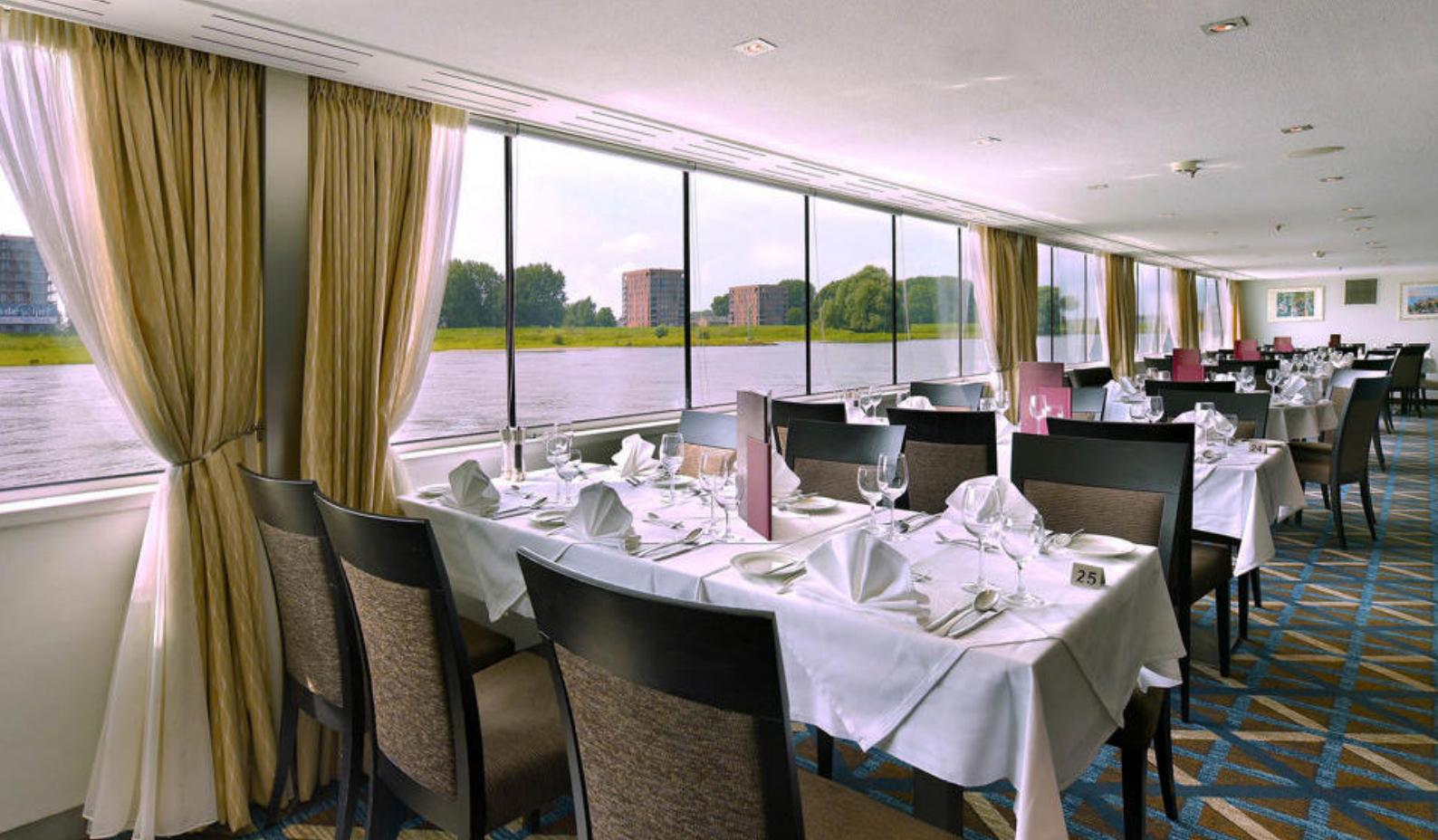
Restauranten på MS Leonora