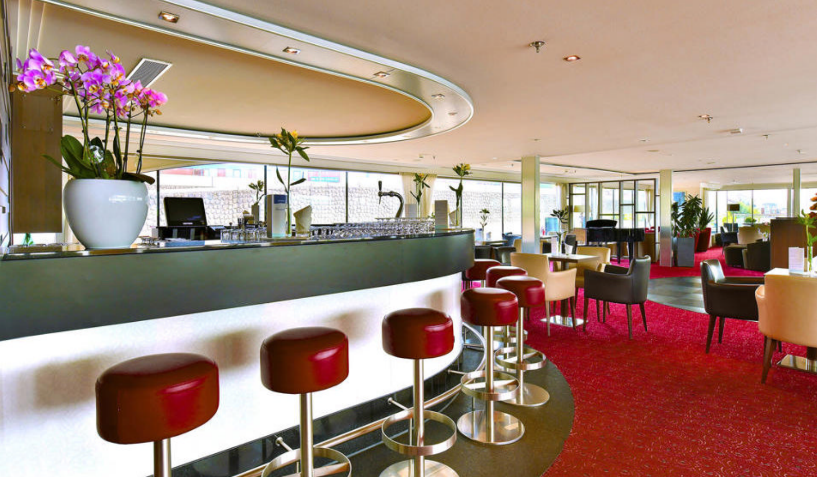
Baren på MS Leonora

sørøstlige hjørnet av Tyskland med avgang i august / september 2023: