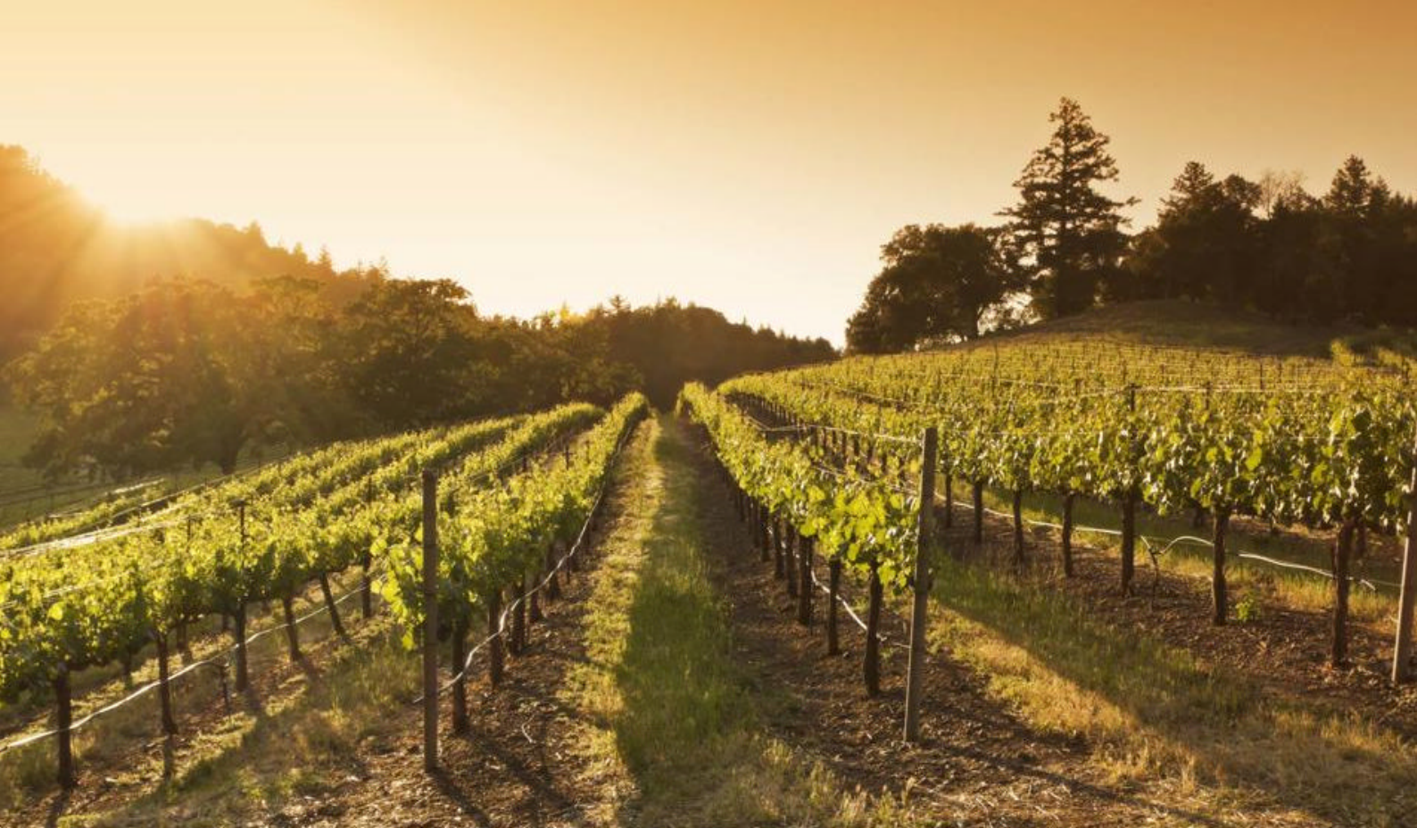
Napa Valley, California - Bilferie på den amerikanske vestkysten

Washington i nord og Oregon i sør. Det amerikanske vinområdet 'Columbia Gorge' strekker seg over begge statene.