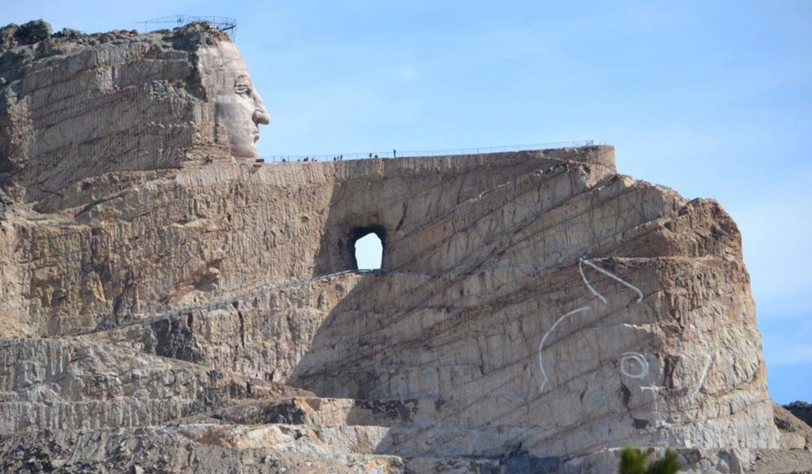
Crazy Horse Memorial, Black Hills

Over 9400 liter varmt vann fra naturlige kilder strømmer gjennom bassengene hver dag, og bidrar til å holde badevannet krystallklart. Bassengene holder temperaturer på mellom 39 og 44 grader. Det er også mulighet for å få massasje og andre typer behandlinger på stedet.