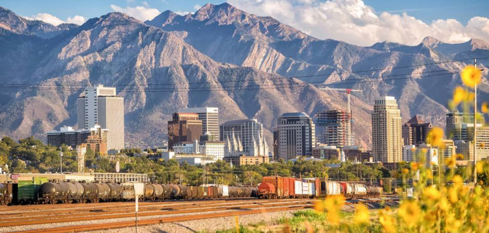
OL-byen Salt Lake City, Utah

Drapper Museum of Natural History og The Harold McCracken Research Library. Buffalo Bill Historical Center er et stort og moderne anlegg, som ligger nærme sentrum.