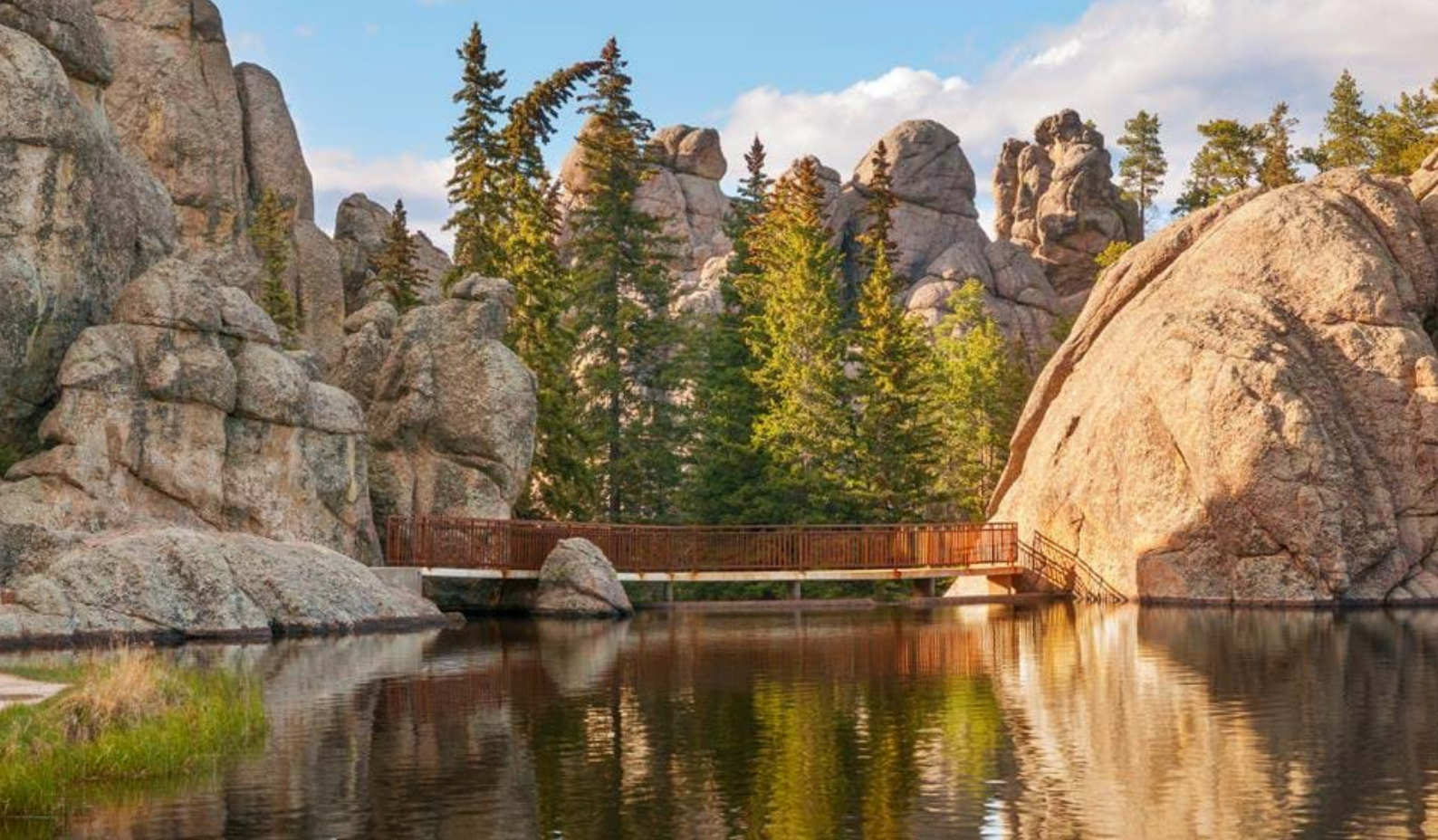
Flotte Sylvan Lake i Custer State Park, Black Hills

Yellowstone National Park. Her viser naturen seg fra sin vakreste side med store fossefall, spektakulære klipper og vakre innsjøer som pryder landskapet.