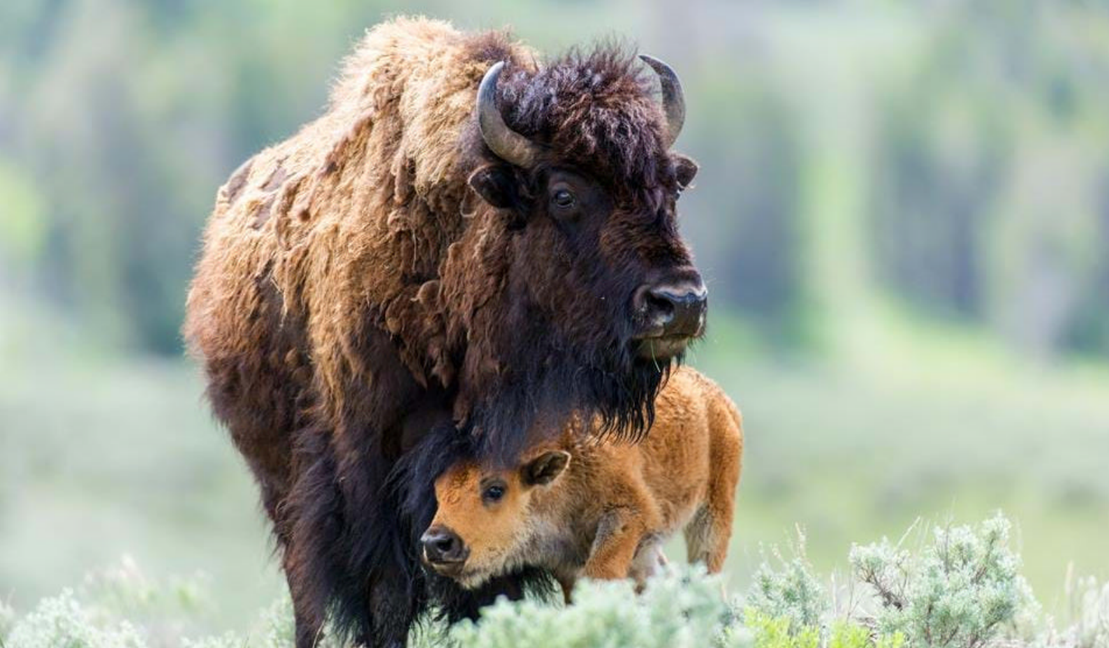
Se buffalo i Yellowstone nasjonalpark