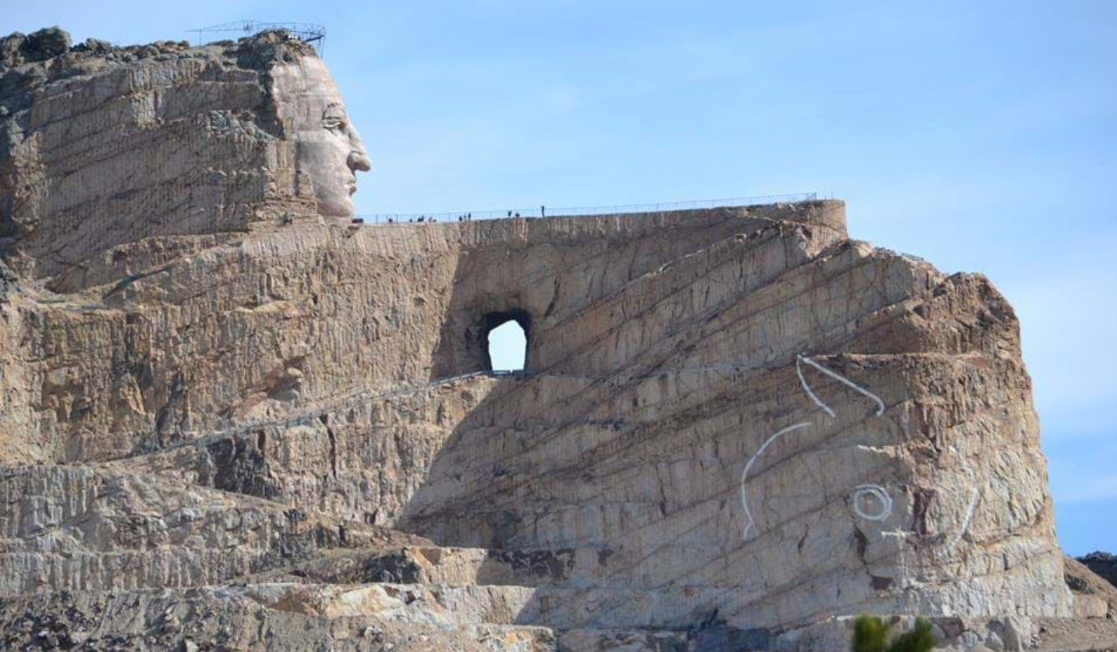
Crazy Horse Memorial, Black Hills

strømmer gjennom bassengene hver dag, og bidrar til å holde badevannet krystallklart. Bassengene holder temperaturer på mellom 39 og 44 grader. Det er også mulighet for å få massasje og andre typer behandlinger på stedet.