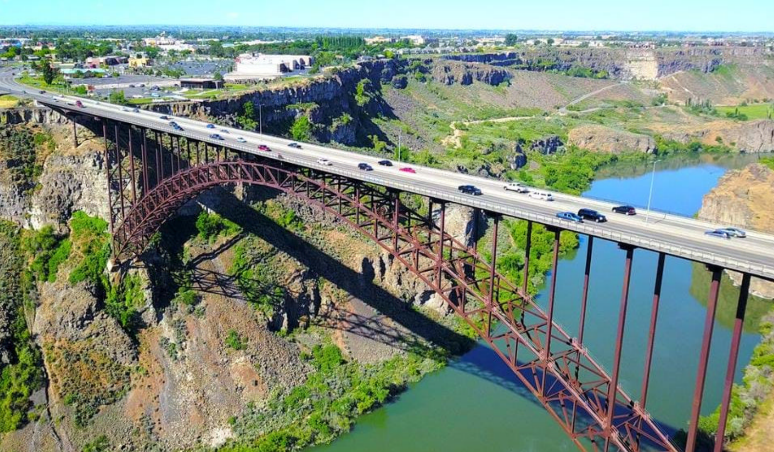
Perrine Bridge, Twin Falls

majestetiske Grand Teton National Park. Her er det over 320 km med turstier. Parken huser omtrent tusen forskjellige landplanter, og det lever mange forskjellige dyrearter her, ikke ulikt livet i våre norske skoger. Amerikansk svartbjørn, elg, ulv, mår og ekorn er noen av dyreartene som finnes i Grand Teton National Park.