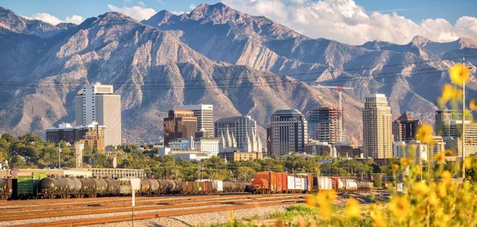
OL-byen Salt Lake City, Utah

Drapper Museum of Natural History og The Harold McCracken Research Library. Buffalo Bill Historical Center er et stort og moderne anlegg, som ligger nærme sentrum.