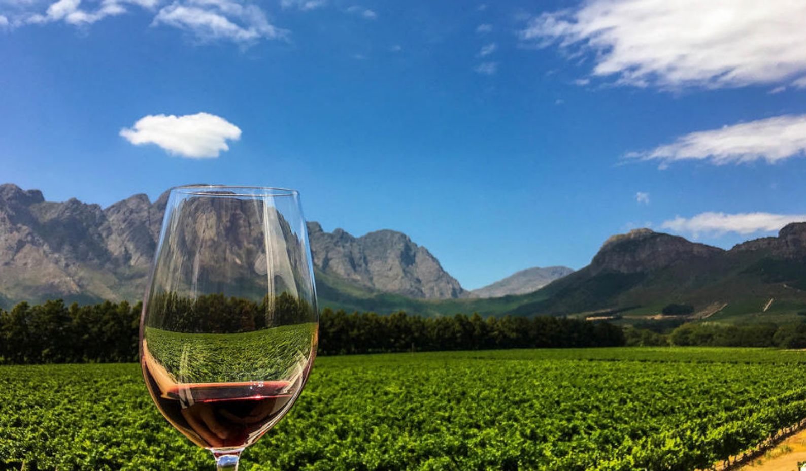
Utflykt til vinlandet med vinsmaking

gatene og den eksotiske, malaysiske kulturen. Et absolutt must å se.