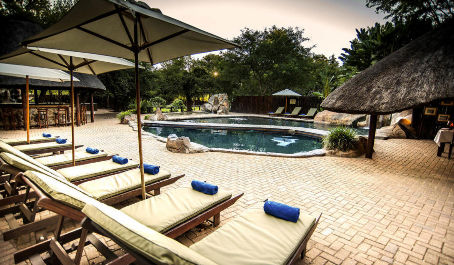
Shiduli Private Game Lodge