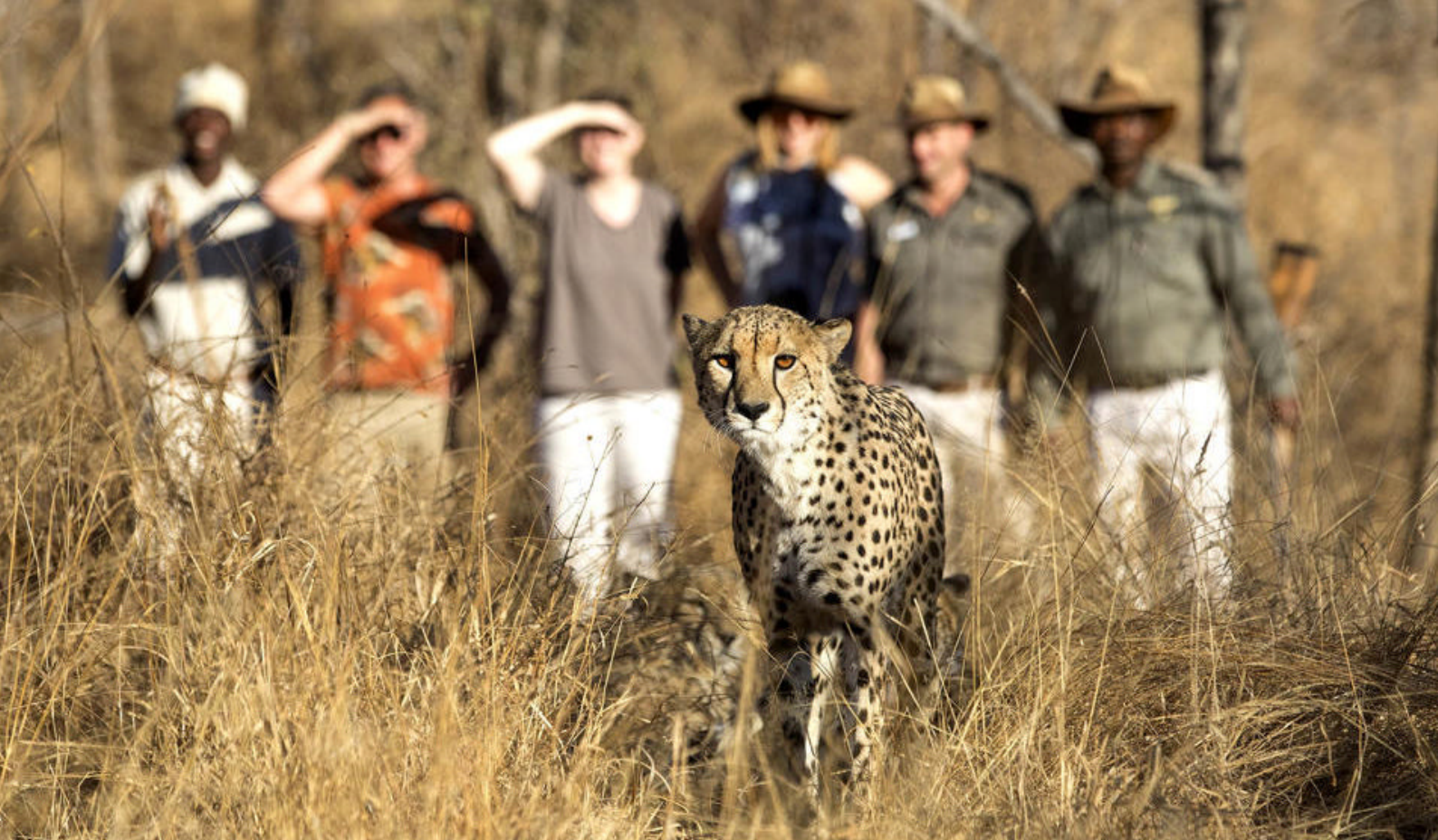
Game Drive i Karongwe Game Reserve

Har dere litt trøtte ben og kanskje er litt øm av solens stråler, kan vi anbefale en tur i lodgens Thera Naka Spa, som har et bredt program av lekke massasjer, scrubs, wraps m.m.