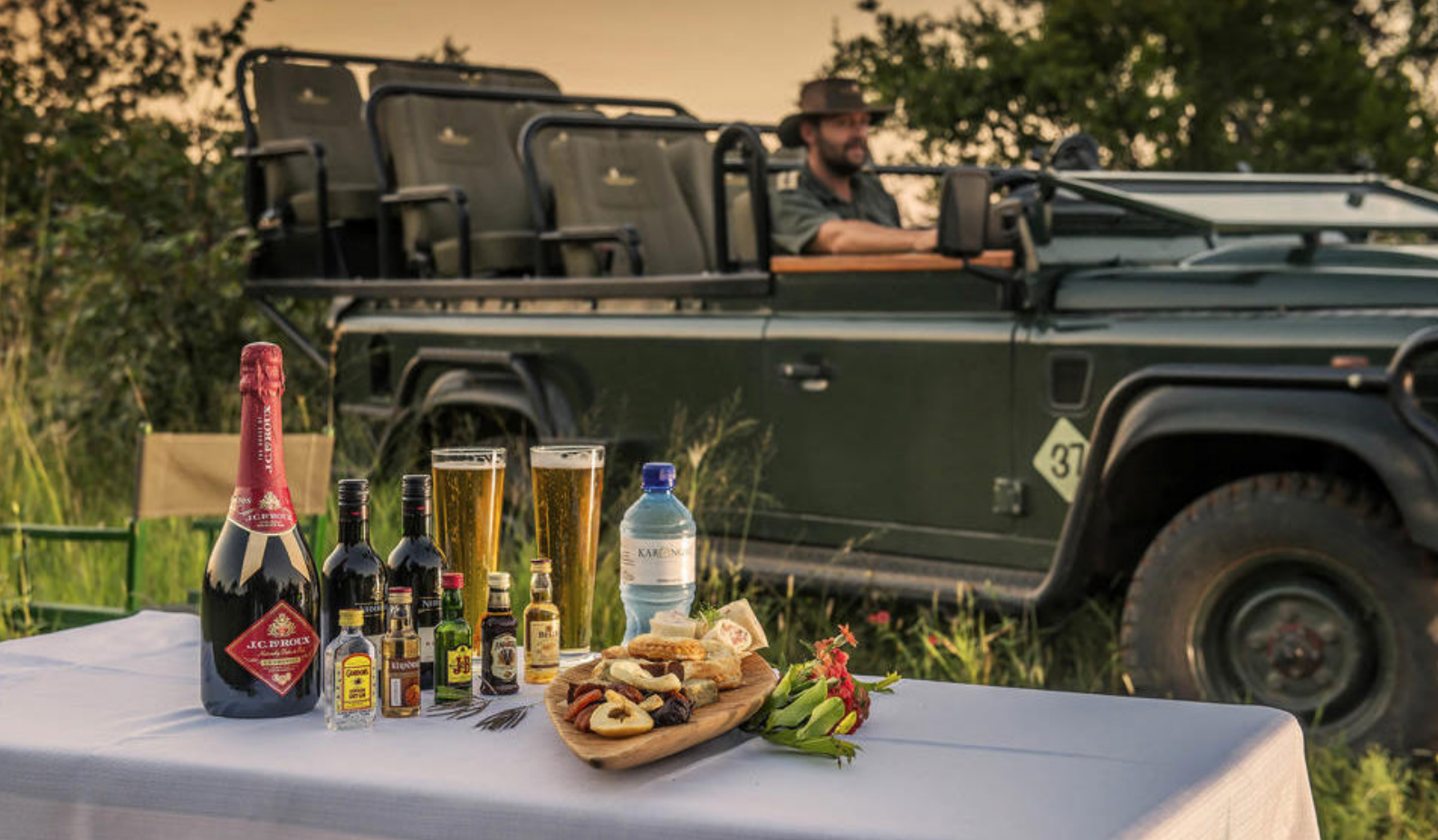
Game Drive i Karongwe Game Reserve inkl. obligatorisk Sundowner

Etter lunsj er det snart tid til deres første Game Drive i det 9.000 hektar store private Karongwe safariområde, hvor det naturligvis kan ses de berømte Big Five, og hvis dere er heldige The Big Seven (som er Big Five + gepard og ville hunder). Alt etter tid på året starter dette Game Drive enten kl. 15.30 eller kl. 16.00.