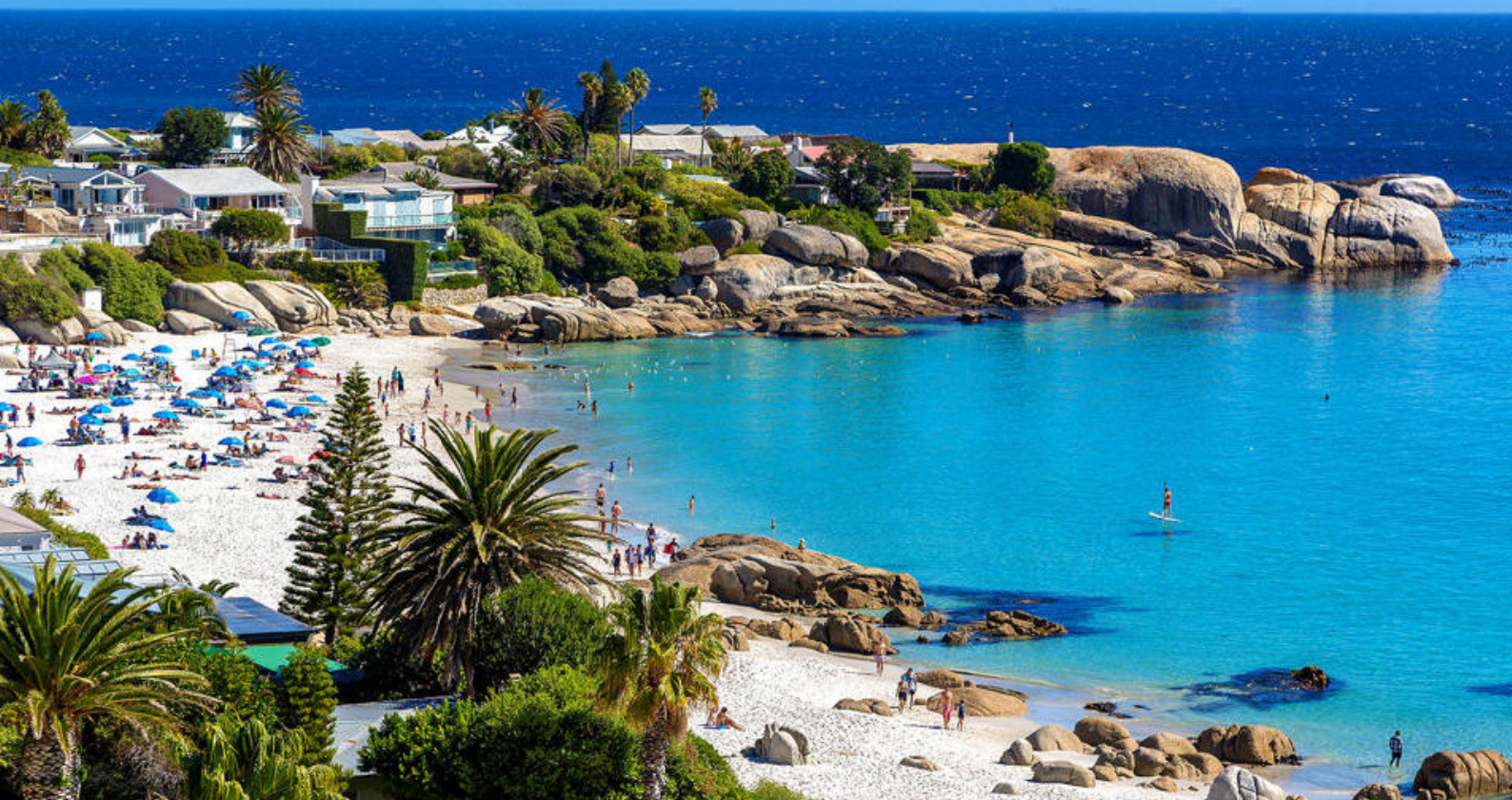
Clifton Beach i Cape Town

Her kan dere nemlig svømme med pingviner. Her finner dere en større koloni på hele 3000 dyr. Simon's Town er hovedsetet for den sør-afrikanske flåte og har generelt en sjarmerende atmosfære og en fargerik historie. Her finner dere to museer: The Warrior Toy Museum og The South African Navy Museum. På avstand kan dere se fregatter og undervannsbåter som tilhører den sør-afrikanske flåten.