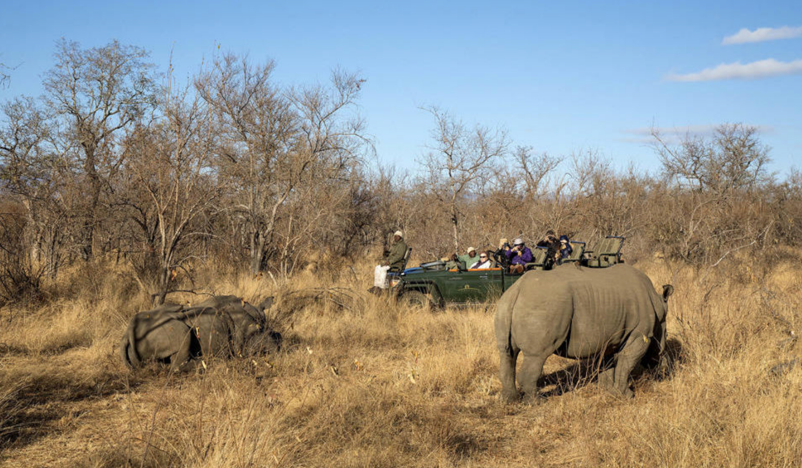
Det er neshorn i Karongwe Game Reserve, både hvite og sorte