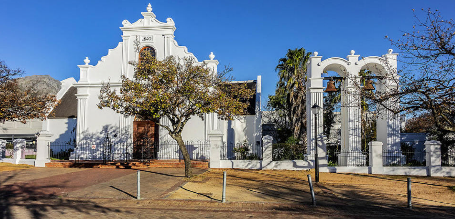
Rhenisch Mission Church, Stellenbosch