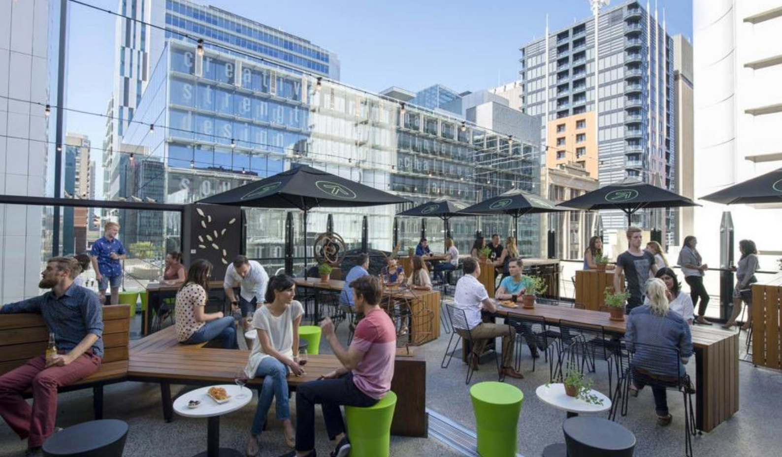
Urban stemning i Adelaide