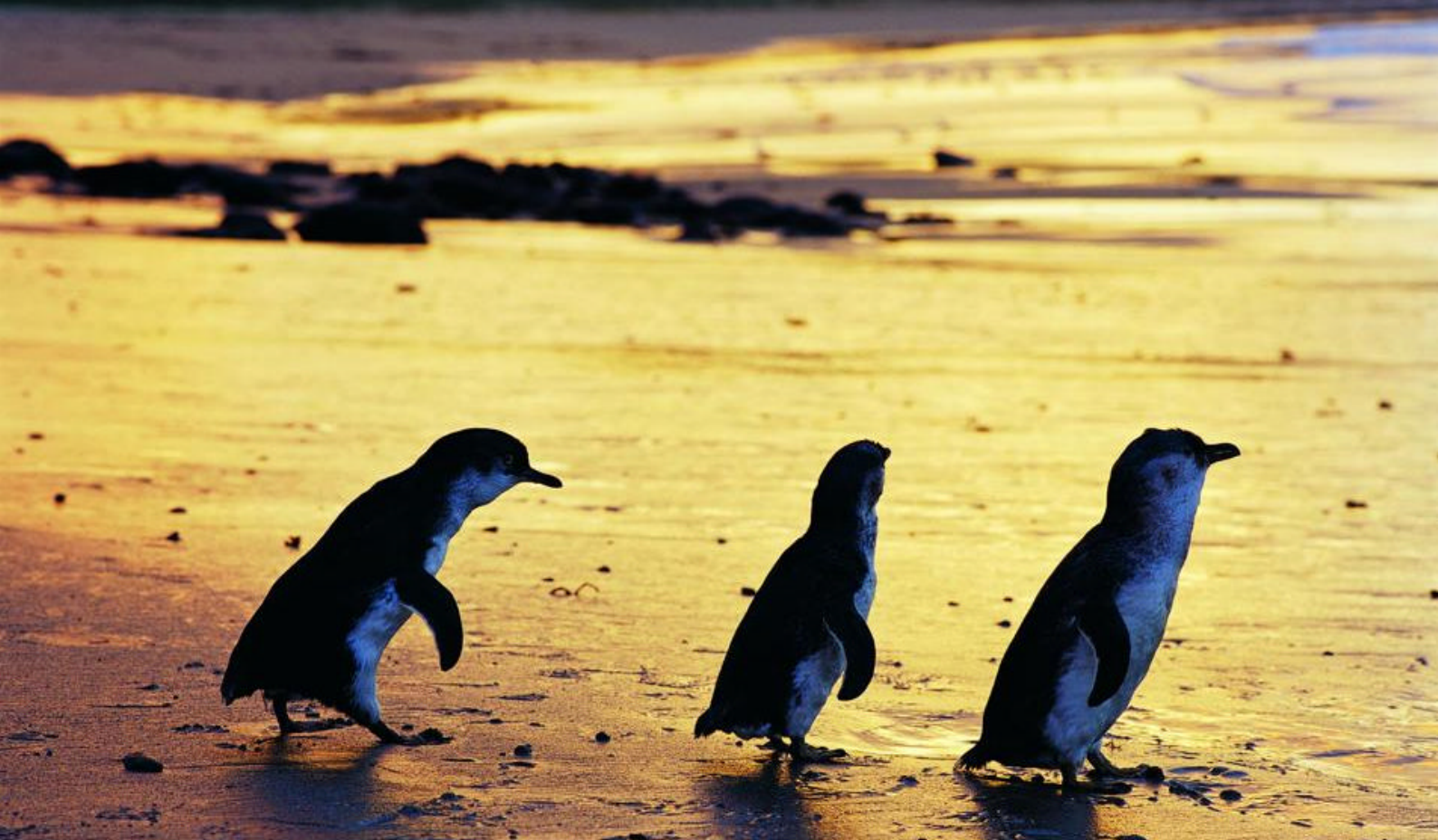
Blå pingviner, Phillip Island

utforske regionens beste vingårder. Dere kan blant annet besøke produsenter som Penfolds Barossa, Saltram Wine Estate, Wolf Blass og Jacob's Creek. Det anbefales også å ta turen innom Barossa Farmers Markets og Maggie Beer's Farm Shop. The Barossa er kjent for dets Shiraz og Eden Valley Riesling, så vel som andre premium viner, regionale produksjon og gode restauranter.