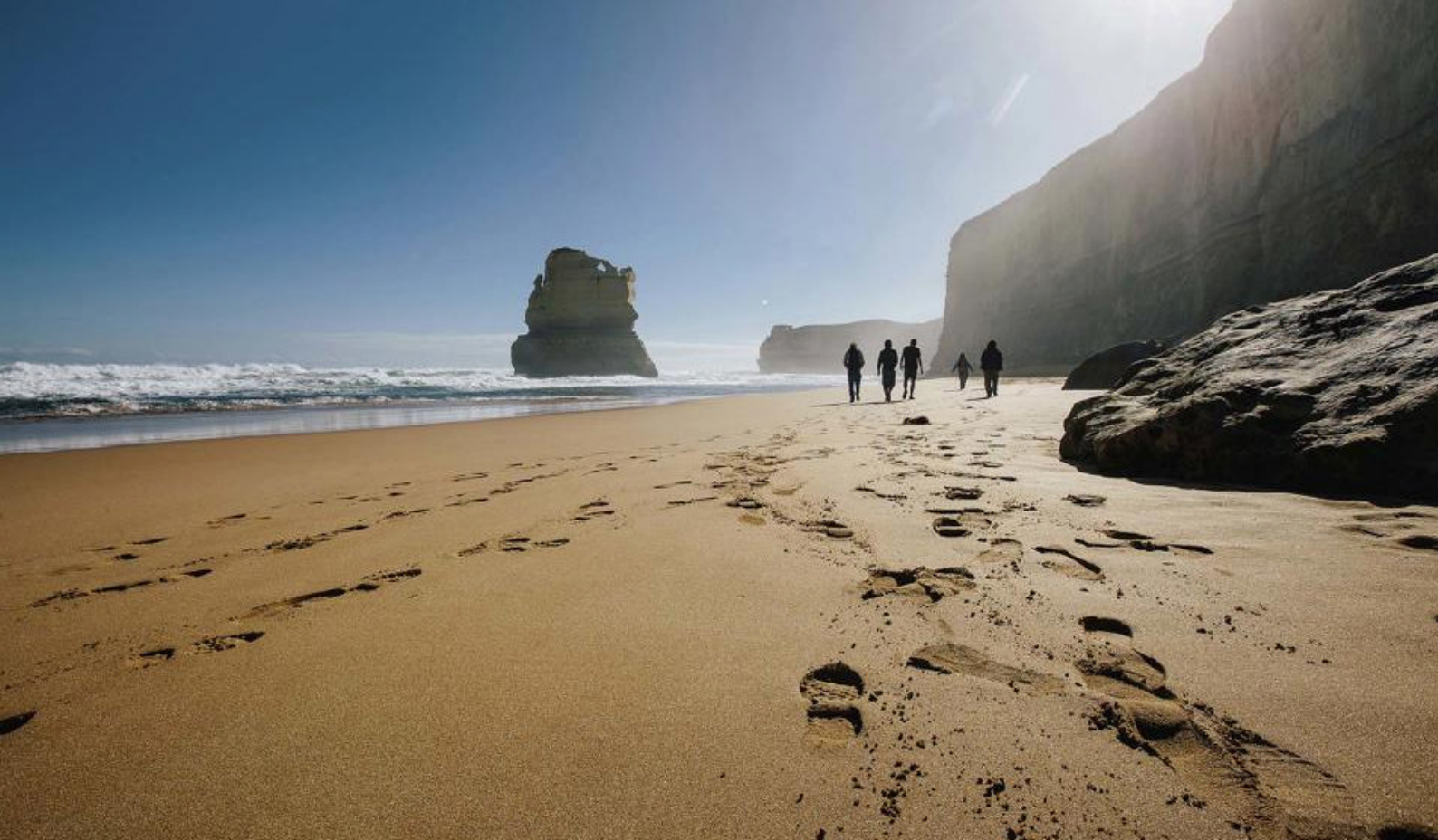
Great Ocean Road og de 12 apostlene