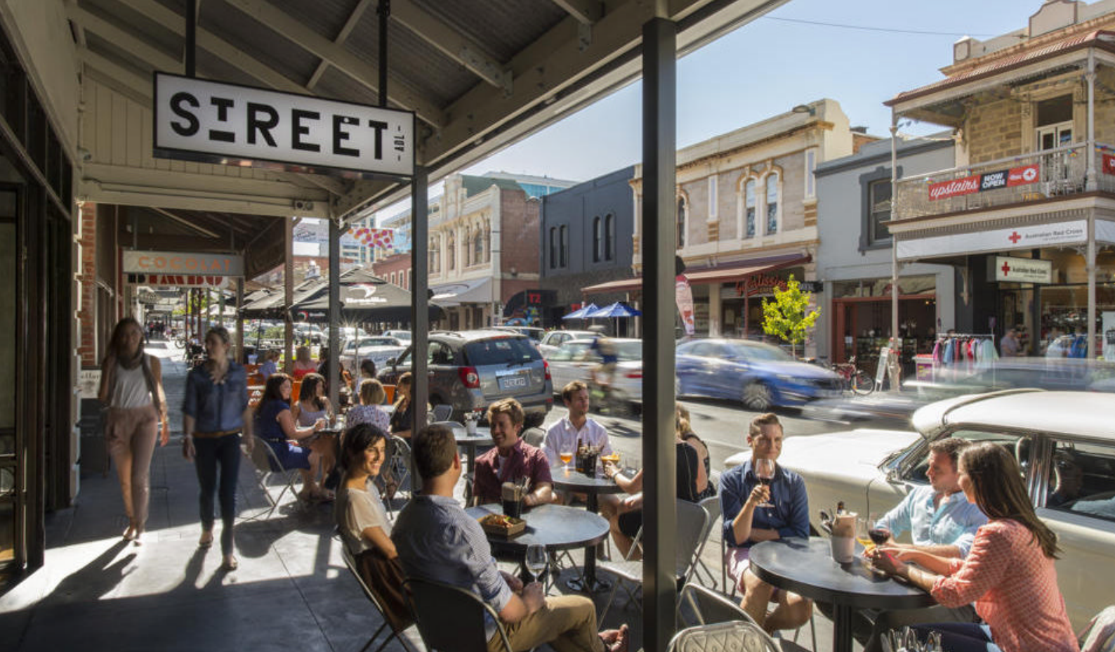
Det er mange gode spisesteder i Adelaide

storbyens travle liv, og i gjengjeld få en riktig avslappet feriestemning. På Manly Beach finner dere et herlig maritimt miljø, med surfere, havnepromenader m.m. Den flotte stranden Shelley Beach lokker med herlige badevann. The Corso er en travel gågate med hyggelige puber, restauranter m.m. Fra vandrestiene ved North Head er det en fantastisk utsikt til Sydney Harbour og skyline. Fergene går fra Circular Quay.