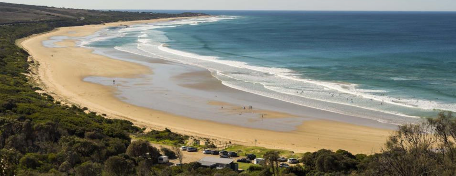
Anglesea Beach, Great Ocean Road

til mountainbiking, fjellklatring og rappellering i Australia.