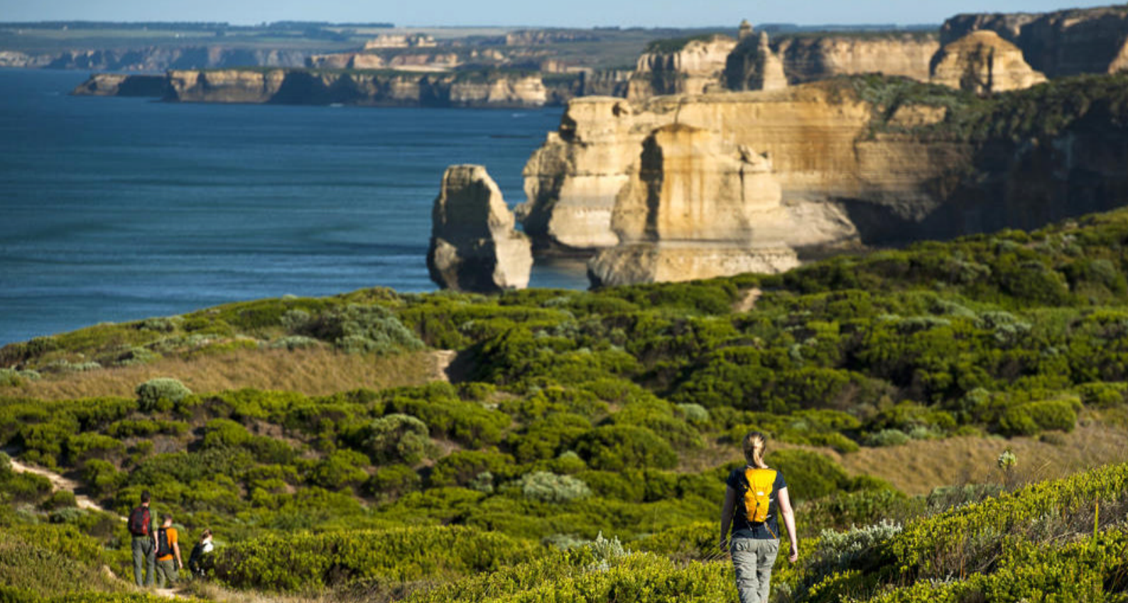
Great Ocean Road