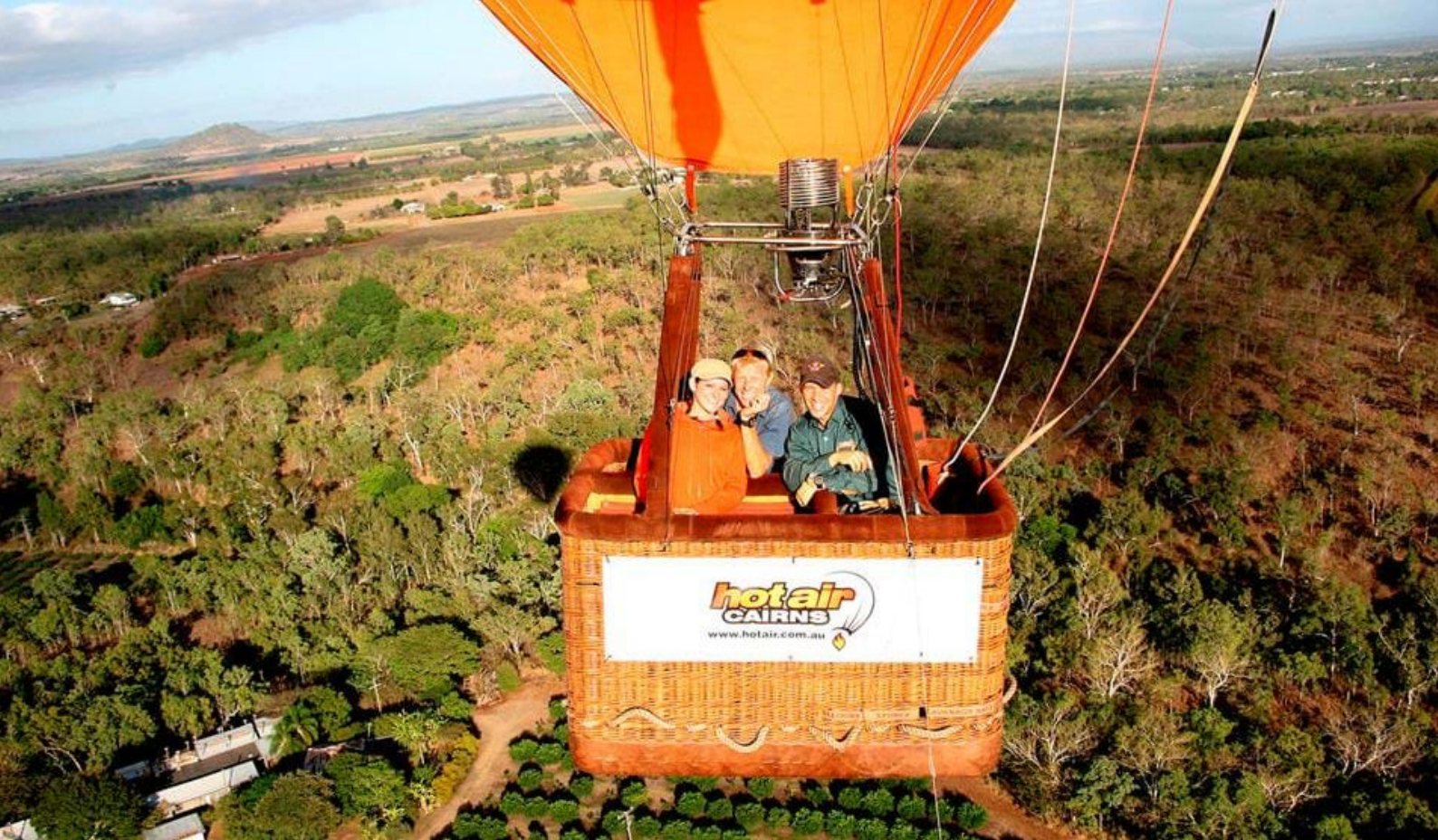
Varmluftsbilongtur i Cairns