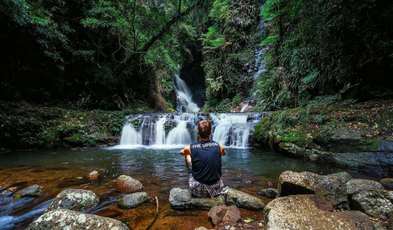
Elabena Falls i Lamington National Park

velkomne og sørget for at de fikk oppleve denne vidunderlige parken på best mulig måte. Dette familieeide hotellet er blitt et ikon og er nesten en destinasjon i seg selv, så her er det bare å finne seg god til rette. Fra hotellrommet deres vil dere ha en flott utsikt til den vestlige delen av McPherson fjellkjeden og det rike fuglelivet som er rundt hotellet.