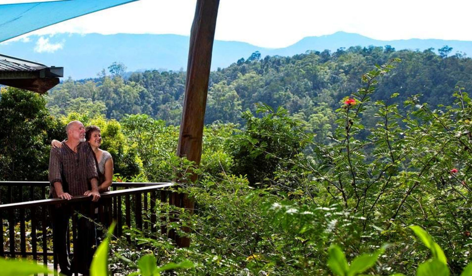
Fantastisk overnatting i Atherton Tablelands på Rose Gum Wilderness Retreat

som er en klan i Yidinji nation, som strekker seg fra Mulgrave River til høylandet rundt om Rose Gum Wilderness Retreat. Området her er med andre ord sterkt preget av Aboriginsk kultur, og det vil være flere muligheter for å komme nært denne særegne kulturen.