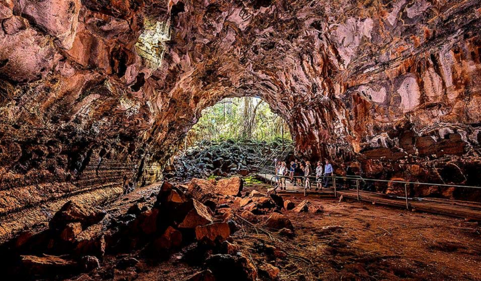
Undara Lava Tubes

dagens organiserte utflukt til de berømte Whitsundays Islands. Dere hentes tidlig om morgenen for transfer til Port of Airle, hvor utflukten starter kl. 06.45 når dere stiger ombord på båten. Gled dere til å seile rundt i det vakre øyhavet som utgjør Whitsundays Islands og består av 74 fantastiske øyer som stort sett er ubebodde.