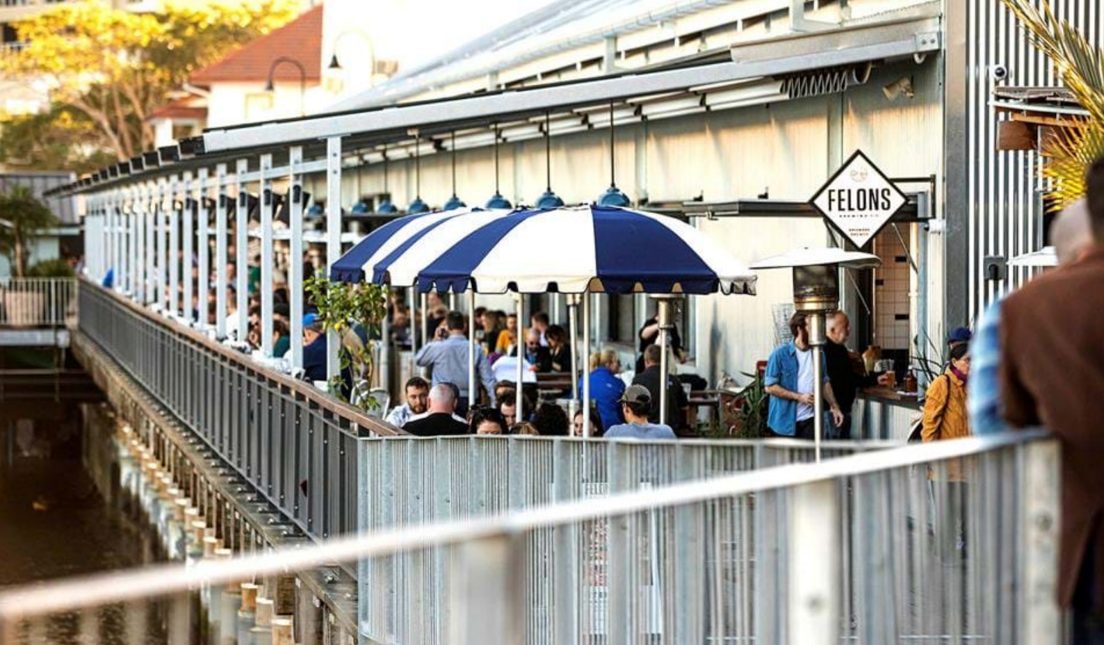
Livlige Brisbane

virkelig et unikt sted, skapt over millioner av år. Det er her at en av Australias siste større lavlandsregnskoger finnes.