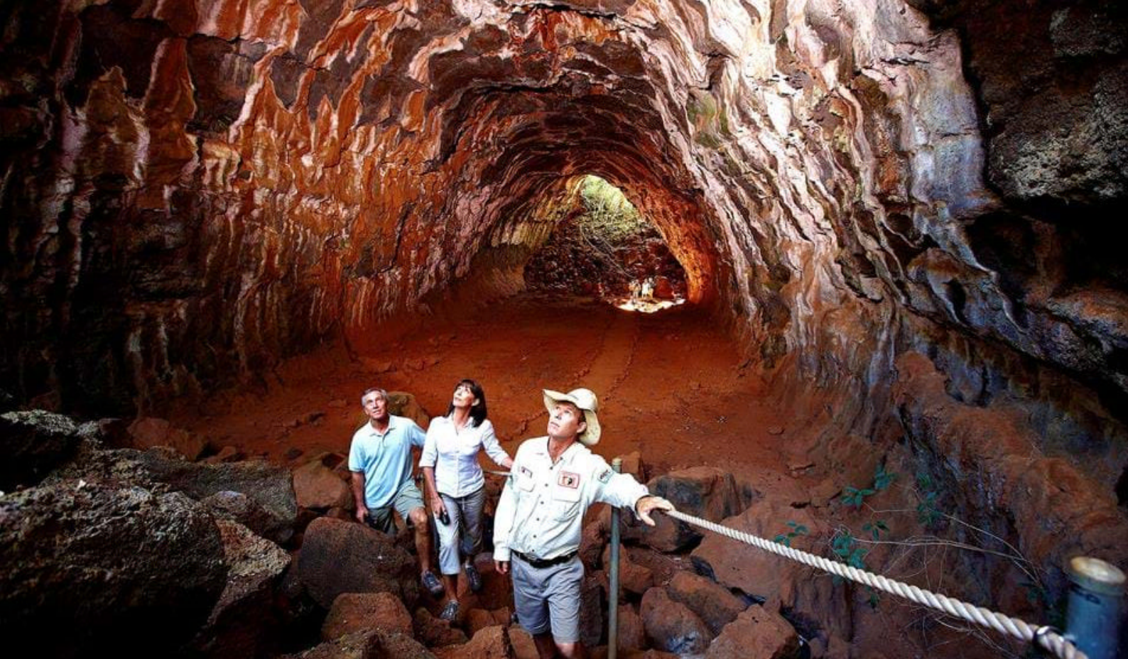
Undara Lava Tubes