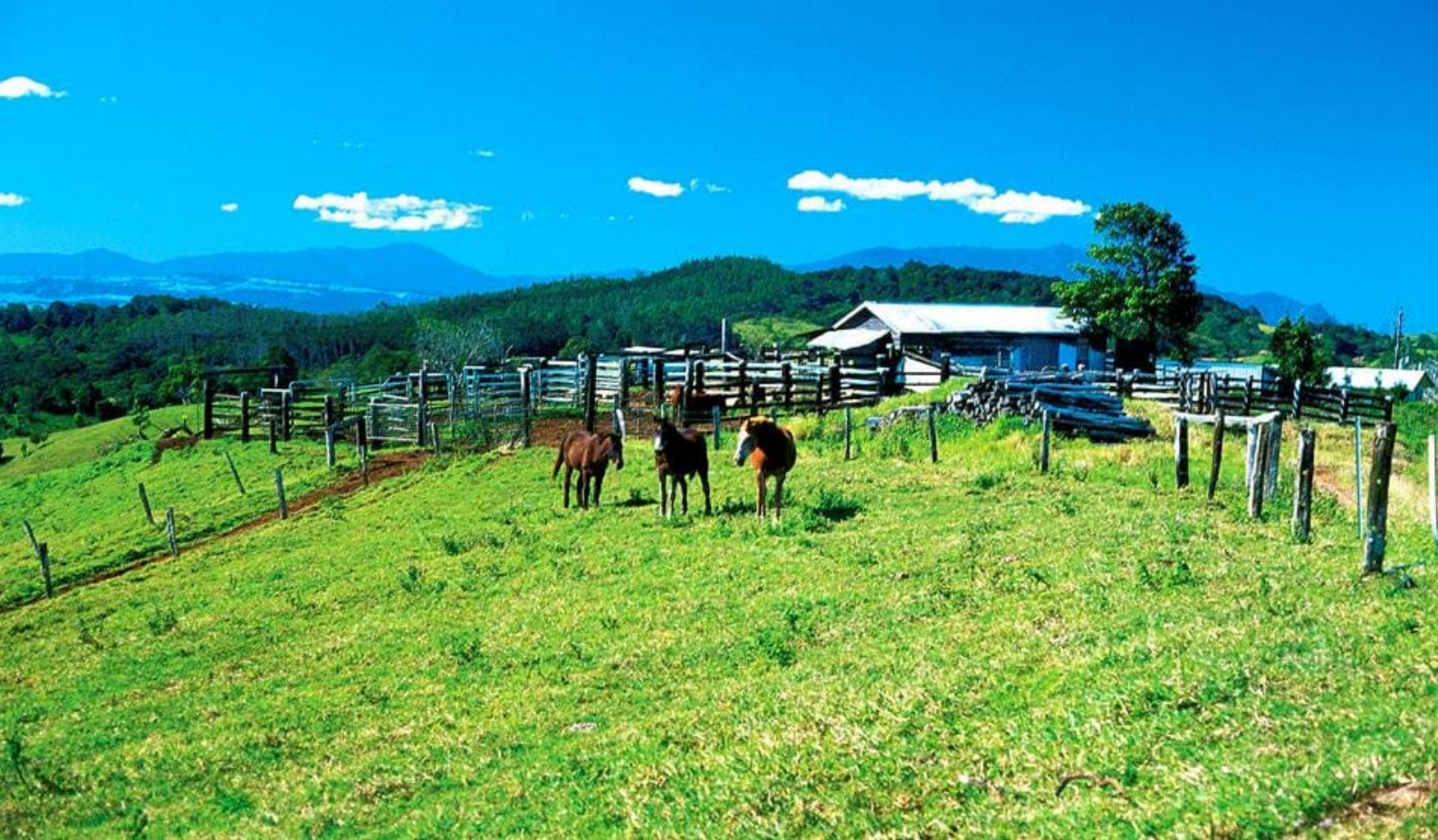
Frodig landbruksområde i Atherton Tablelands