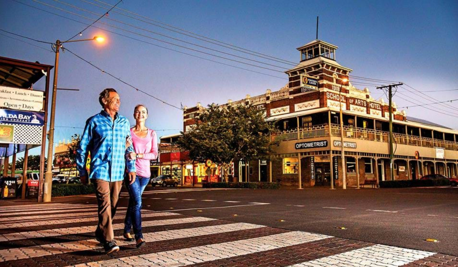
'Old World Charm' i Roma