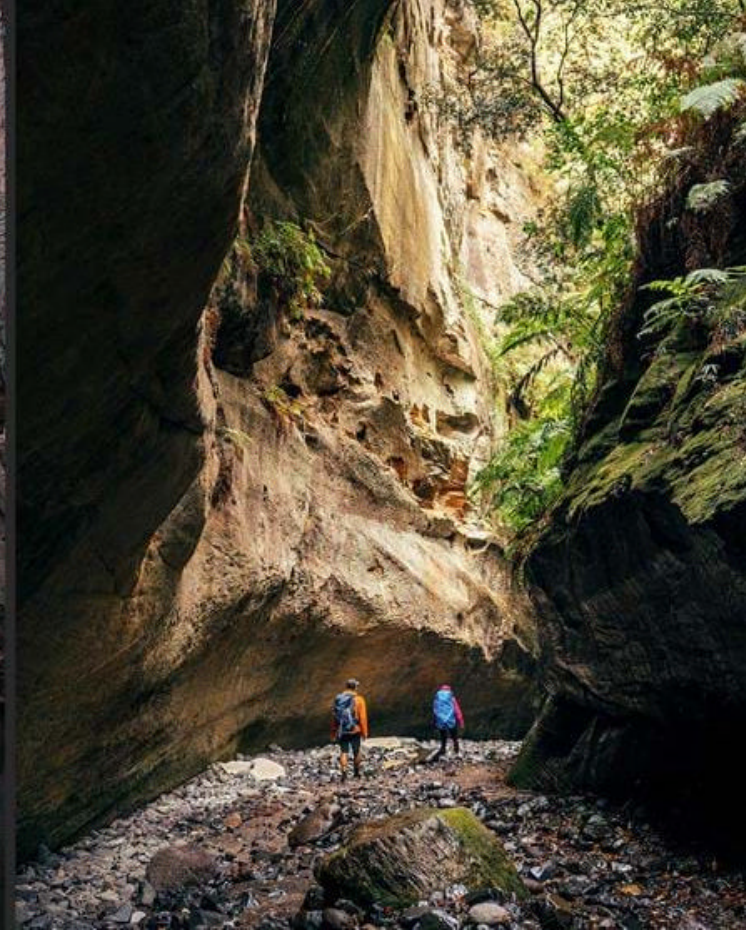
Carnarvon Gorge

selsyn av dette mektige skue ved enten å sitte på gjerdet eller fra den mer komfortable utkikkspattform. Det er auksjon hver tirsdag og torsdag og det selges opp til 12.000 kveg hver dag. Dette er en helt spesiell opplevelse.