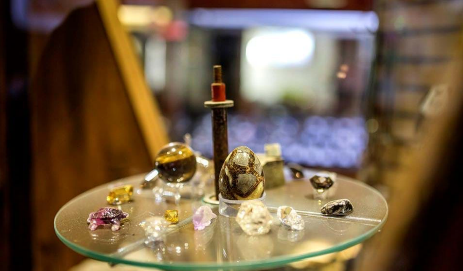
Safirer i Emerald - gjør et godt kjøp!