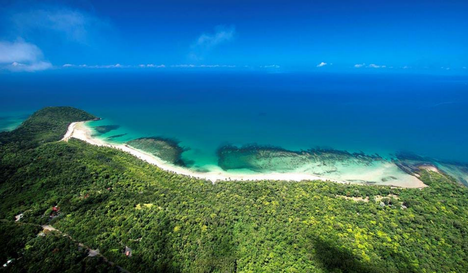
Dere skal på heldagsutflukt i Daintree Rainforest og Cape Tribulation fra Cairns

begynner en naturskjønn vandretur gjennom det imponerende økosystemet. Guiden vil løpende fortelle om den urgamle floraen og det endemiske dyrelivet man finner her. The Wet Tropics, som dette området også er kjent som, er beriket med et av de største biodiversiteter på jorden og er hjemsted for en usammenlignbar naturskjønnhet, spektakulære fjell, dype kløfter og brusende elver.