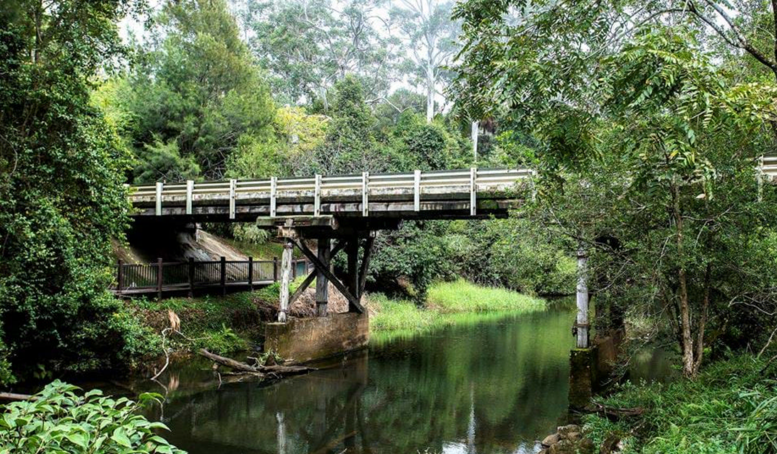
Broken River i Eungella National Park