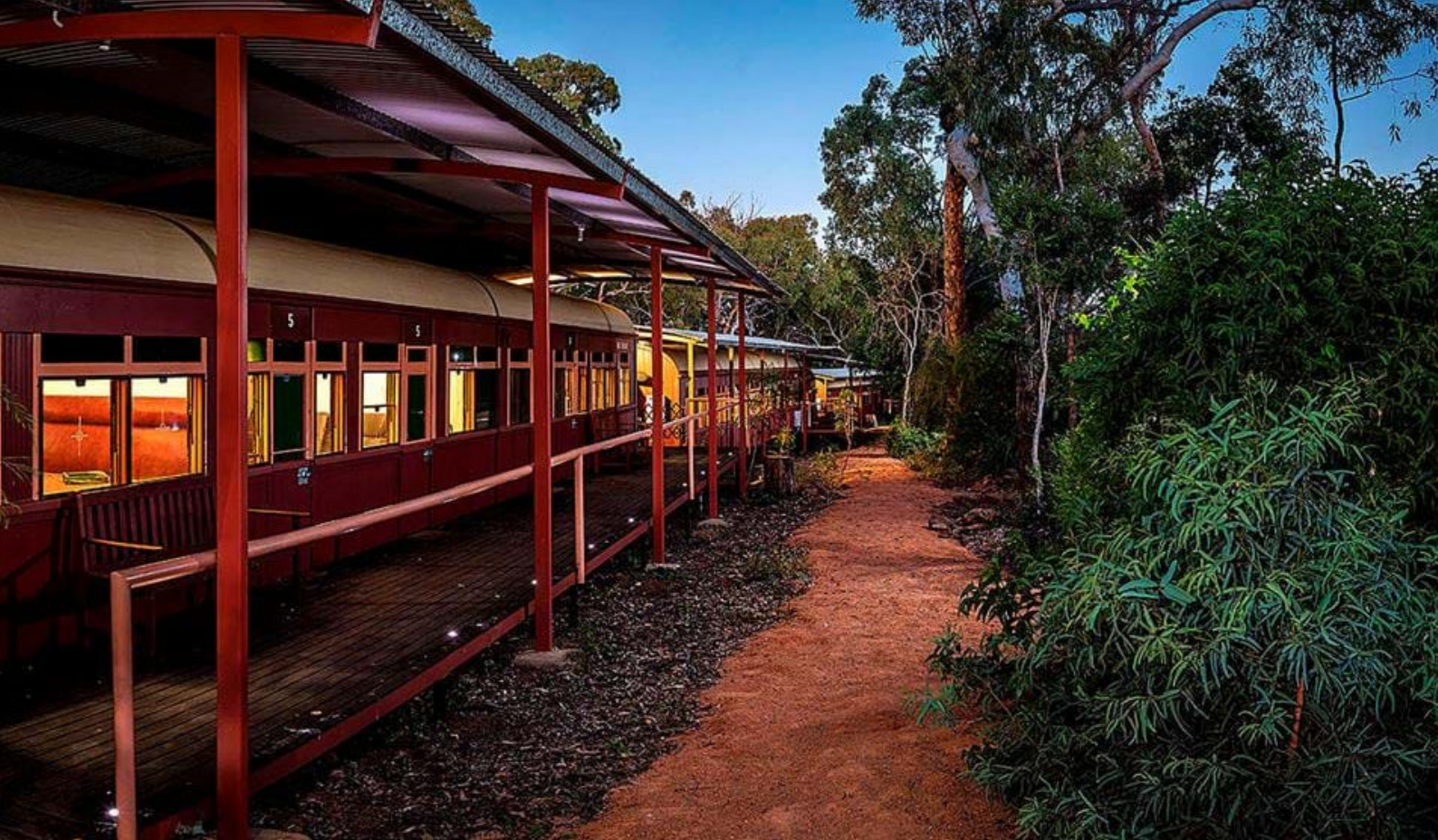
Unik overnatting i Undara Experience

enkelte områder er tunnelene kollapse og skapt ideelle betingelser for regnskogen og fungerer som en fantastisk beskyttelse for dyrelivet. Her finner dere wallabies, insektspisende flaggermuskolonier og ugler. Fugler søker også ly i de fruktfylte trekornene og rovdyr ligger på lur.