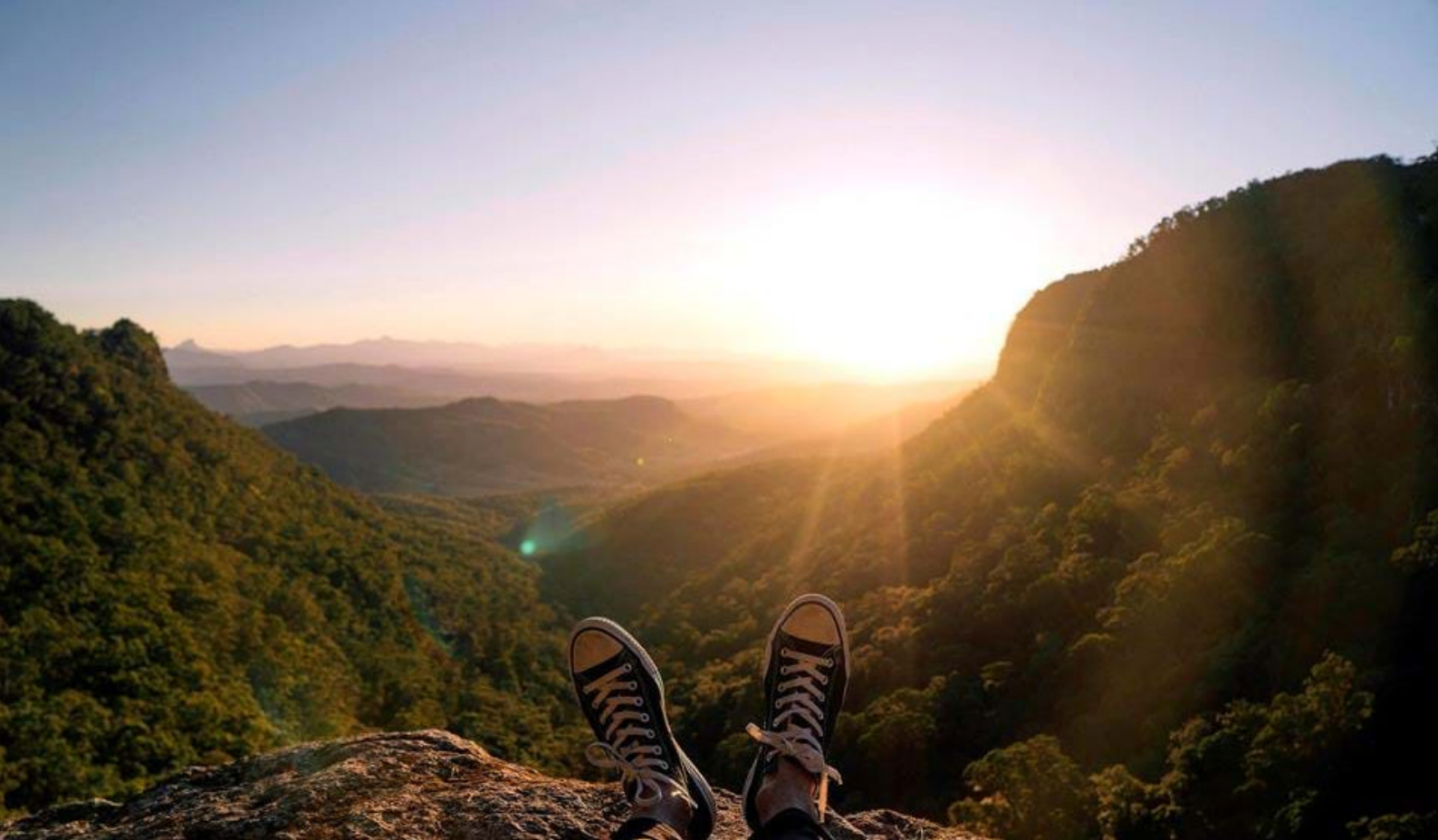
Utsikt over Lamington National Park