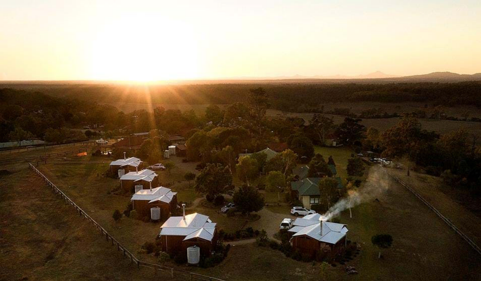
Spicer's Hidden Vale i Grandchester

Det anbefales at denne turen gås med klokka. Nyt de kjølige sprutene fra de mange fossene på veien, og se f.eks. Chalahn og Toolona fossene mens dere går opp gjennom Toolona Gorege mot utsiktspunktet Wanungara. Den smale Toolona kløfta har skapt et beskyttet, fuktig og skyggefullt refugium for de mange urgamle regnskogsplantene som f.eks. den gigantiske kongebregne.