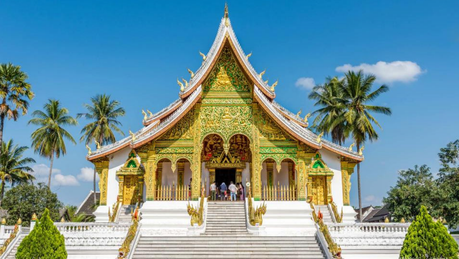
Royal Palace i Luang Prabang