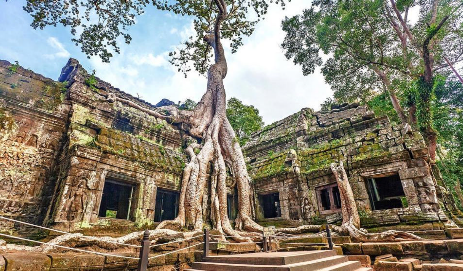
Wat Ta Prohm i Angkor Wat, Kambodsja

uberørte strender i fantastiske naturomgivelser blant de mer enn 400 øyene i området. Her kan du padle kajakk, svømme og bade i det smaragdgrønne, klare vannet. Tilbake på båten venter en liten smak av den lokale likøren kjent som 'Ba Kich Liquor'. Fra båten venter nå en solnedgang av det flammende slaget som området også er kjent for.