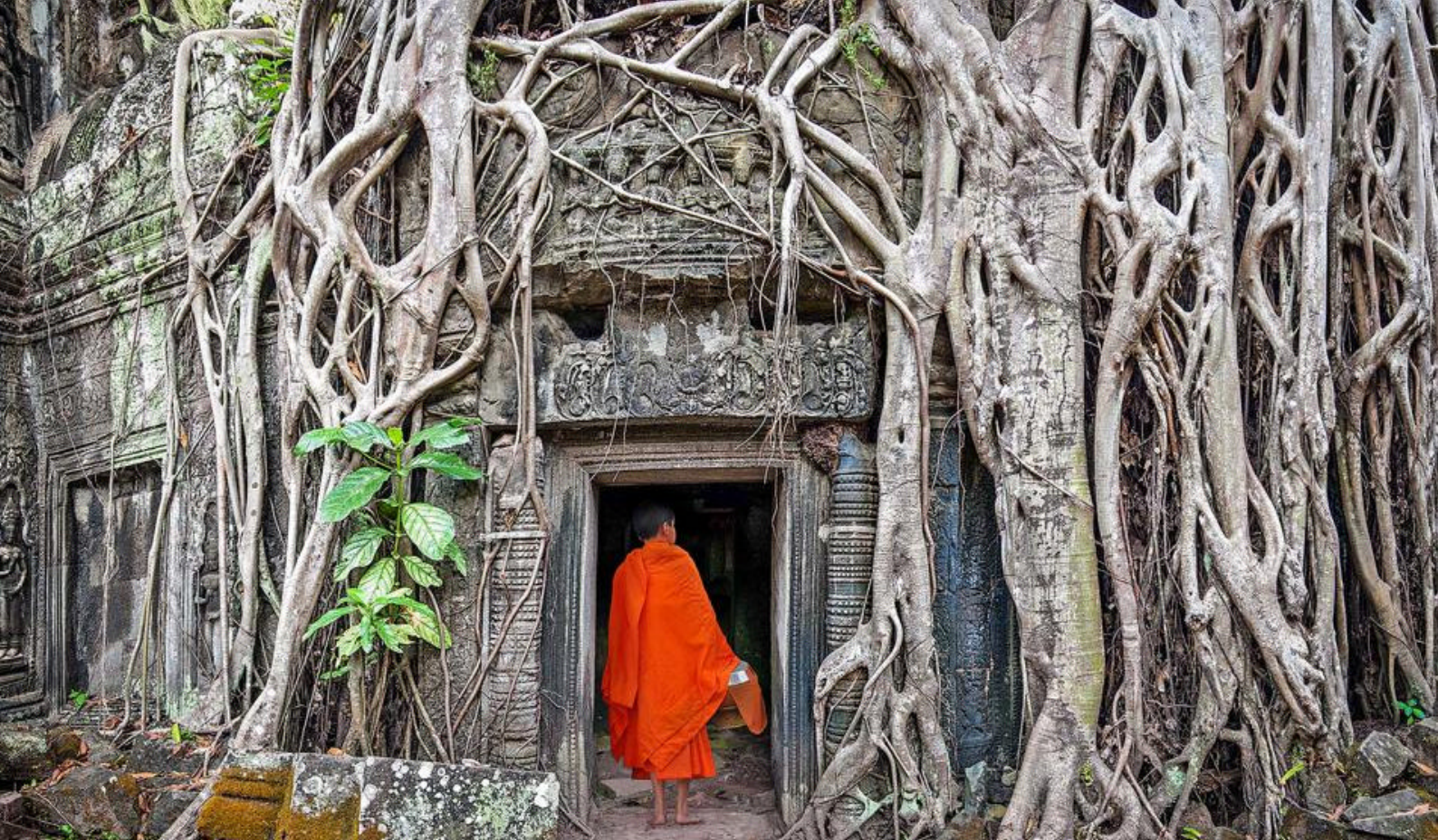
Wat Ta Prohm i Angkor Wat, Kambodsja

spørsmål, da lokalbefolkningen gjerne samhandler og viser frem sine ferdigheter. Tilbake i Hanoi kjører du umiddelbart til flyplassen, hvor det er direktefly til den gamle keiserbyen Hué om kvelden.