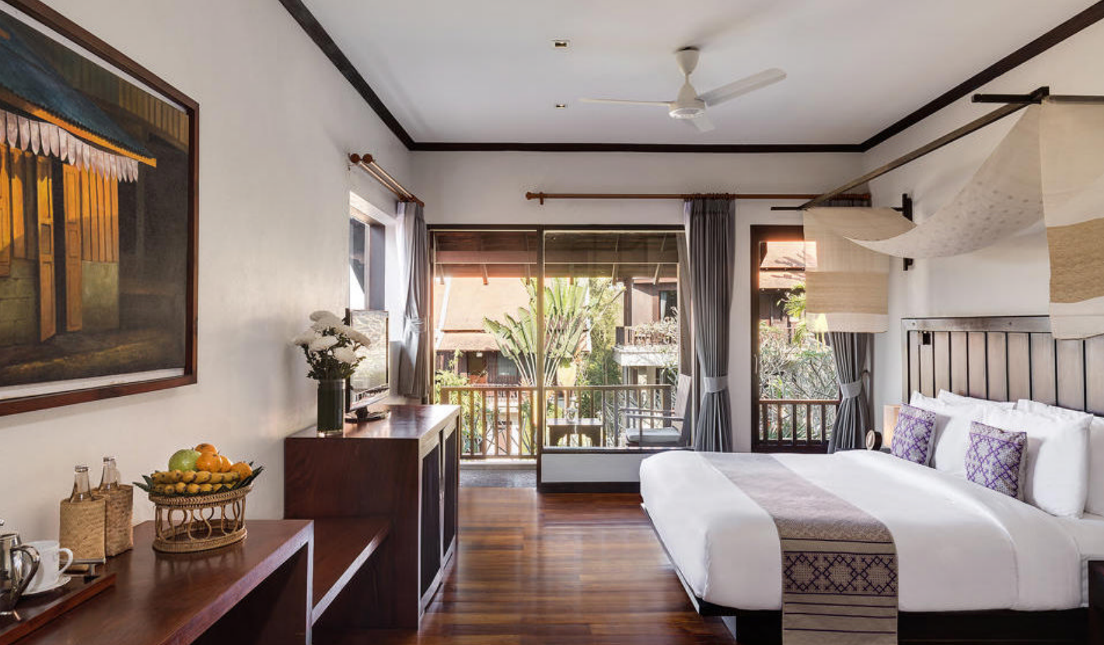
Deluxe room på Kiridara Hotel i Luang Prabang

godt. Du får høre mer om hvorfor denne teen er helt spesiell og hvordan du kan lage din egen kongelige te. Varighet: 3,5 timer.