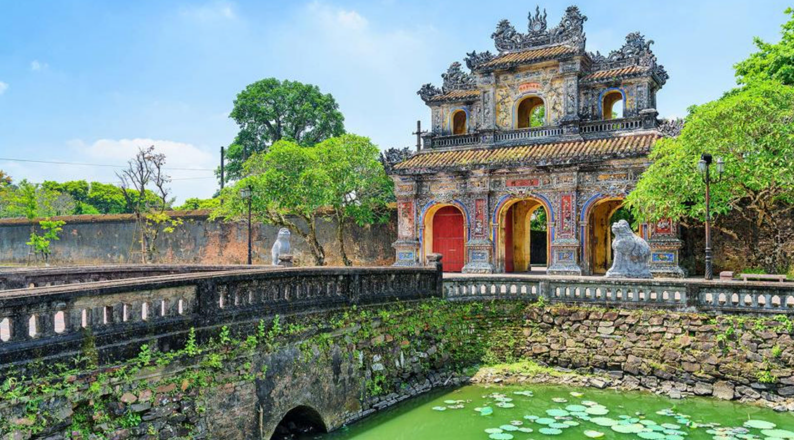
Imperial Citadel i Hue, Vietnam

silkekostymene, tydelig inspirert av veggmalier fra Angkor-templene. Forestillingen denne kvelden finner sted i herlige Angkor Village Apsara Theatre, det eneste i Siem Reap, og dansere, sangere og musikere bringer Khmer-kulturen til live mens du nyter kambodsjansk mat. Varighet 2-3 timer.