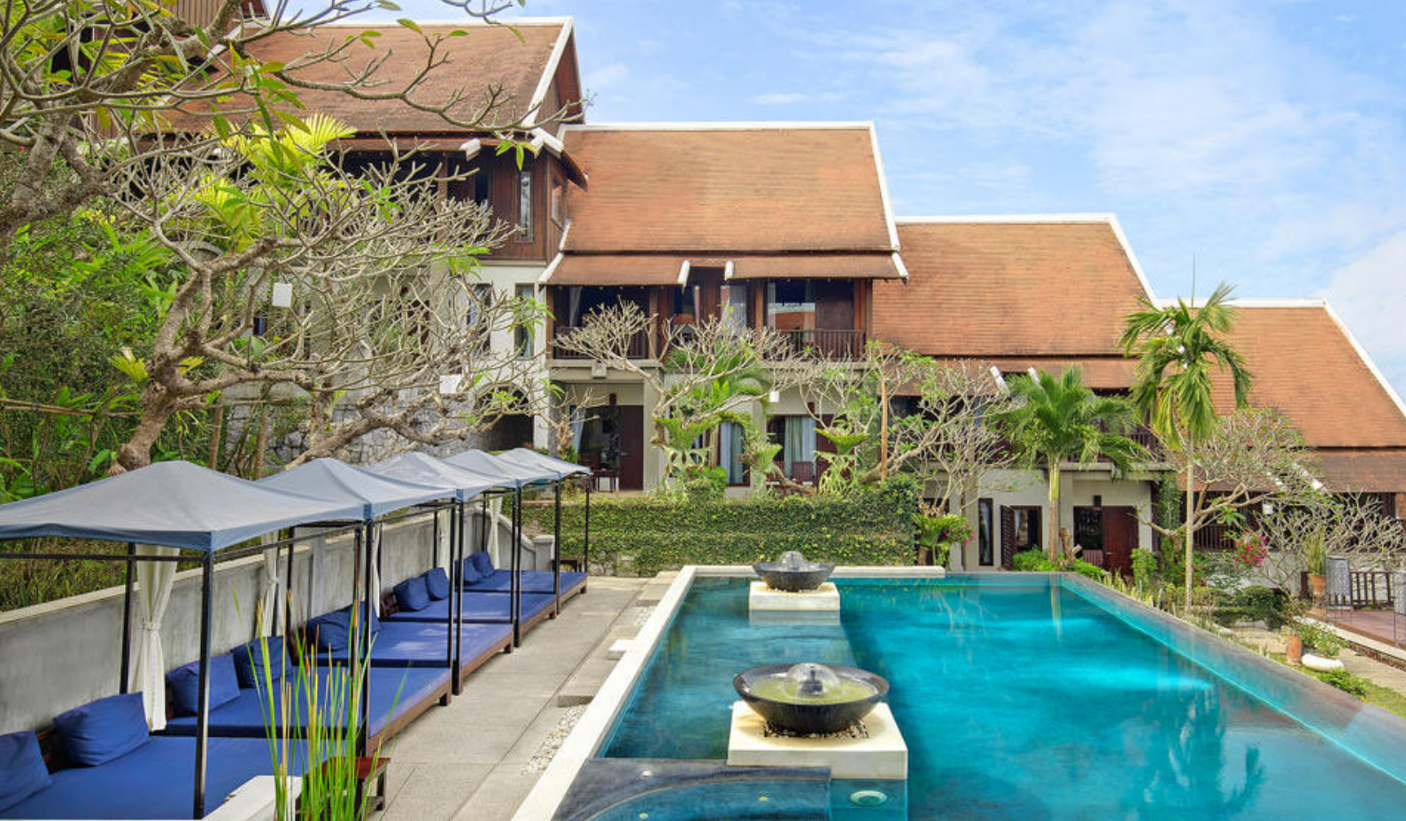
Basseng på Kiridara Hotel i Luang Prabang