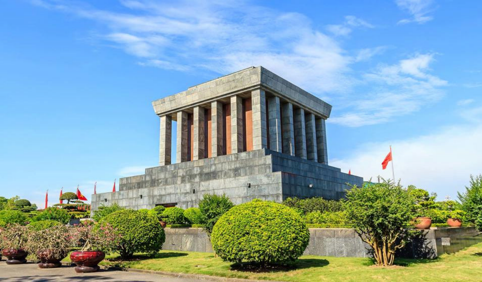
Ho Chi Minh Masoleum i Hanoi, Vietnam