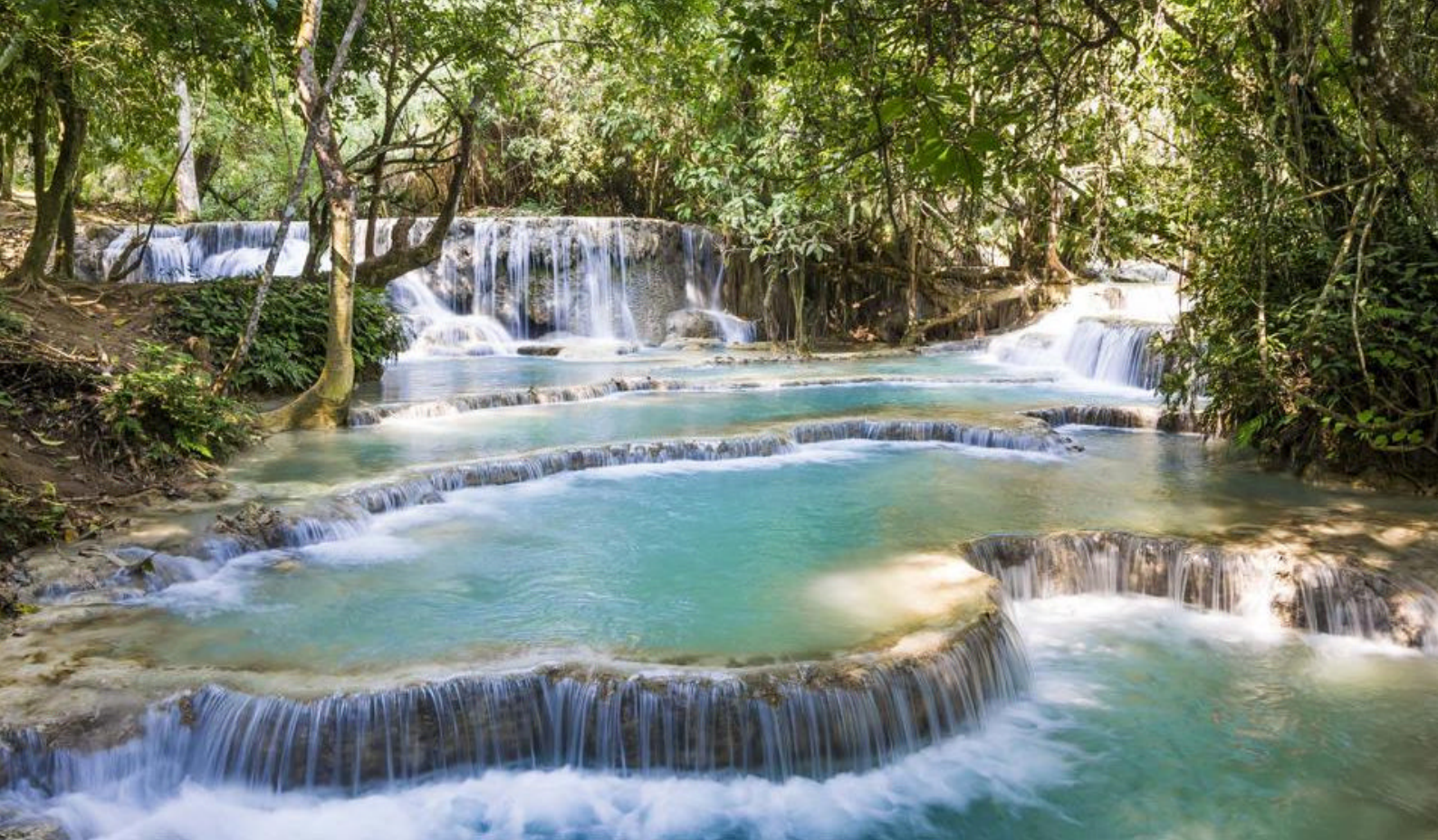
Vakre Kuang Si Waterfalls i Luang Prabang

bassenget, gå rundt i det gamle franske kvarteret og ta en spasertur langs den lille elven ikke langt fra hotellet. Det er mange alternativer, og Siem Reap er et sted hvor det også er deilig å gå rundt og slappe av.