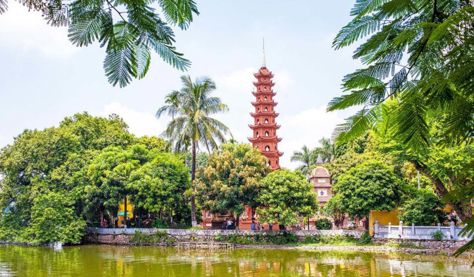
Tran Quoc Pagoda i Hanoi, Vietnam

bygd livet i Vietnam i ulike versjoner, akkompagnert av tradisjonell musikk med trommer, trebjeller, horn, bambusfløyter m.m. Noen ganger kan historien være akkompagnert av operasang - en ganske unik opplevelse. Varighet: Cirka 1 time. Avgang kl 17.00 fra hotellet.