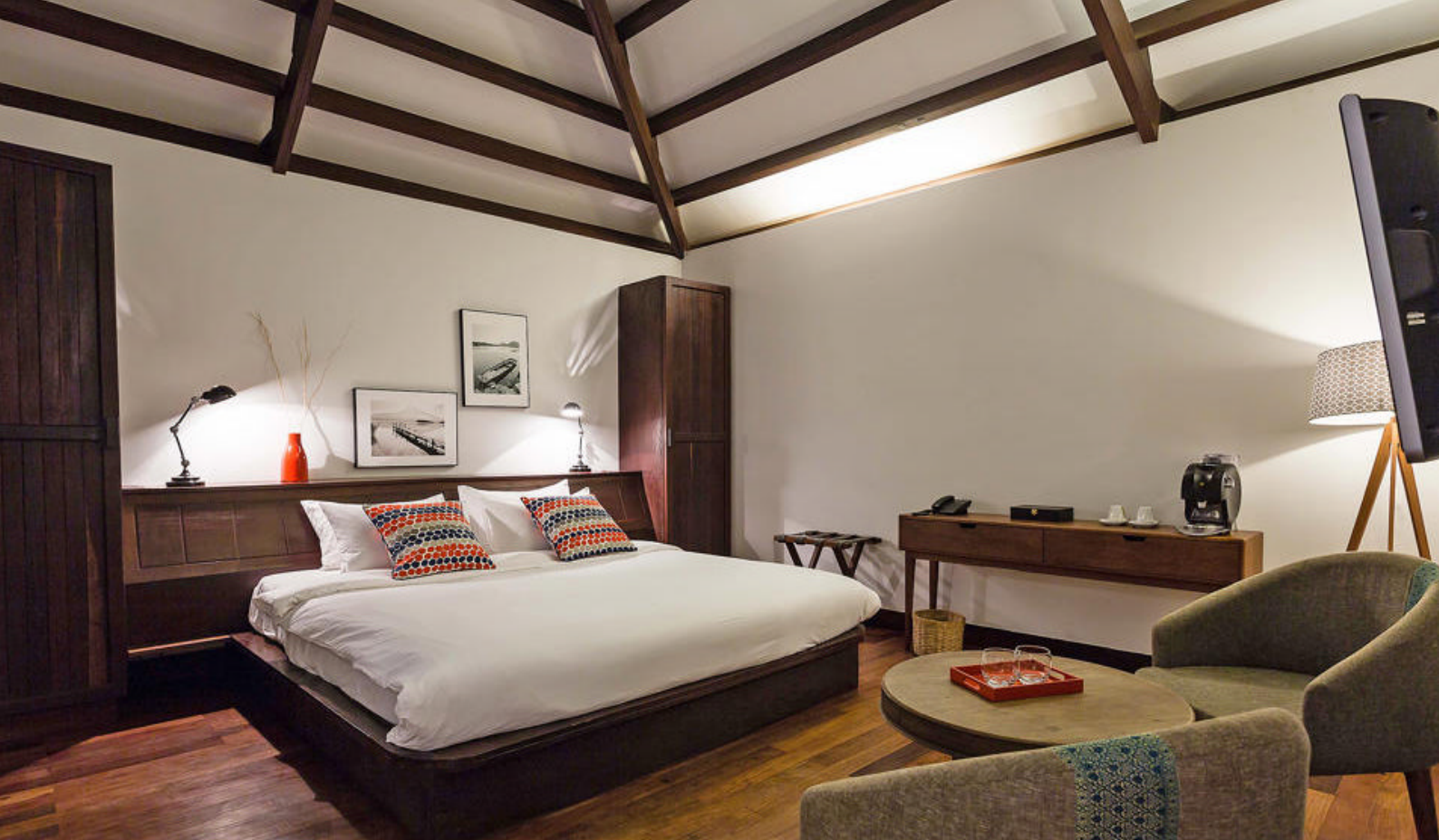
Heritage room på Heritage Suites Hotel i Siem Reap

i protest mot Ngo Dinh Diems undertrykkende styre i det som da var Sør-Vietnam. Munkens bil, som han forlot ved Pagoden, er der fortsatt som et minnesmerke over den tragiske hendelsen. Deretter kommer du tilbake til hotellet, hvor du kan forvente å være tilbake sent på ettermiddagen.