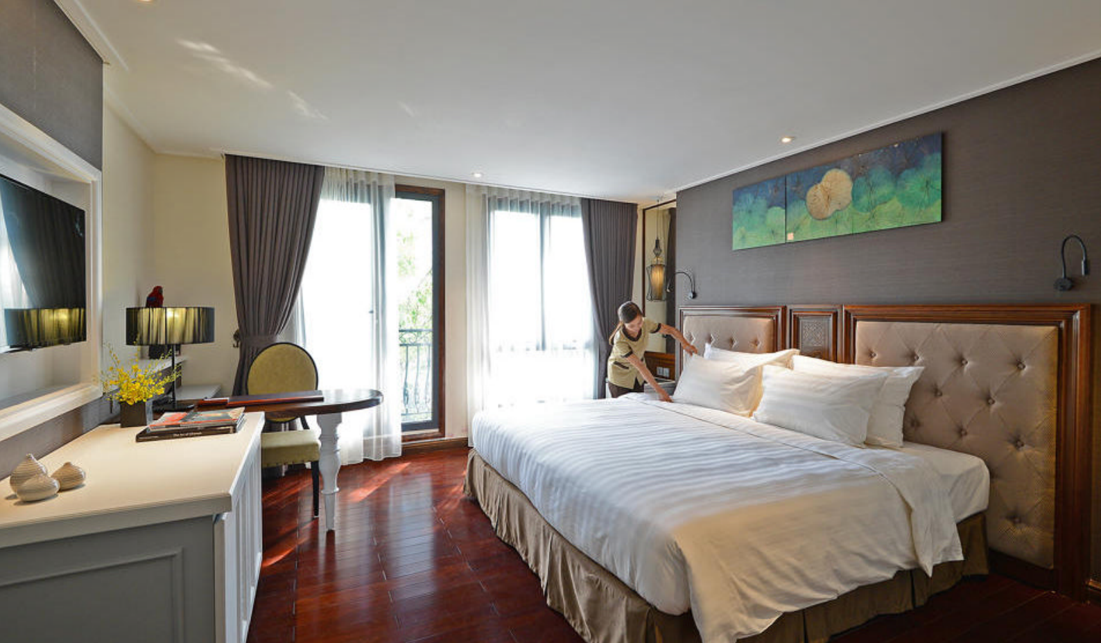
Lekre rom på The Chi Boutique Hotel i Hanoi