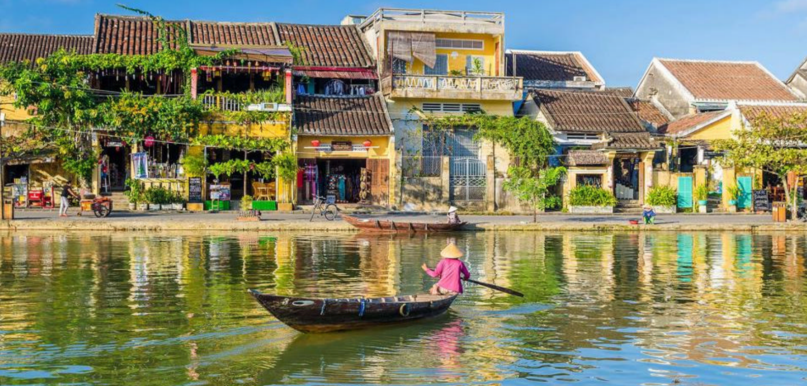
Sjarmerende Hoi An, Vietnam

Resten av dagen er på egenhånd. En aktivitet kan være å 'bestige' Mount Phousi, hvor det fra tempelet på toppen er en fantastisk utsikt over byen, elven og området rundt generelt. Eller du kan ta en nærmere titt på det vakre Wat Xieng Thong-tempelet, Wat Sene og/eller Wat May.