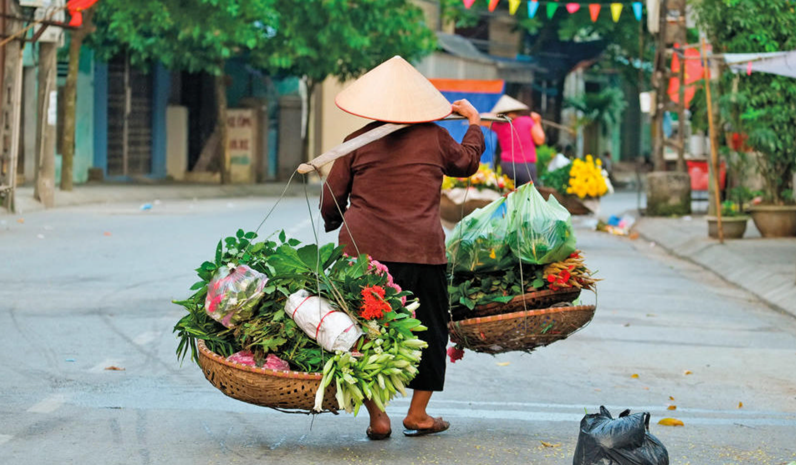
Typisk bilde i gatene i Hanoi