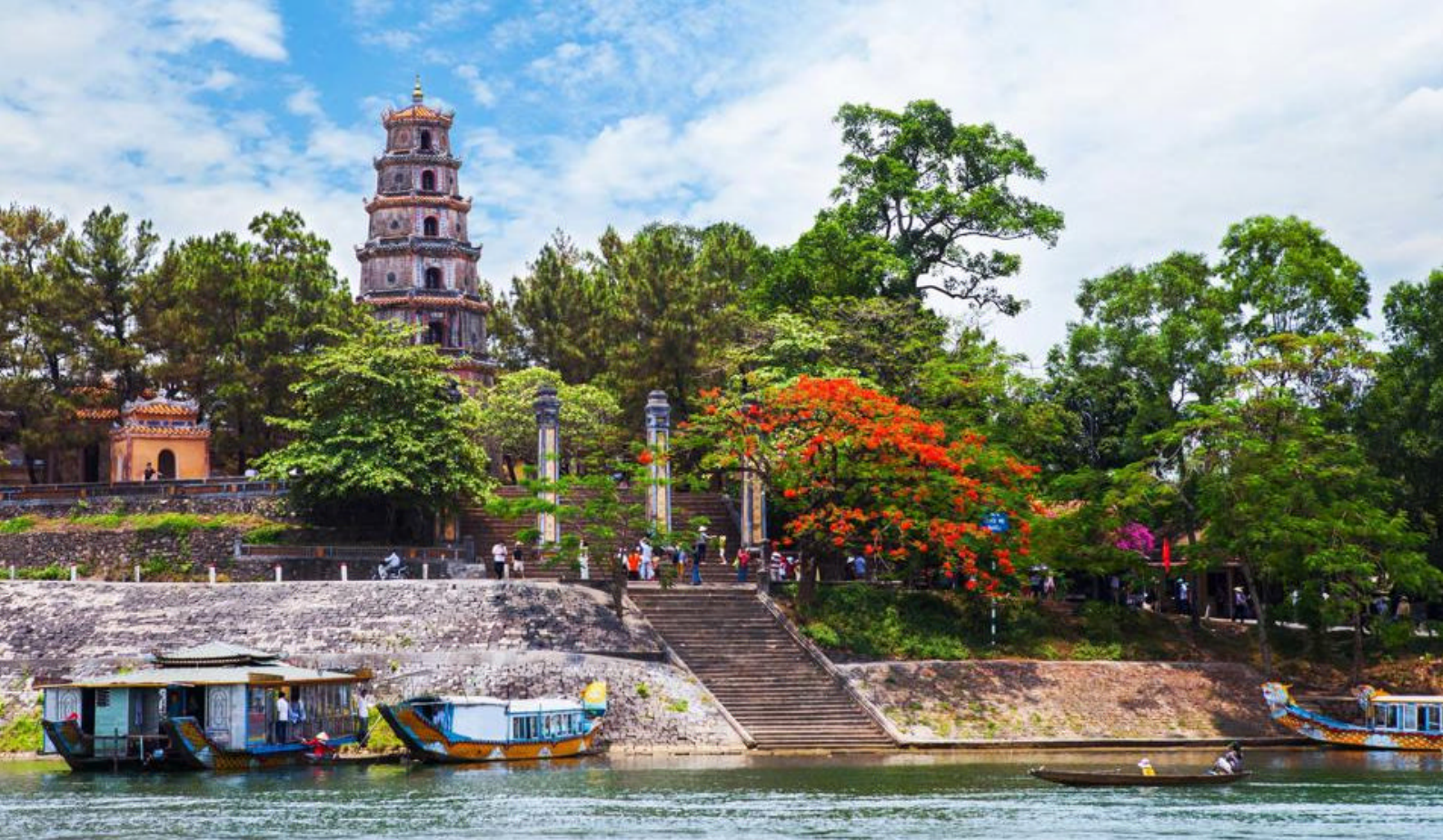
Det flotte 7-etajers tårnet Thien Mu Pagoda i Hue, Vietnam

kamera/mobiltelefon rett inn i ansiktet deres. Så det er derfor god praksis å: