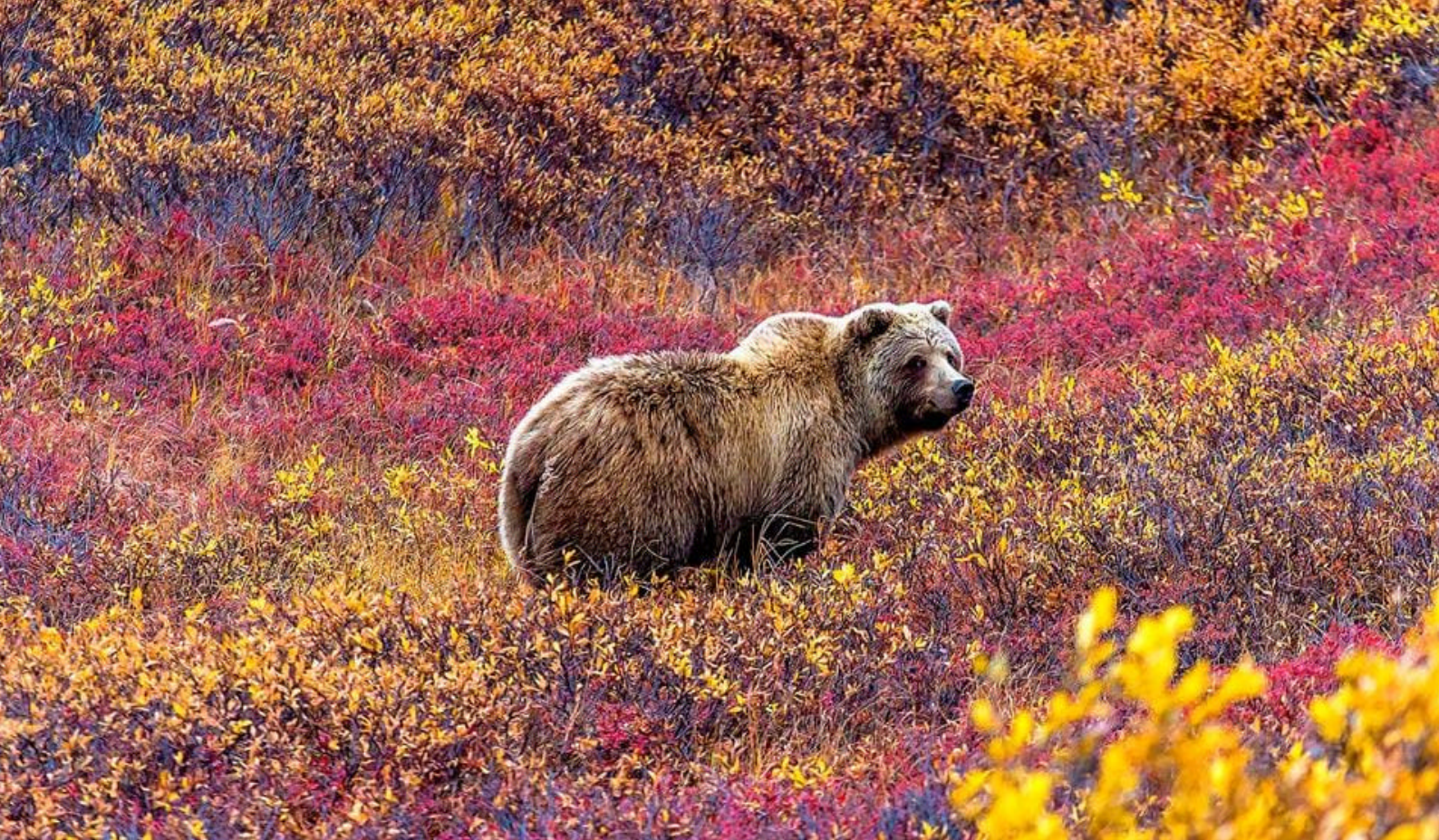
Se grizzlybjørner i Denali National Park