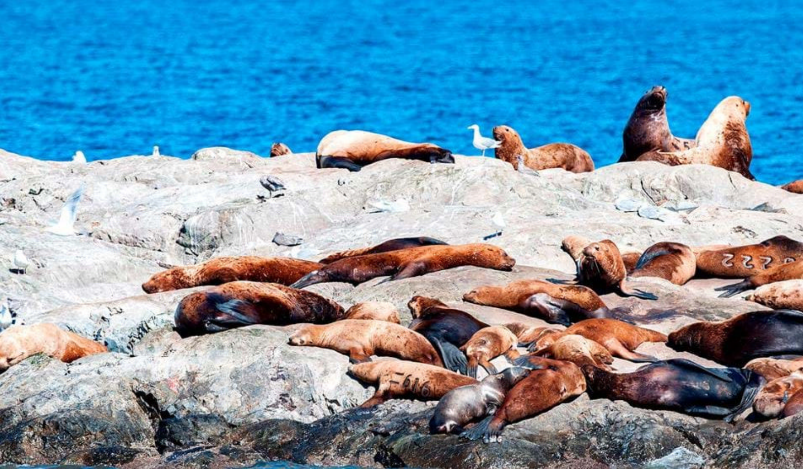
Sjølover - Prince William Sound

i Homer finner dere en pittoresk kystby som ligger ved bredden av Kachemak-bukten.