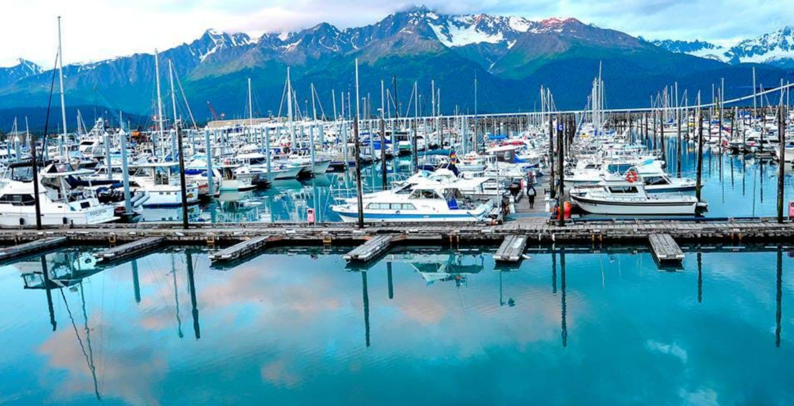
Seward i Alaska