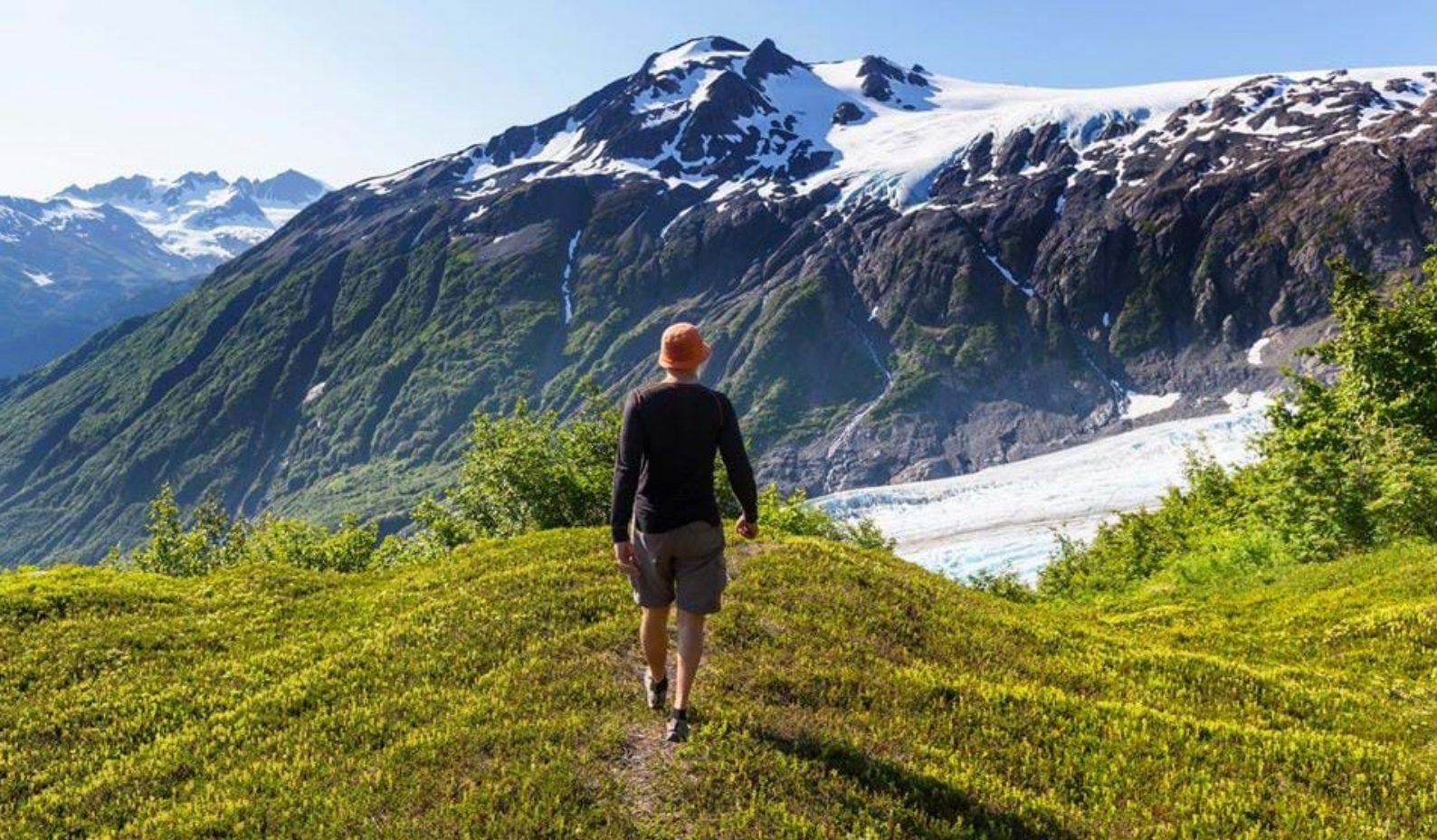
Ta en avstikker til Exit Glacier

Matanuska Glacier er en av de mest tilgjengelige av Alaskas mange isbreer. Matanuska er ca. 40 km lang og velter ut av Chugach Mountains.