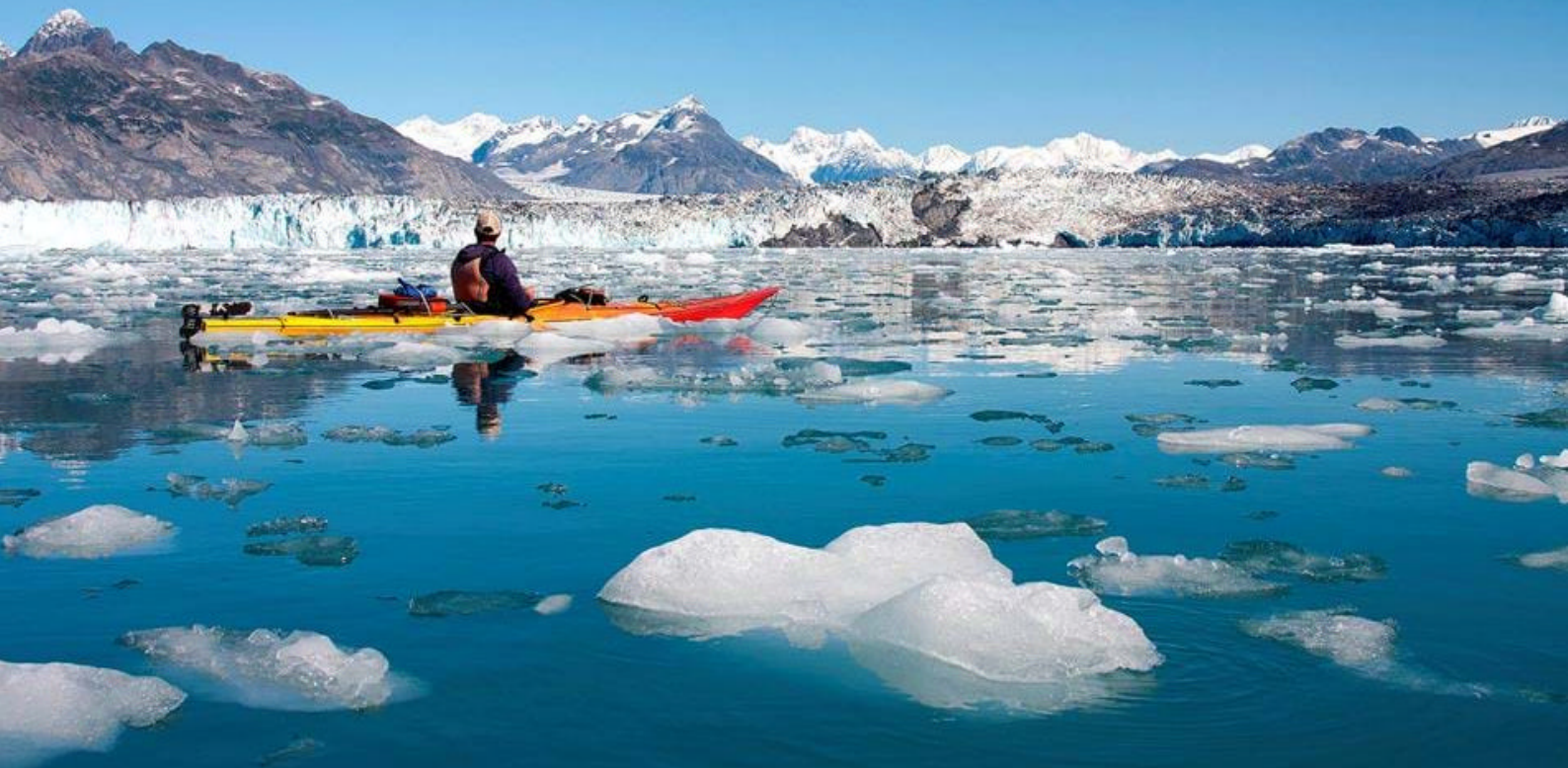
Flott kajakkstur i Kenai Fjords

I dag forlater dere den flotte nasjonalparken Denali, og turen fortsetter på Parks Highway og videre nordpå til Fairbanks. På veien passerer dere utrolige landskap og enorme skogsområder. Dere har tid til å gå på litt sightseeing i Fairbanks - og her kan man f.eks se huset til 'julenissen'. Deretter fortsetter turen nordpå mot Chena Hot Springs, og før dere kommer frem dit kjører dere forbi Chena River Recreation Area.