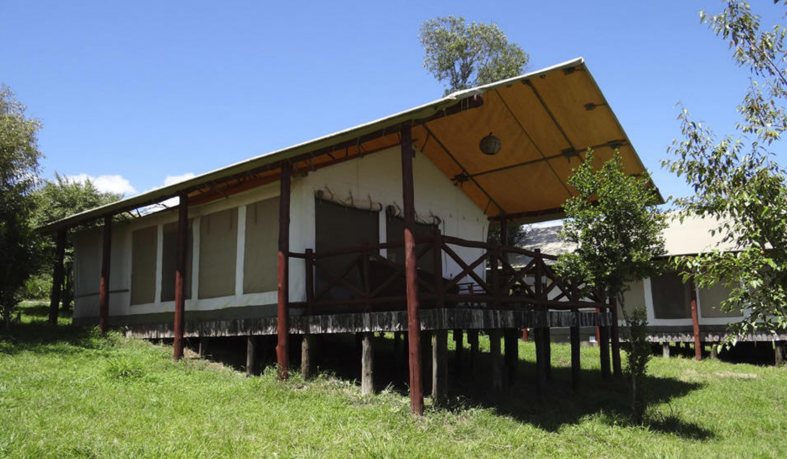
Ashnil Mara Camp i Masai Mara