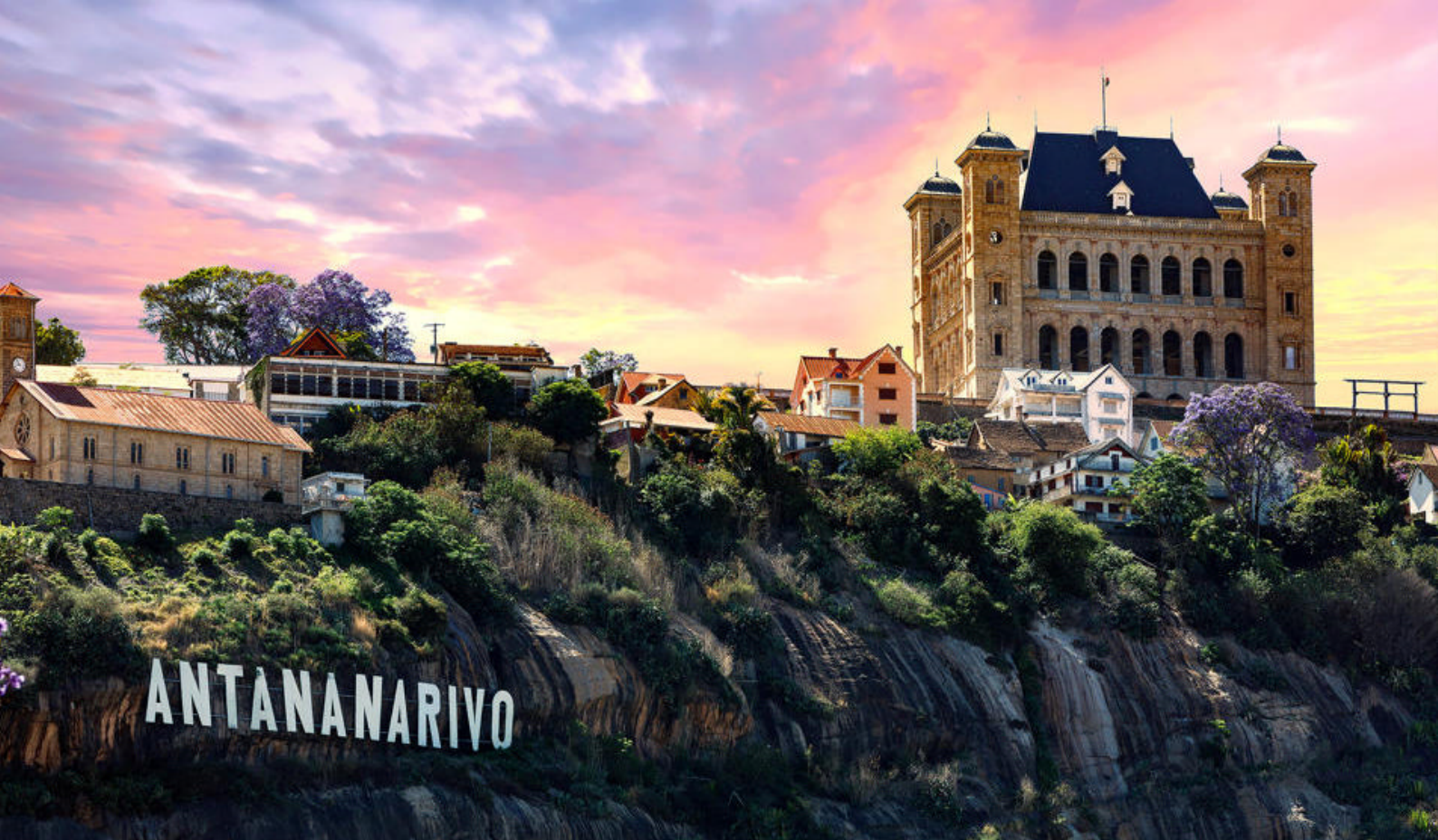
Antananarivo, Madagaskars hovedstad

I nasjonalparken lever det hele 12 forskjellige lemurarter, deriblant den sjeldne aye-aye, også kalt fingerdyr. Som i Andasibe er det her også andre dyr enn lemurer, slik som: