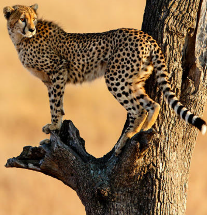
Gepard i Masai Mara

forstår fort hvorfor Lake Nakuru av mange kalles for «a birdwatchers paradise». De høye «Yellow Fever» - akasietrærne nær innsjøen er tilholdssted for bøfler, vannbukker og forskjellige antiloper. Godt gjemt oppe i trekronene eller i den tette skogen befinner den skye leoparden seg.