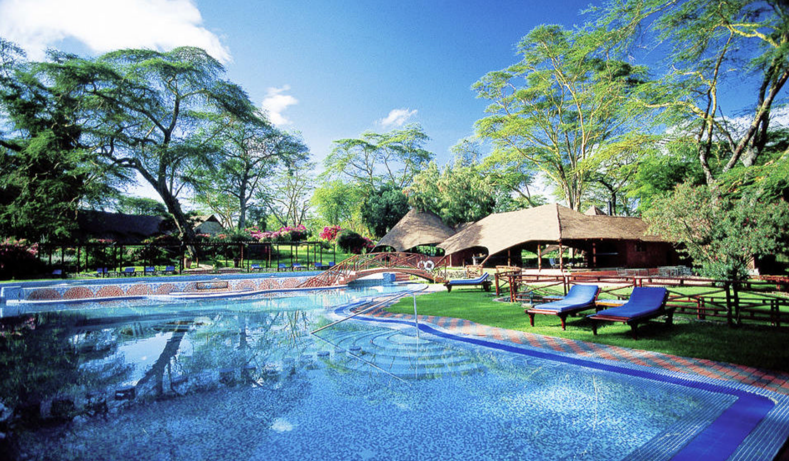
Lake Naivasha Sopa Lodge