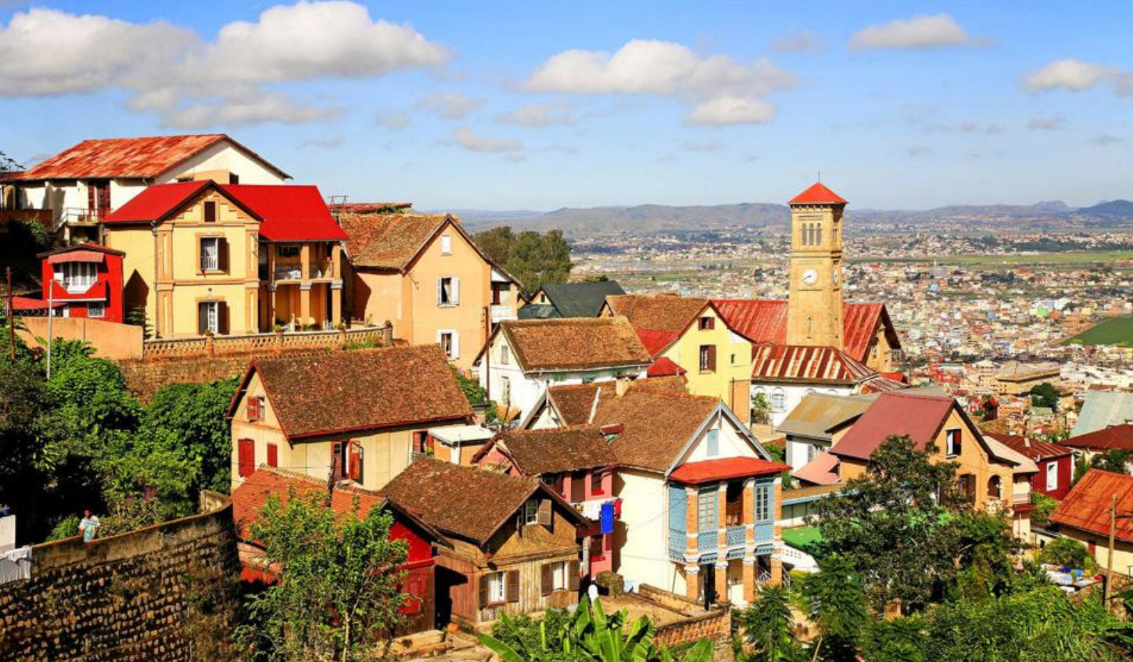
Antananarivo, Madagaskars hovedstad

ankommer byen Isalo. Her skal dere overnatte.