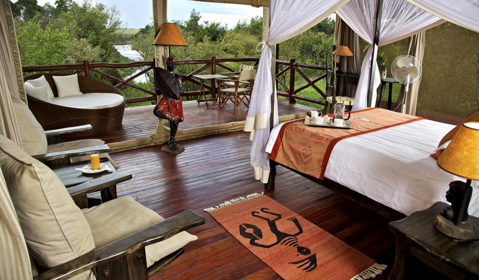
Bo i stilfulle safaritelt på Ashnil Mara Camp i Masai Mara