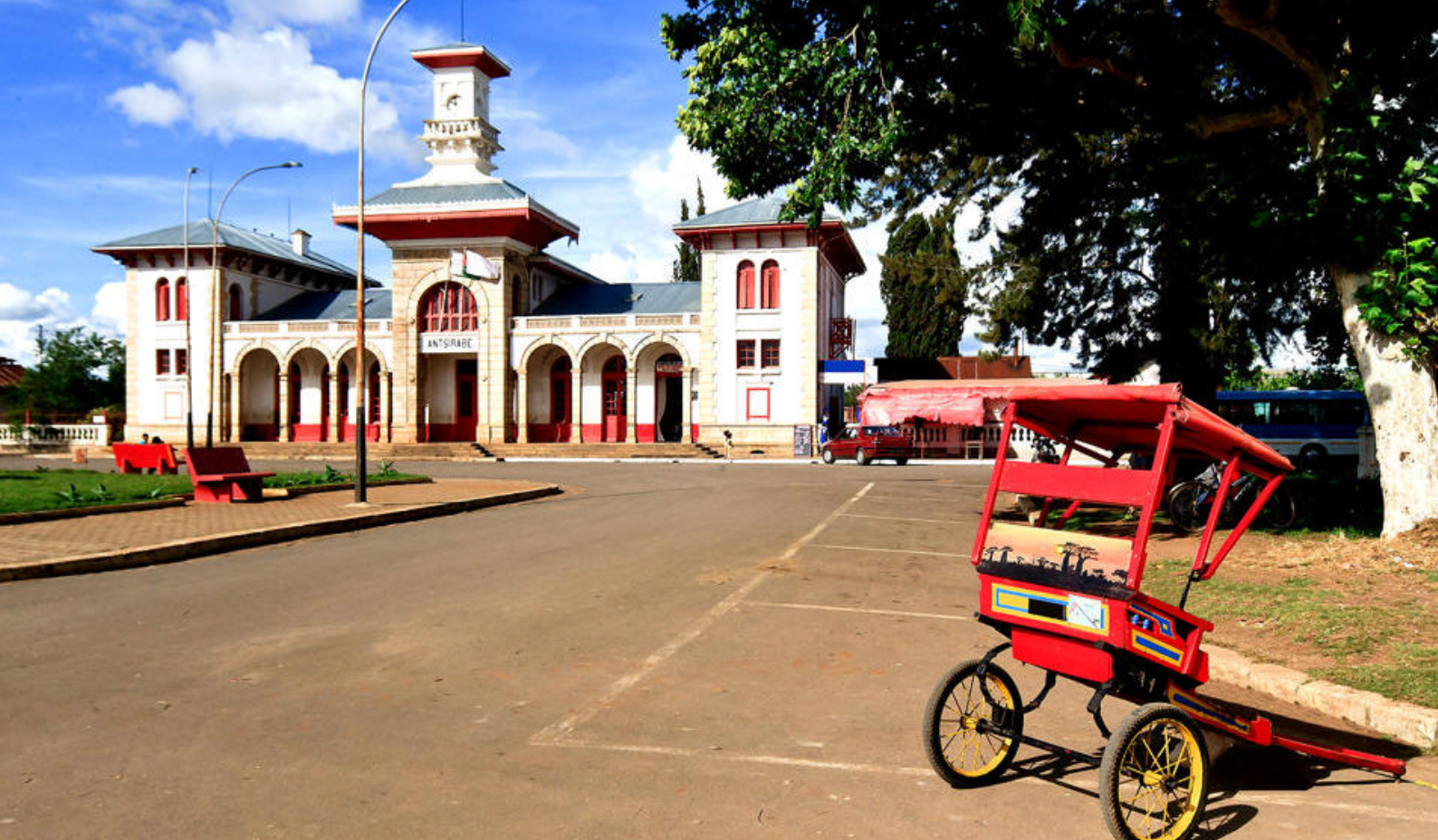
Andasibe på Madagaskar