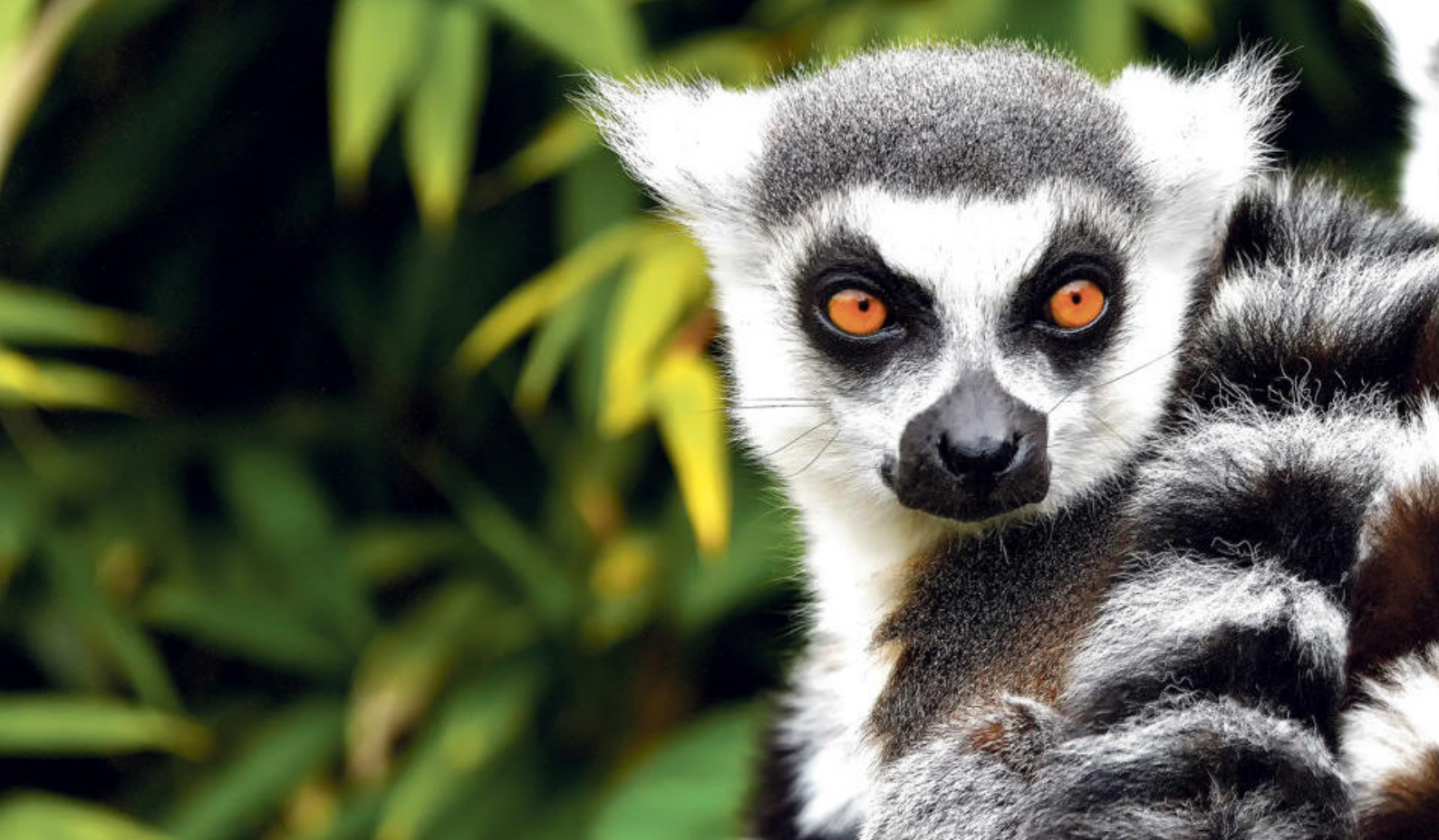
Lemurene, Madagaskars endemiske halvape

Standard overnatting: Residence Lapaso eller tilsvarende