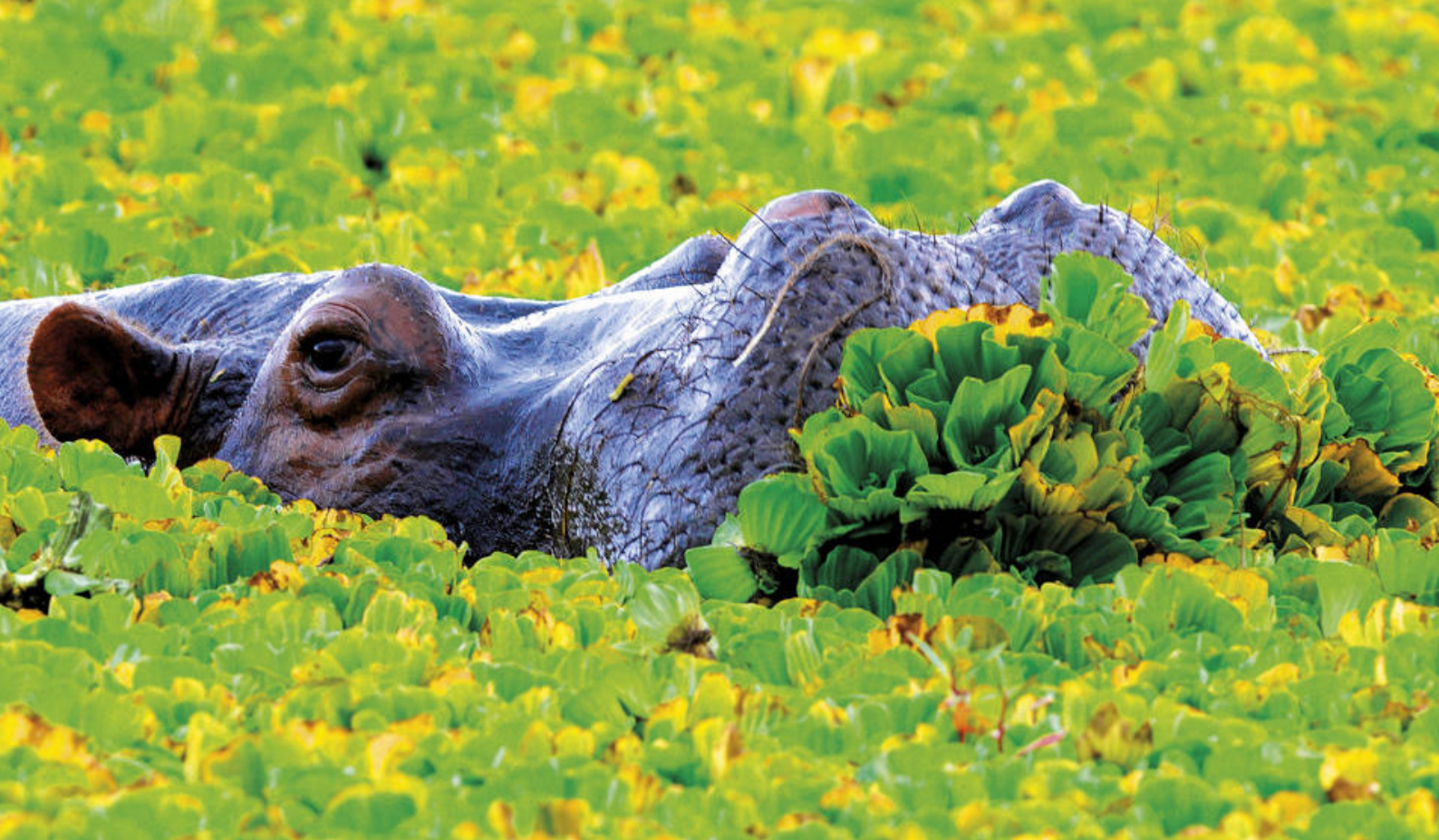
Flodhest i Lake Naivasha

drive med medbrakt lunsj som nytes på savannen. Dere bestemmer!