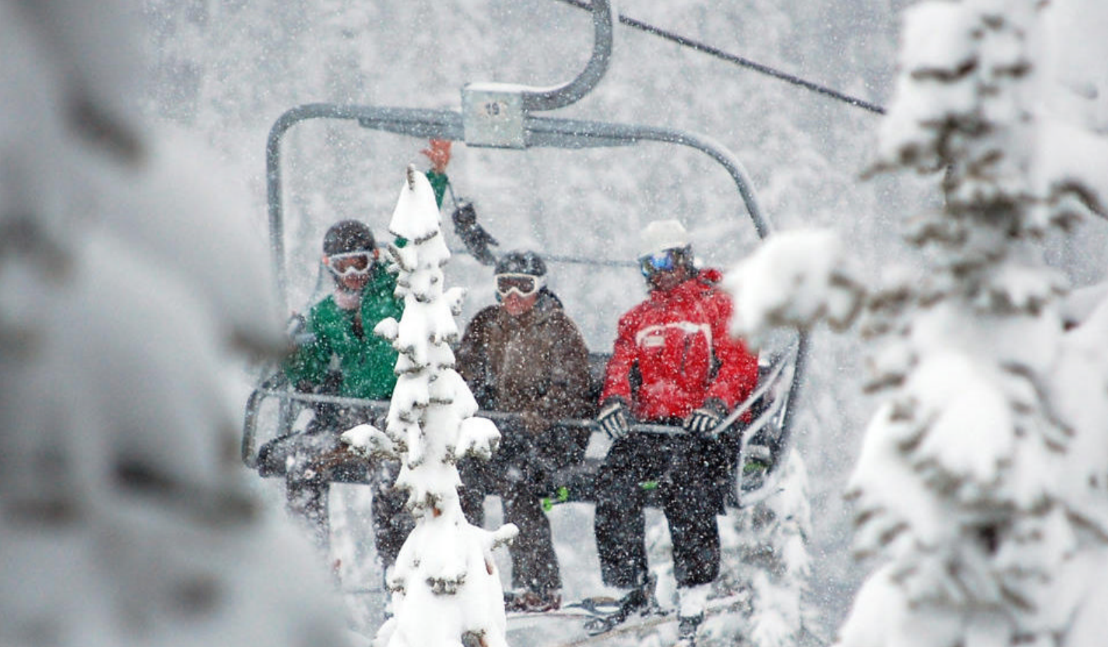
Skiferie i Canada.