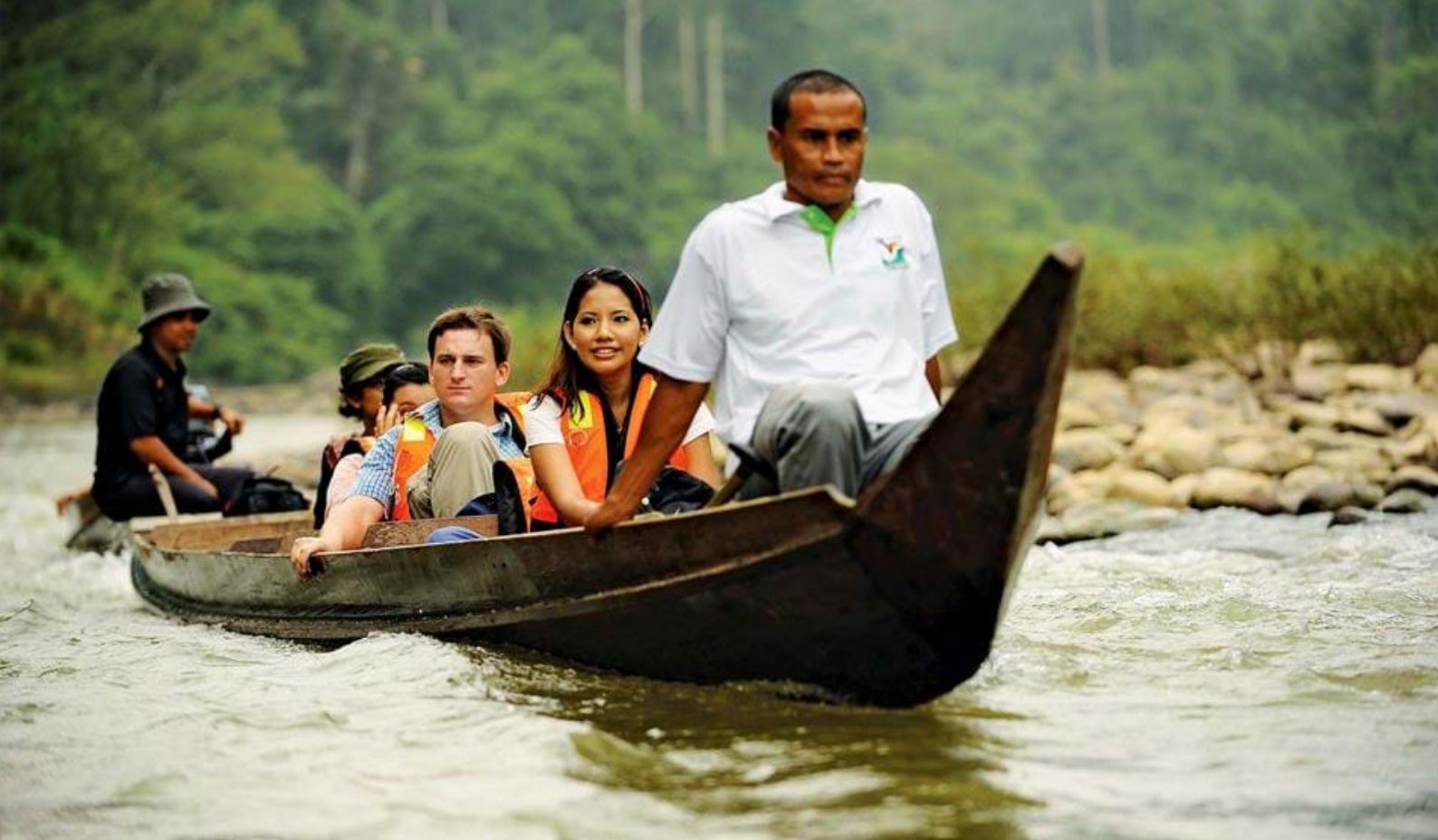
Elverafting i Taman Negara.