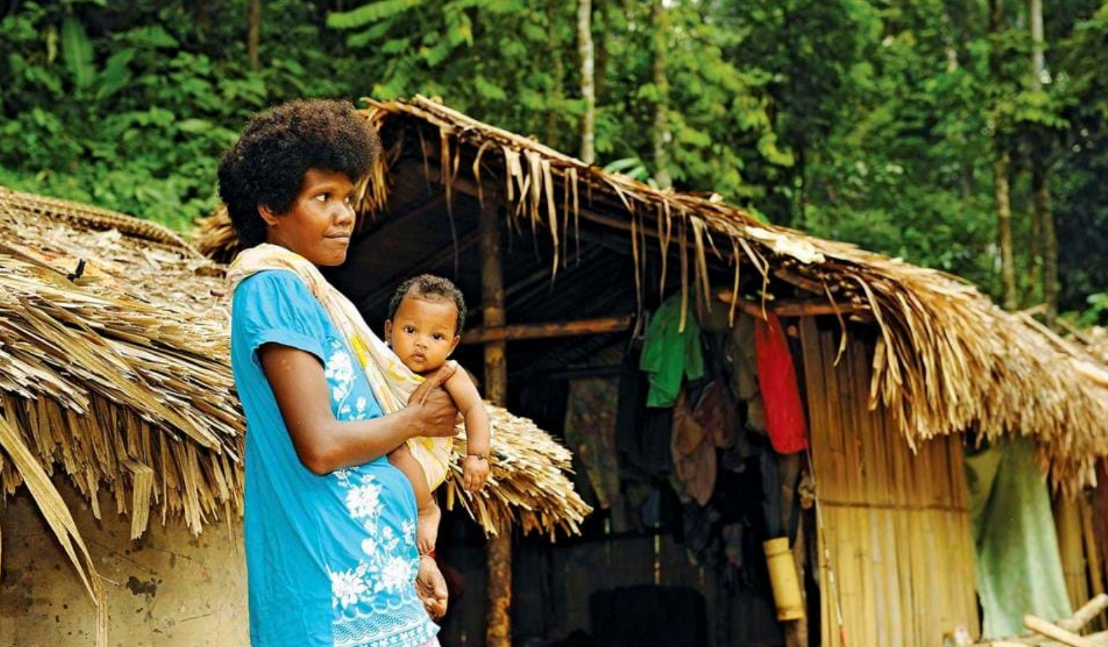
Orang Asli-folket i Taman Negara.

dere kommer ikke til å oppleve disse ville og skye dyrene, da de lever dypt inne i jungelen.