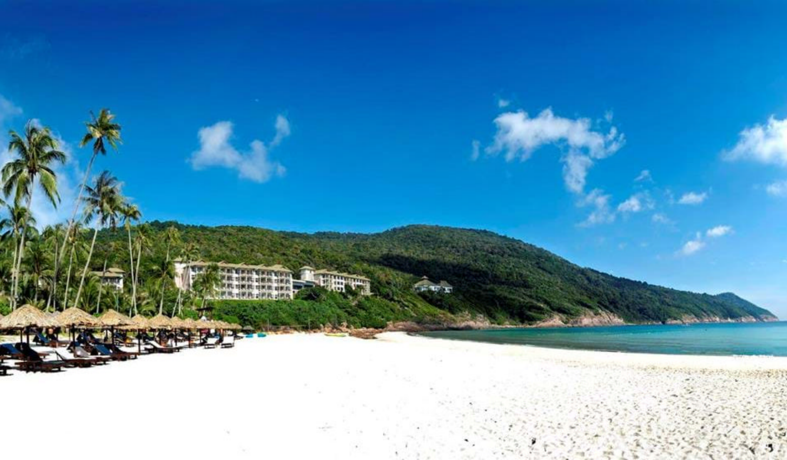
The Taaras, Redang

Hvis dere ønsker å ha stranda for dere selv, bør dere bo på The Taaras. Dette flotte luksushotellet ligger på den nordlige delen av øya, ved en kjempevakker sandstrand og krystallklart vann. Et opplagt sted for de som ønsker det lille ekstra under oppholdet.