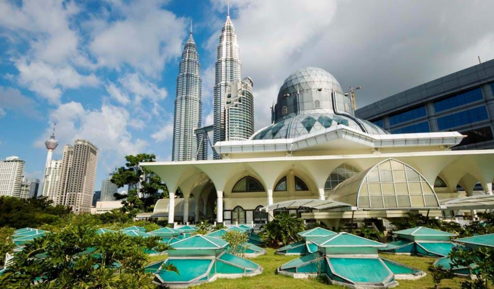
Grand Mosque i Kuala Lumpur

Kuala Lumpur (KL) ble primært grunnlagt på grunn av de store tinnforekomstene som ble funnet på midten av 1800-tallet. Der KL ligger i dag, var på den tiden et sted hvor man kunne komme lengst opp langs Klang-elva med tinnmalm og andre forsyninger, derfor ble KL et viktig distribusjonssted.