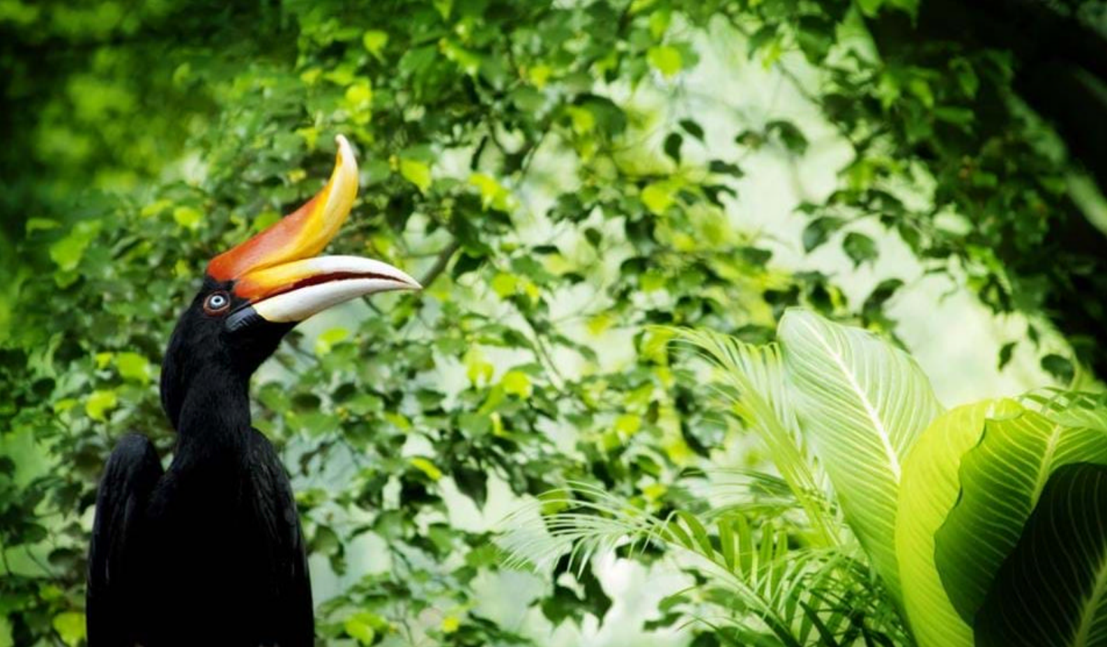
Hornfugl i Taman Negara