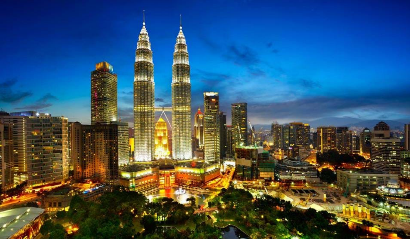
Petronas Towers i Kuala Lumpur