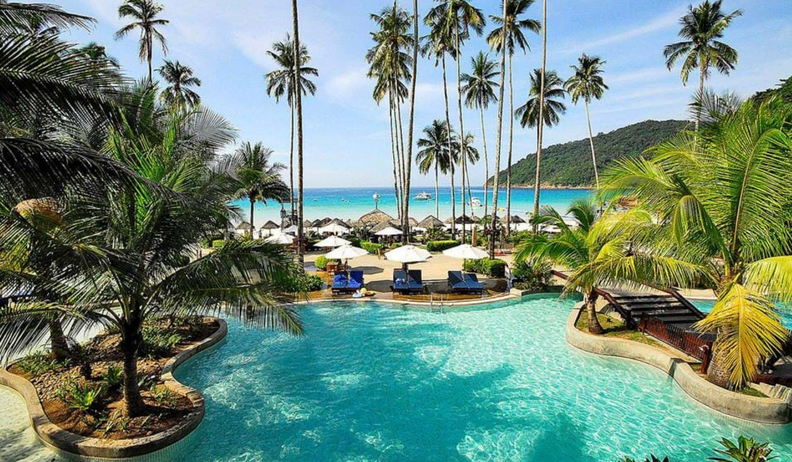
Basseng ut til stranda på The Taaras, Redang