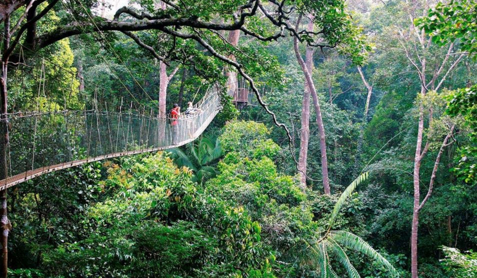
"Conopy Walking" i Taman Negara.

Gunung Tahan, det høyeste fjellet i området.