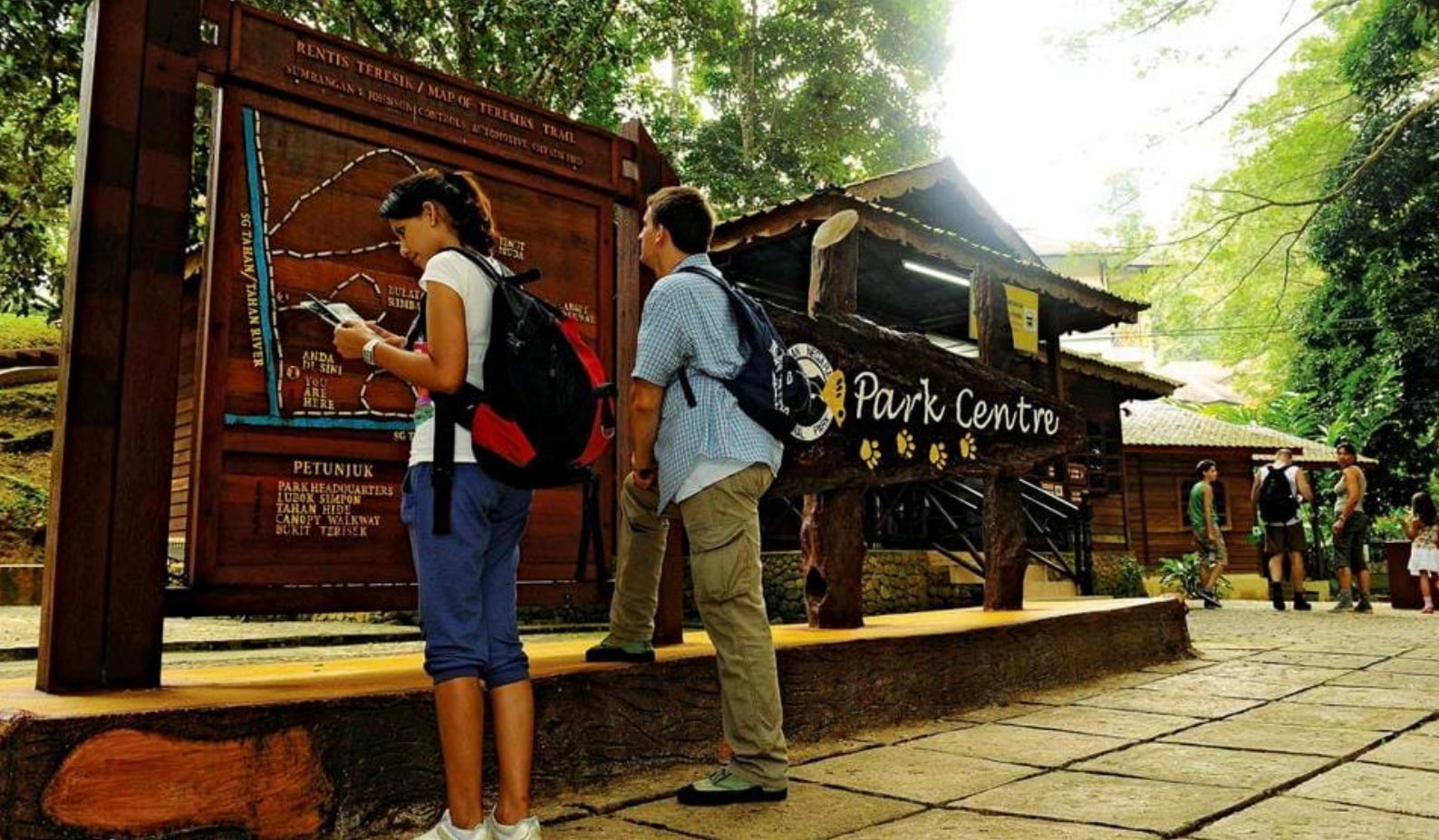
Mutiara, Taman Negara.

Overordnet oppdeler man Orang Asli i tre hovedgrupper: Senoi, Orang Malayu Asli og Negrito. Det er store forskjeller mellom disse tre gruppene.