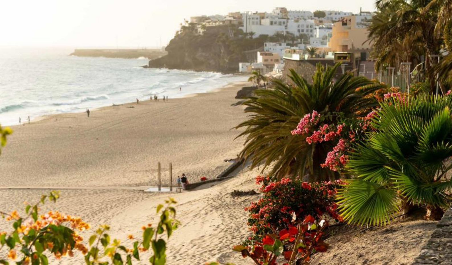
Nyt de brede, gygne sandstrendene på Fuerteventura