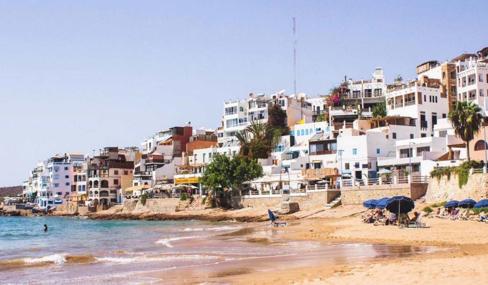
Fiskerlandsbyen Taghazout i Marokko kan nås på en dagstur fra Agadir

som ligger på en liten øy forbundet med byen via en bro. Fra toppen av tårnet får man fantastisk utsikt over både byen og havet.