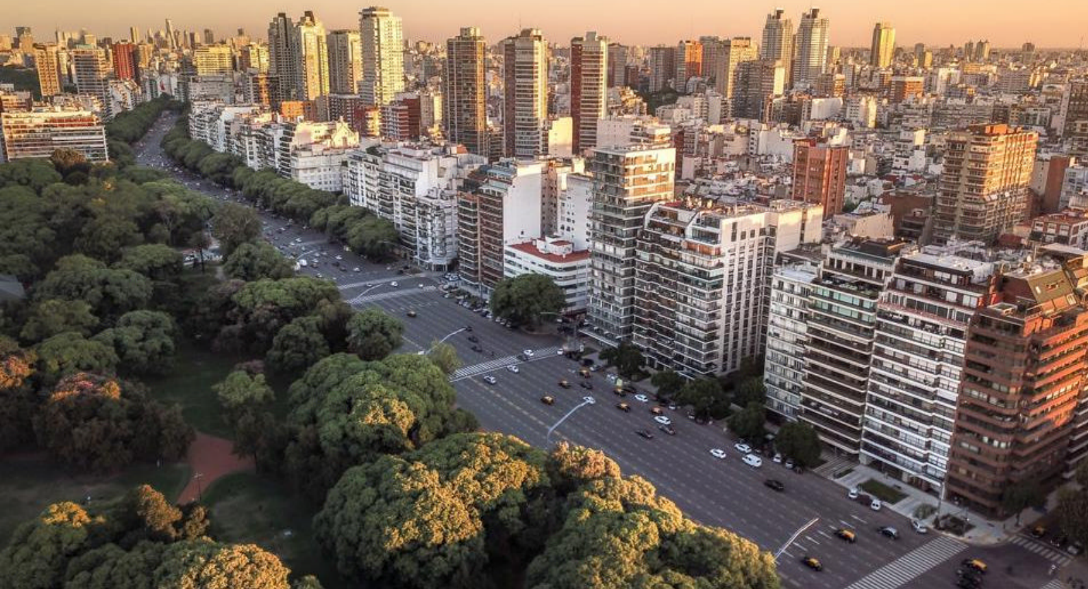
Start reisen i Argentinas spennende hovedstad, Buenos Aires

under et middagsarrangement på Café de los Angelitos. Her serveres en 3-retters middag akkompagnert av et flott tangoshow. Privat transport samt drikkevarer er inkludert i arrangementet.