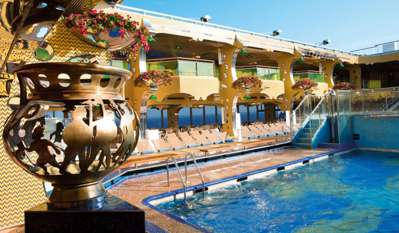
Bassengområde på Costa Serena

Underveis nyter dere en klassisk lunsj på en lokal bodegón, hvor dere får en autentisk smak av det argentinske kjøkkenet og byens helt spesielle stemning.