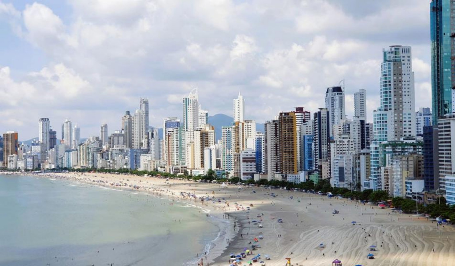
Den imponerende kystlinjen i Camboriú, Brasil

Besøk også Cristo Luz, byens ikoniske statue som ruver over Camboriú og byr på flott utsikt over området.