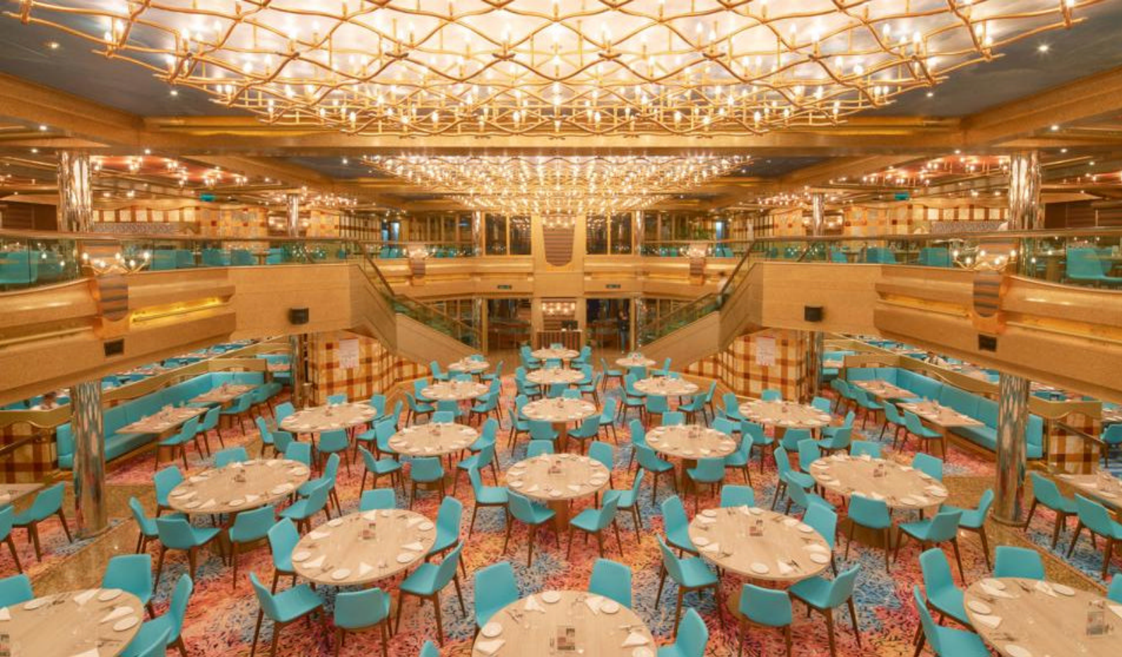
Restauranten Ceres på Costa Serena

en lavere pris. Til gjengjeld sørger våre lokale representanter på ankomstdestinasjonen for trygghet og god oppfølging under reisen.