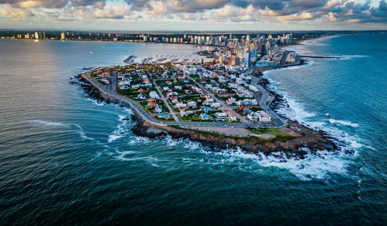
Utforsk strendene på begge sider av halvøya Punta del Este i Uruguay

besøk det elegante området Beverly Hills med grønne alléer og eksklusive villaer.