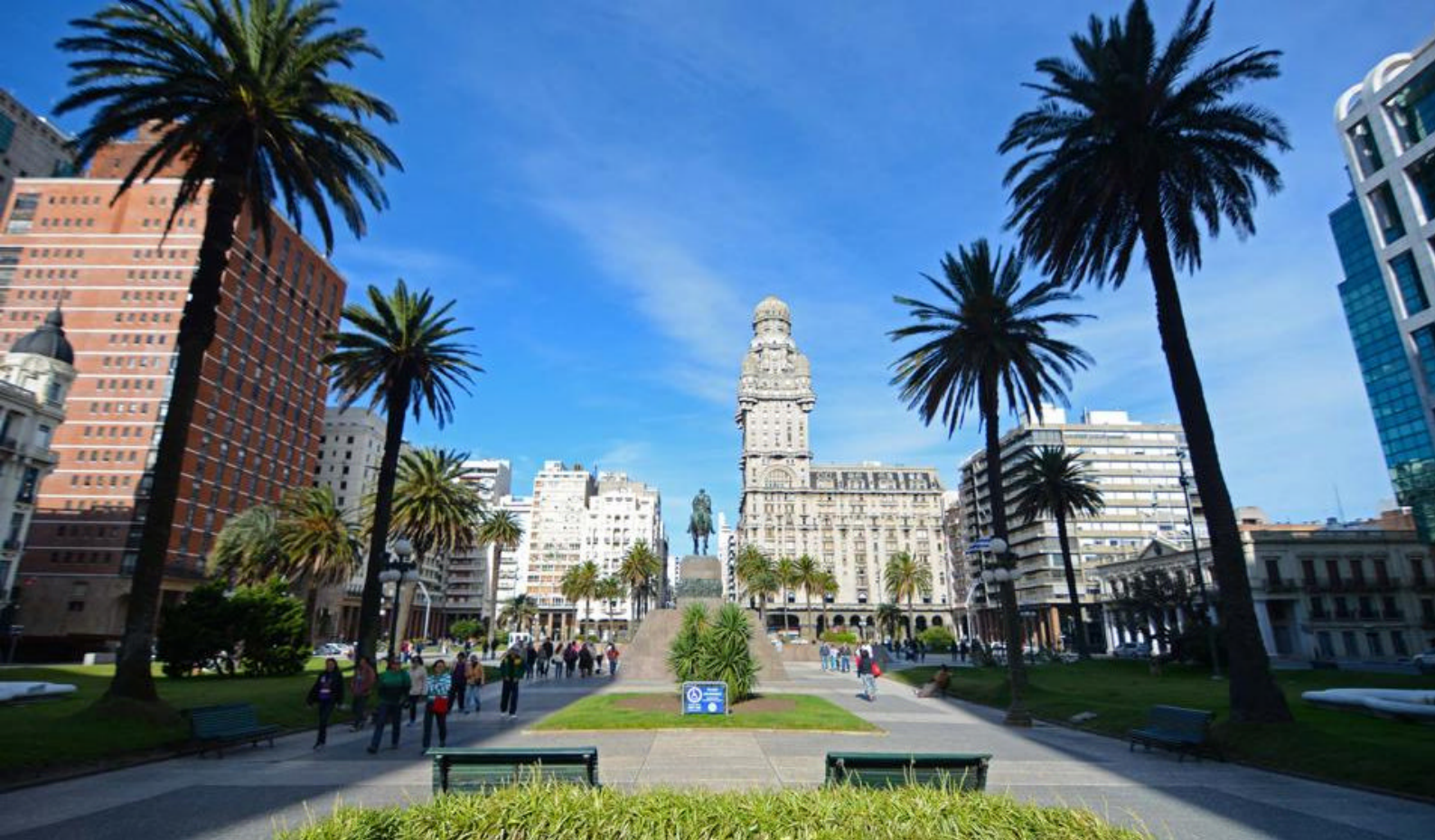
Oppdag Montevideos gamleby