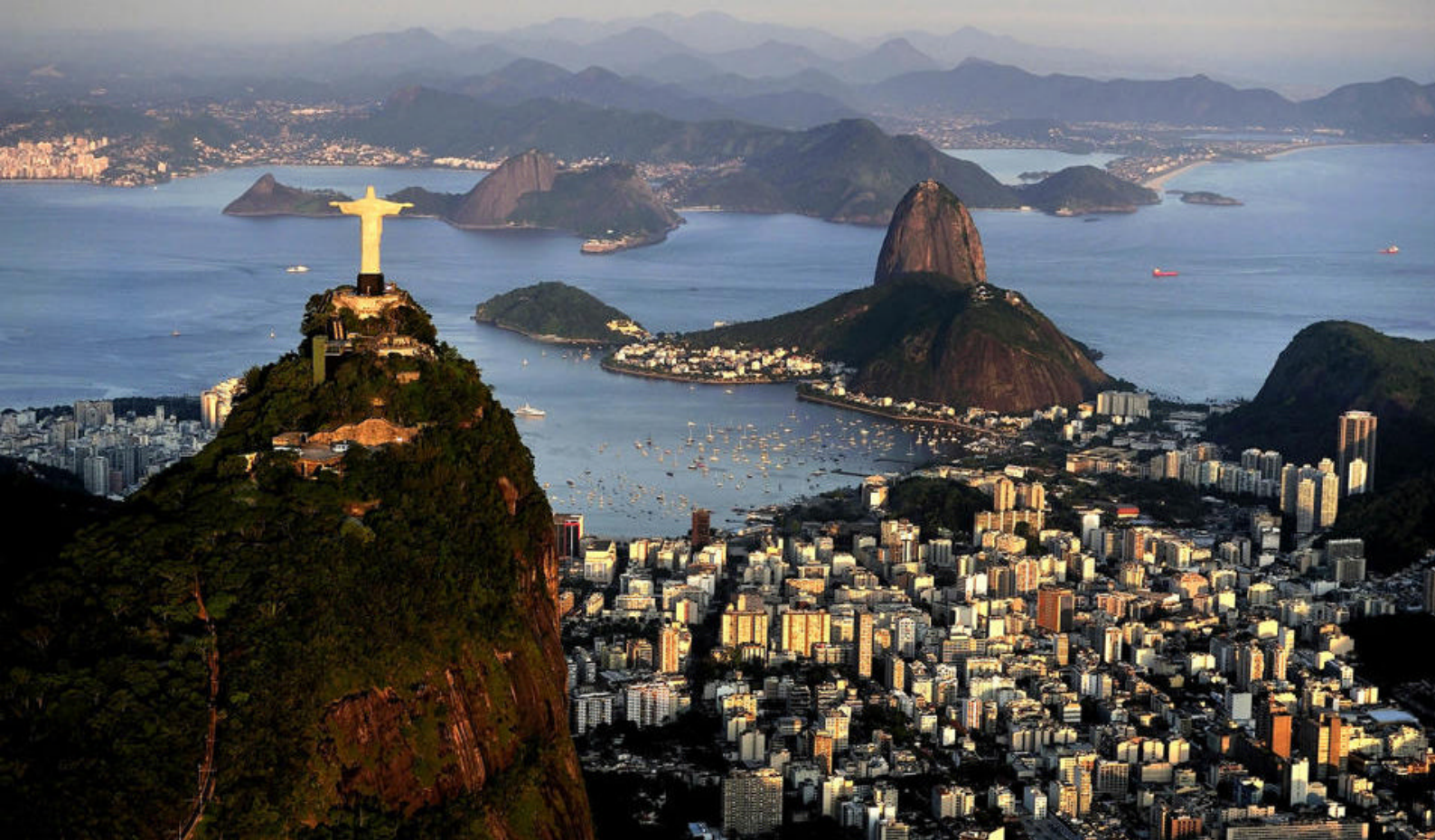
Besøk Kristusstatuen på toppen av Rio de Janeiro

Dere ankommer sprudlende Rio de Janeiro kl. 07.00, og skipet seiler ikke videre før kl. 21.00 i kveld. Sørg derfor for å få mest mulig ut av tiden i denne minneverdige byen.