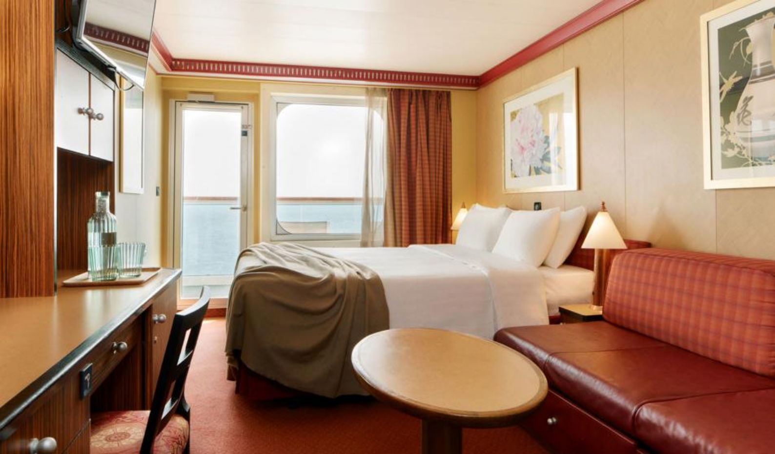
Eksempel på balkonglugar på Costa Serena