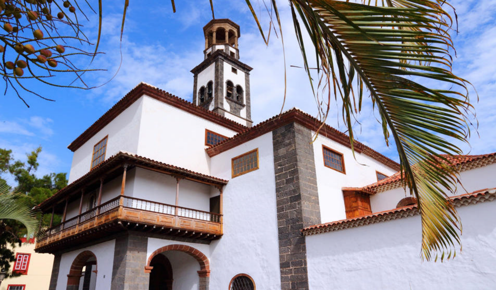
Se byens eldste kirke, Iglesia de la Concepción, i Santa Cruz de Tenerife

som både ønsker individuell fleksibilitet og muligheten for sosialt samvær med andre under reisen. Navnet har det fått da konseptet er en mellomting mellom gruppereiser og individuelt skreddersydde reiser.