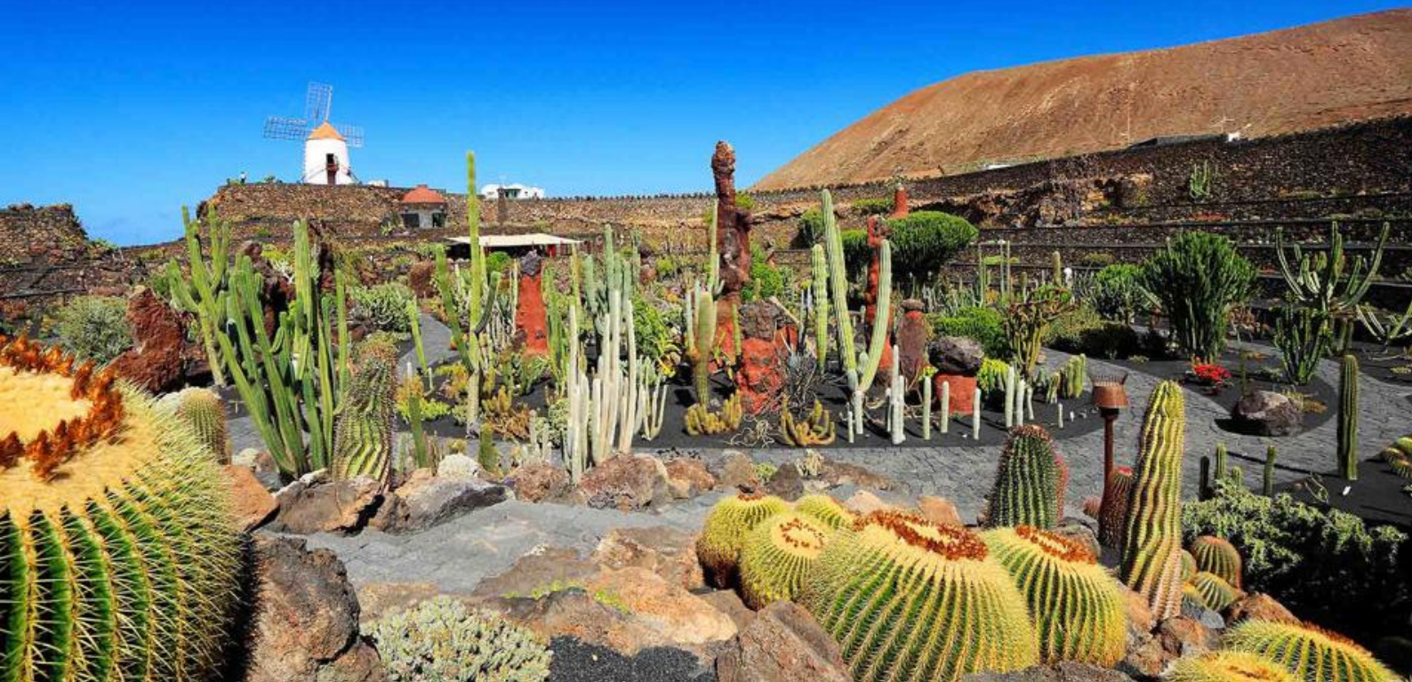
Besøk en kaktusfarm på Lanzarote