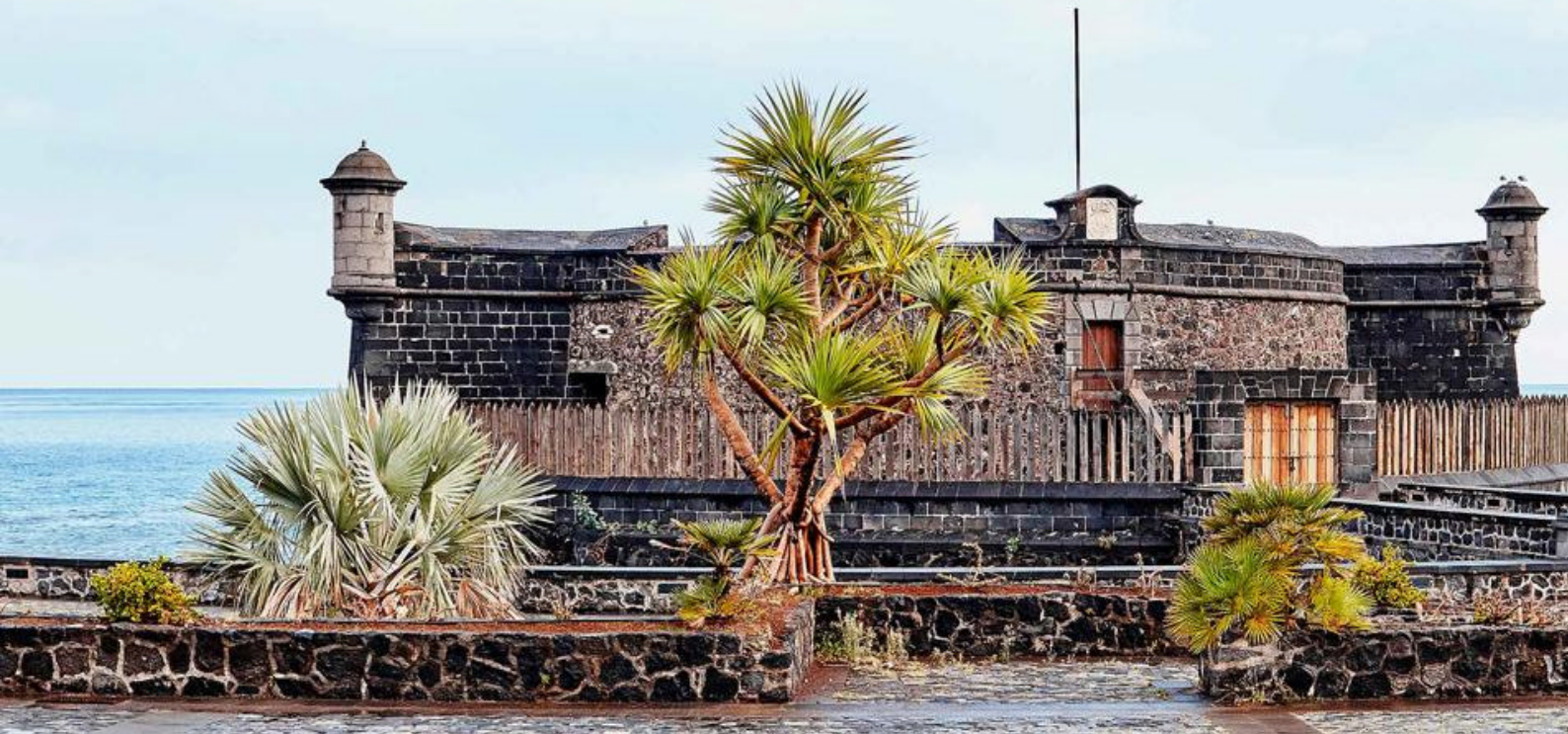
San Juan Bautista? slottet er en historisk festning i Santa Cruz de Tenerife og har spilt en avgjørende rolle i byens historie

mote til suvenirer. Og når kvelden senker seg, er det rikelig med underholdning å velge blant, husk å sette av tid til å oppleve de fantastiske showene, musikken og aktivitetene som venter.