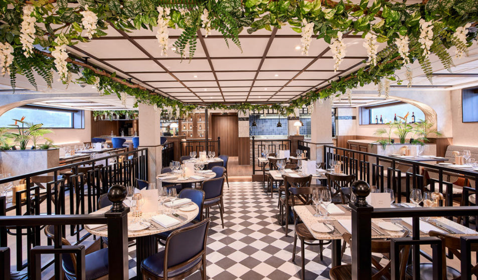
Moments Restaurant med italiensk cuisine om bord

og internasjonalt kjøkken. Her serveres også noen lokale spesialiteter inspirert av regionen dere seiler gjennom.