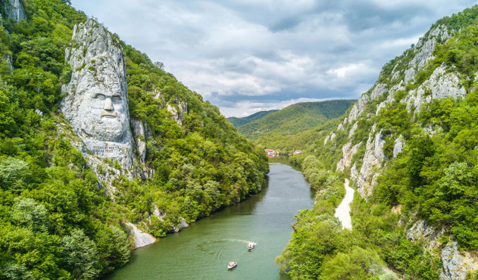
Donaukløften i Romania

De mange parkene og grønne områdene inviterer til rolige pauser langs elven, mens severdigheter som det kurfyrstelige slottet gir innblikk i byens kulturelle arv. I den gamle bydelen finner dere også Haus zum Stein, som er en av de eldste bevarte bygningene i Mainz og et fint eksempel på middelalderens arkitektur.