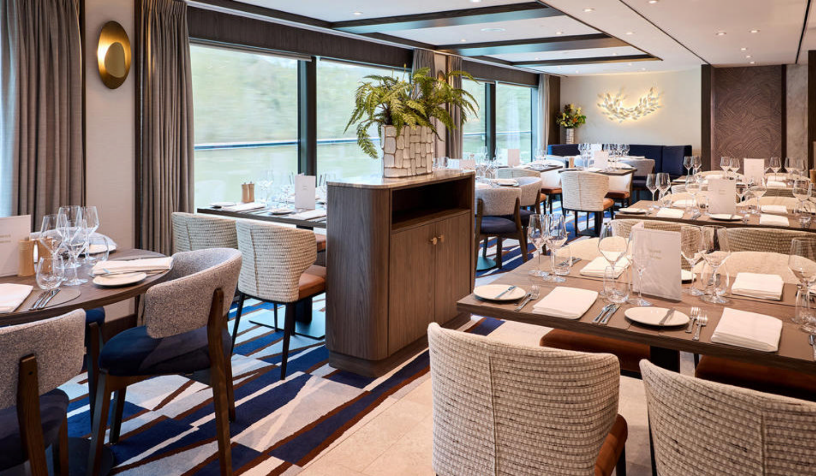
Hovedrestauranten Riverside med internasjonale og regionale retter om bord