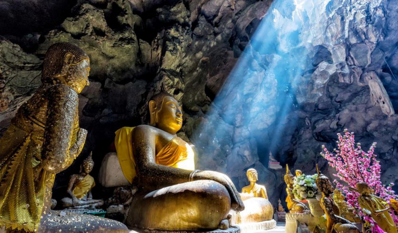
Dambulla bugner av hellige attraksjoner, som denne kjempebuddhaen

(Habarana / Sigiriya - ca. 18 km / 30 min)