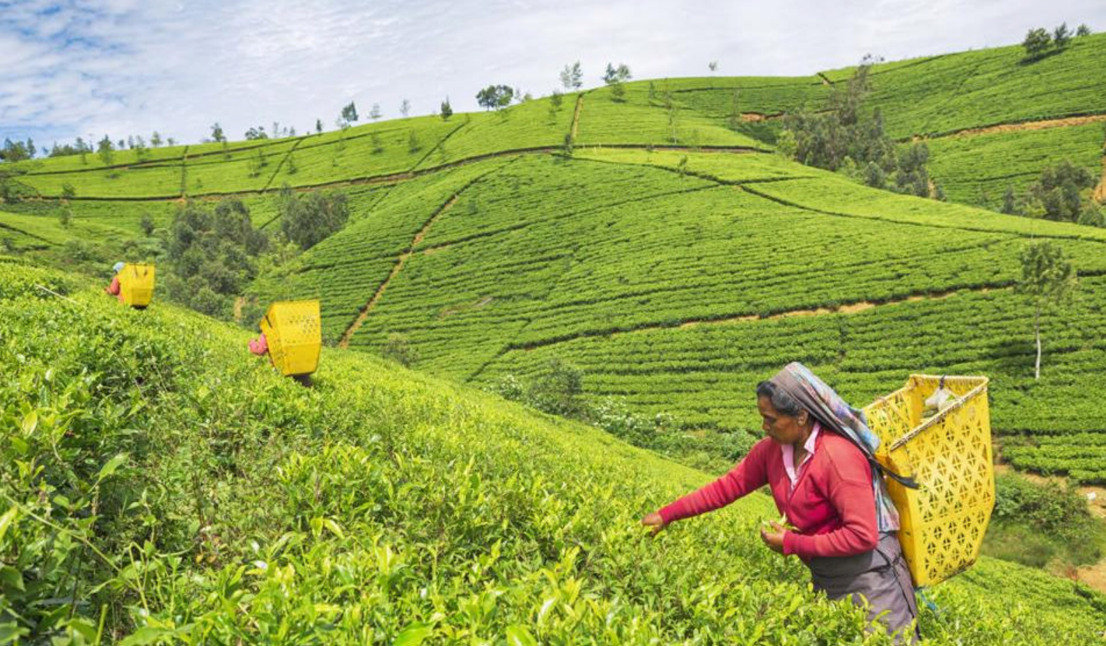
Se teplantasjer og berømm de hardtarbeidene bøndene

srilankisk matlaging, hvor dere også kan være med og tilberede to eller tre grønnsaksretter og studere den kulinariske kunsten til srilankisk matlaging og avslutte med å smake på den selvlagde lunsjen.