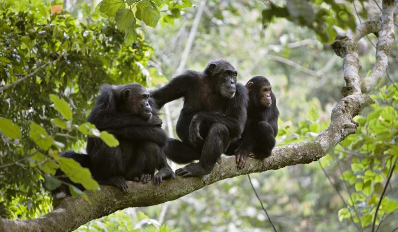
Sjimpanser i trærne