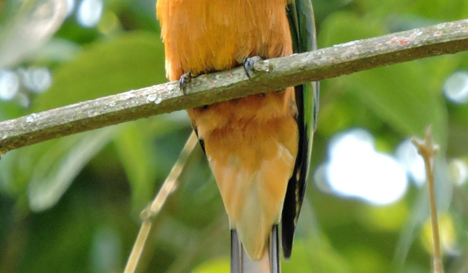
Fargerike fugler i jungelen

Måltider inkludert: Frokost, lunsj og middag Overnatting: Kabalega Resort