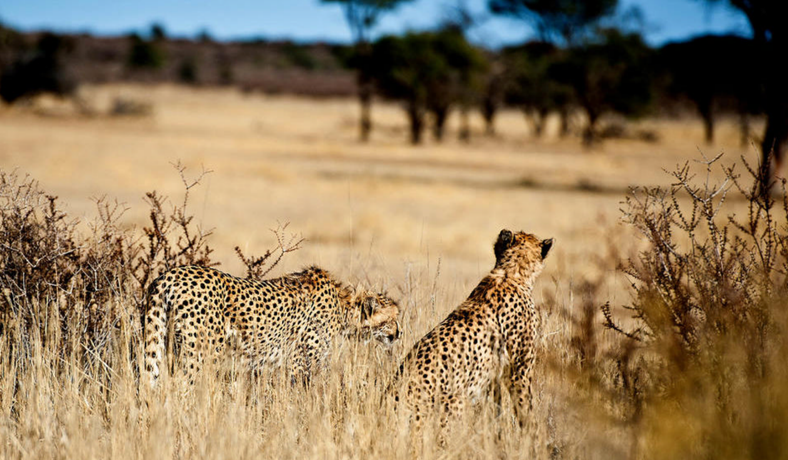
Ville dyr i Kalahariørkenen - her geparder

Måltider inkludert: Frokost, lunsj og middag Overnatting: Elephant Sands