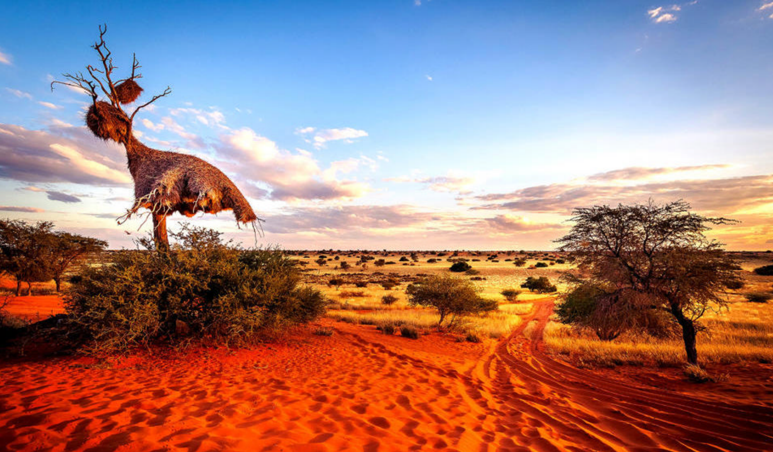
Enorme vidder i Kalahariørkenen - her et tre med reder for veverfuglen

dere skal overnatte. Campen består av store telt der dere har ekte senger å sove i og eget toalett, men ellers enkle fasiliteter. Til gjengjeld ligger den helt uforstyrret i det lille Khwai Conservation Area, som grenser til våtområdet, så dere har den unike naturen rett utenfor teltduken.