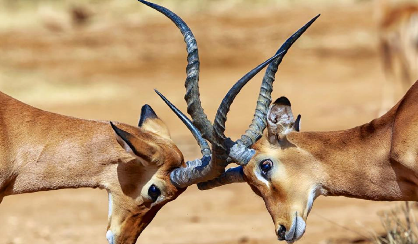
Impalaer som sloss i Samburu National Reserve - Safari i Kenya

Deretter legger dere ut på turens første game drive, utflukt for å se på dyrelivet, i dette fantastiske viltreservatet. Området er et lavlandsområde, som generelt er varmt og meget tørt.