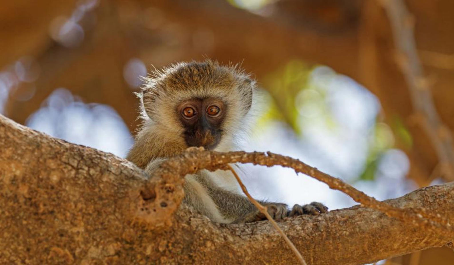
En ape i Samburu National Park - Safari i Kenya

Dagen er viet til safari i et av Afrikas absolutt beste dyrelivsområder! Du starter med en tidlig morgensafari, etterfulgt av en safaritur på ettermiddagen igjen. Hvis du ønsker en unik opplevelse så kan du være med på en ballongsafari med brunsj i det fri, noe som absolutt kan anbefales (ekstra kostnad, bør bestilles på forhånd).