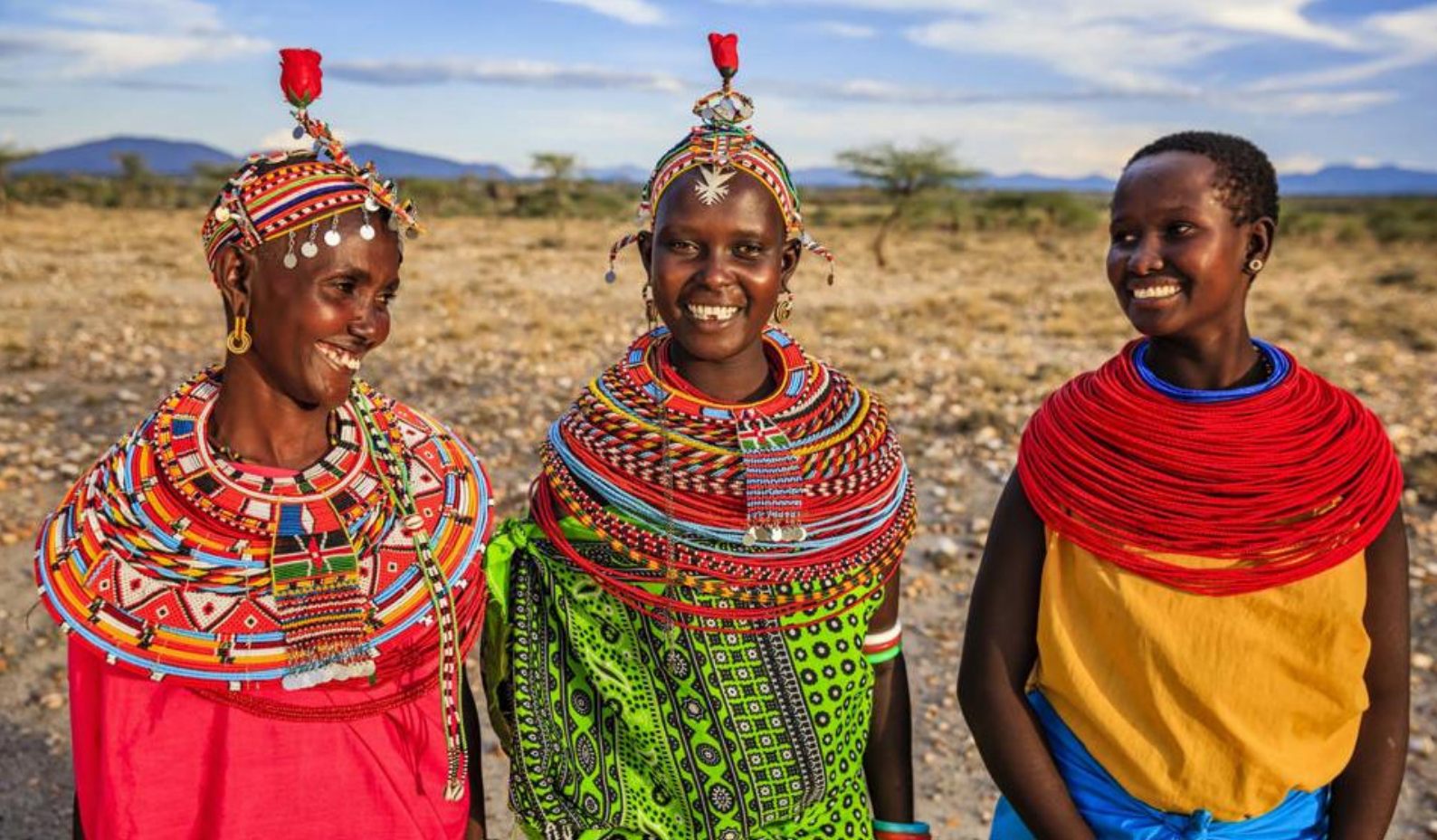
Stammefolk i Samburu - Safari i Kenya