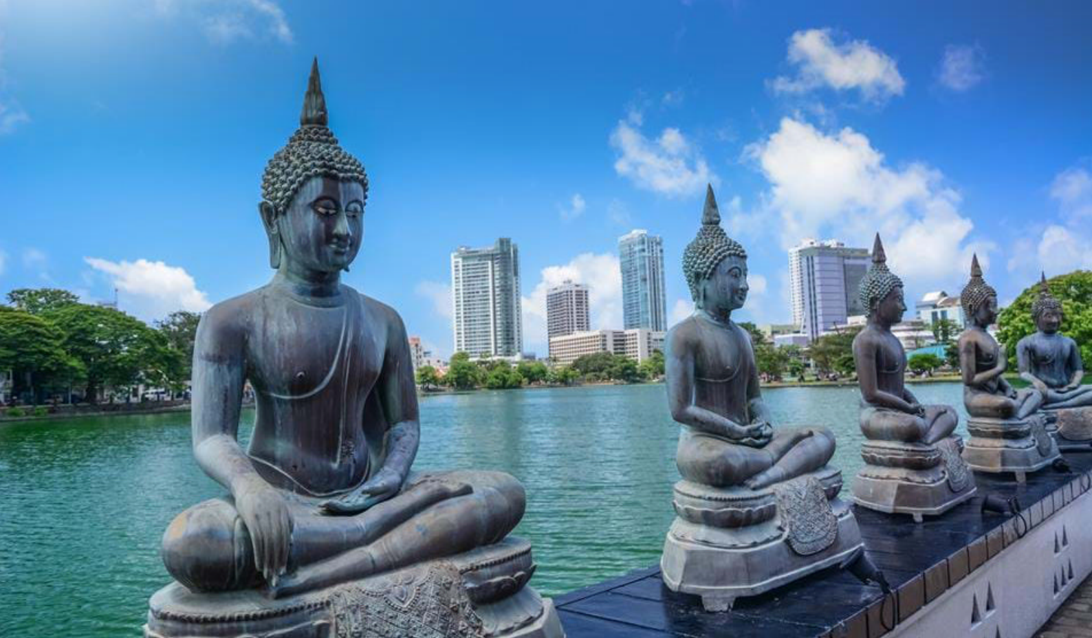
Buddhastatuer ved tempelet Seema Malaka på Beira Lake