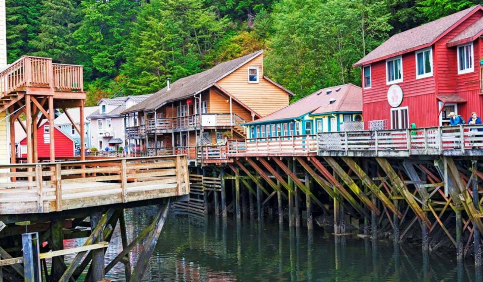
Ketchikan i Alaska