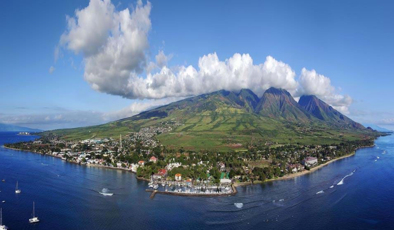
Maui på Hawaii

med de andre øyene, er Hawaii Island en forholdsvis ung øy og samtidig også den største i øygruppen - derav kallenavnet "The Big Island". Big Island har ikke like mange badestrender som de andre øyene, men til gjengjeld er øya hjemstedet til nesten alle værtyper som finnes på Jorda - alt fra snødekkede fjelltopper, regnfulle gressletter, vulkanske ørken og flotte, sorte sandstrender. Disse fenomenene er også grunnen til at Big Island skiller seg fra resten av øygruppen.