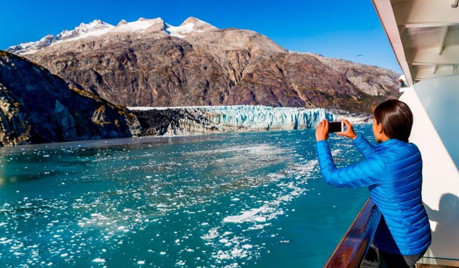
Glacier Bay National Park i Alaska

nasjonalpark. Bukten består av knallblå fjorder med tallrike tidevannsbreer og regnskogkledde fjellsider, hvor både grizzlybjørner og gjellgeiter lever. Det er også gode sjanser for å se hvaler, seler og ørner i bukten.