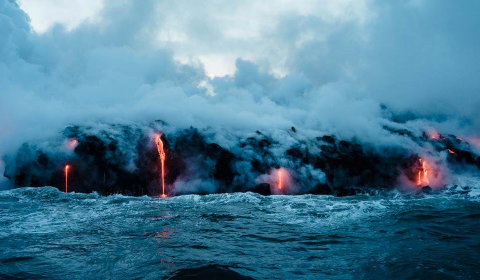
Vulkanen Kalapana Kilauea på Hawaii Island

(Diamond Head), nyter Hawaiis beste shopping, deltar i de interaktive aktivitetene i Polynesian Cultural Center eller bare slapper av på en av øyas flotte strender, vil opplevelsene vente bak ethvert hjørne.