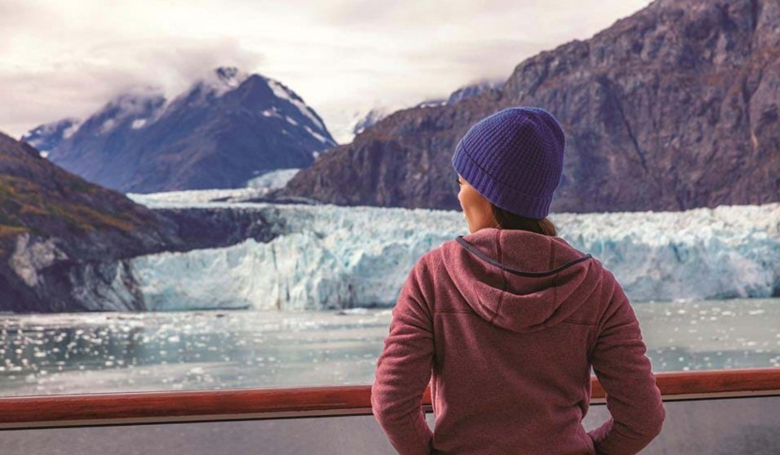
Glacier Bay National Park i Alaska