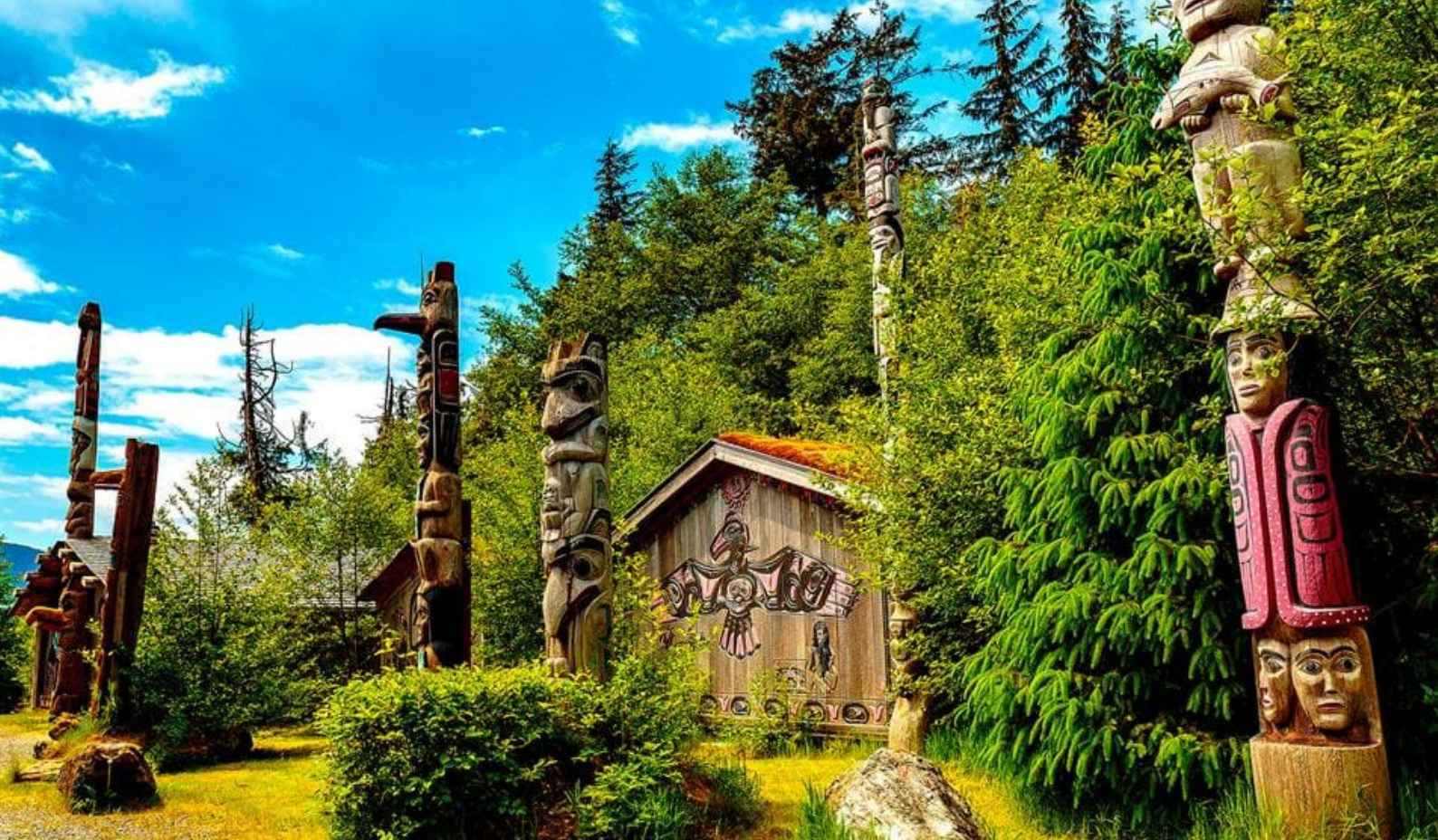
Ketchikan i Alaska