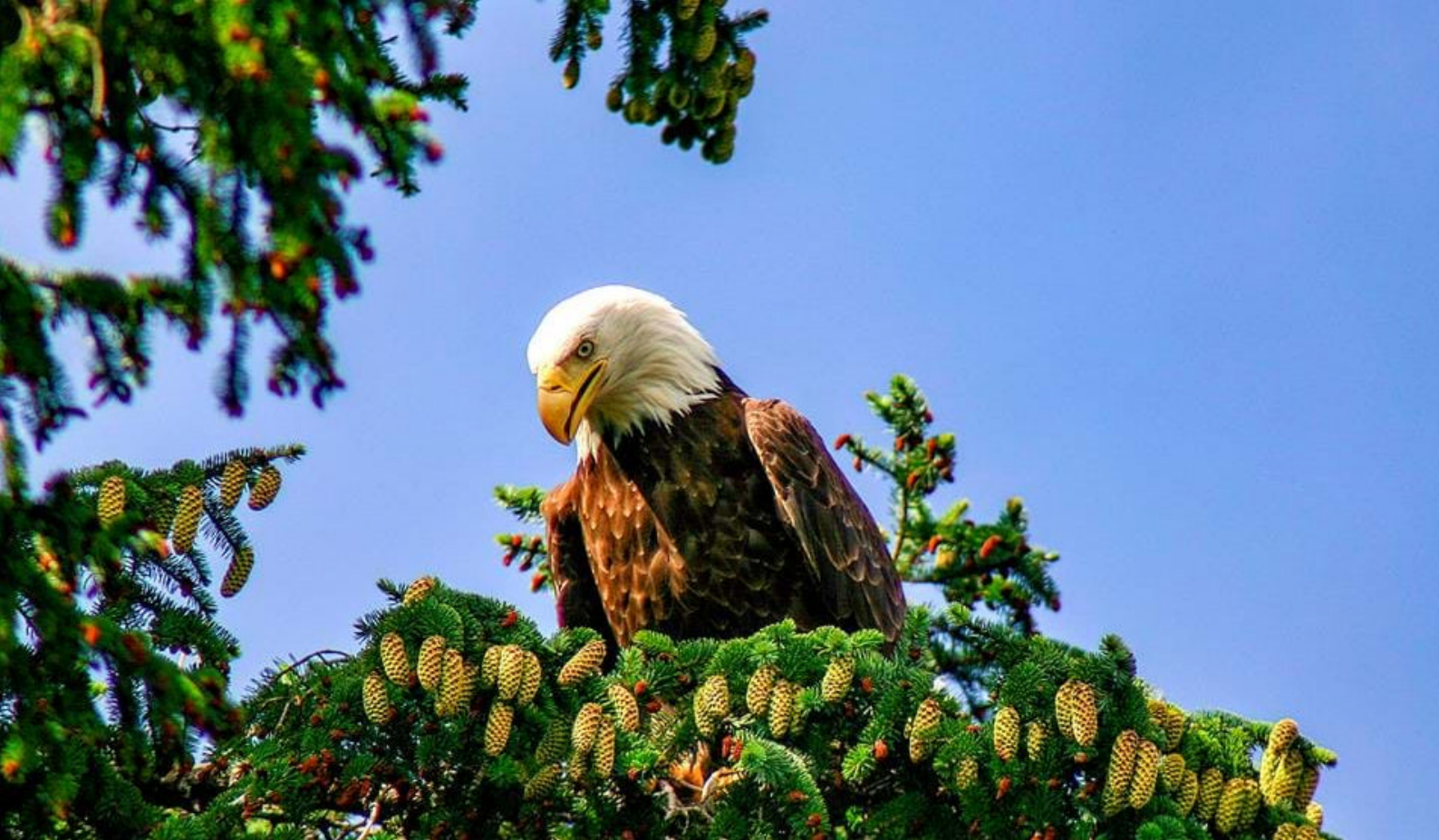
Hvithodet havorn i Alaska

Dere seiler fra Ketchikan og ut i Inside Passage igjen kl. 20.00.